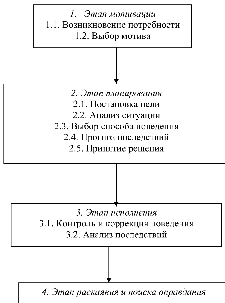
Схема 1. Психологическая структура преступного акта (по О.А. Гулевич)

Этап мотивации начинается с возникновения потребности. Большинство потребностей, которые приводят к совершению преступления, имеются у всех людей. К ним относятся физиологические потребности (в пище, отдыхе, сексуальная потребность и т.д.), потребность в безопасности, в общении с другими людьми, уважении с их стороны и власти над ними, познании и получении новых впечатлений, саморазвитии. Специфика преступного поведения раскрывается при выборе мотива. Чтобы удовлетворить сексуальную потребность или потребность во власти преступник решает изнасиловать женщину, чтобы удовлетворить потребность в общении - совершить преступление вместе со своими друзьями по криминальной группе и т.д.