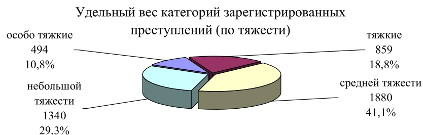
Рис. 2. Удельный вес категорий преступлений (по тяжести)

В 2008 г. удельный вес тяжких и особо тяжких преступлений в Чеченской Республике составлял 29,6%, что выше общероссийского (26,8%) и среднего по округам (26,5%) значений. Удельный вес особо тяжких преступлений в общем массиве преступности по сравнению с 2007 г. снизился на 0,8% и составил 10,8%, тяжких преступлений – сократился на 0,7% и составил 18,8% (см. рис. 2).