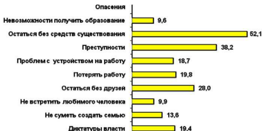
Чего опасается сегодня российская молодежь, в %

В основном эти же опасения характерны и для старшего поколения. Единственное, что обращает на себя внимание, так это естественный для молодых людей более высокий жизненный тонус, который позволяет им психологически легче переживать реальные и возможные жизненные трудности, чаще пребывать в хорошем настроении (см. табл. 3).