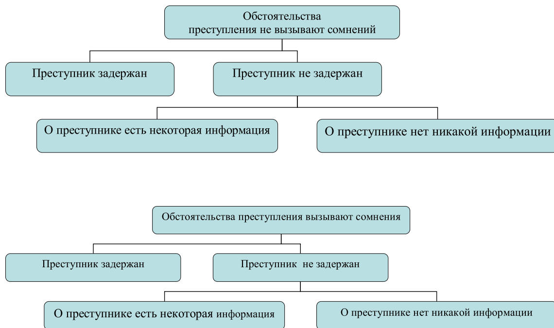
Схема 3. Типичные исходные ситуации расследования грабежей и разбойных нападений

жей и разбойных нападений, можно отобразить в виде следующей схемы: