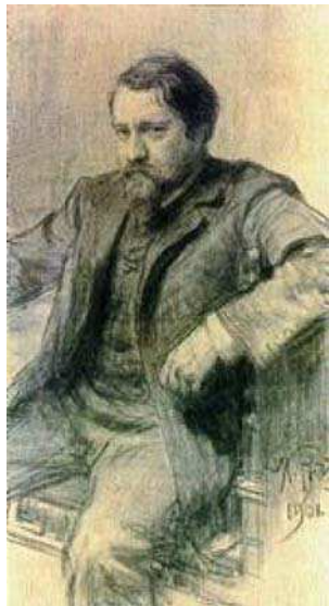
И.Е. Репин. Портрет В.А. Серова.