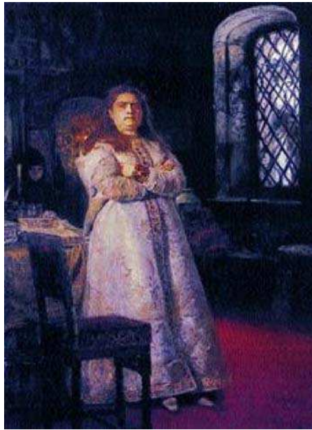
И.Е.Репин. “Царевна Софья”.

В откликах на книги отмечалась излишняя скромность автора, который "все время не забывает, что пишет не о себе, а о композиторе Серове и художнике Серове". Печать отмечала также хороший литературный язык и высшей степени правдивость повествования.