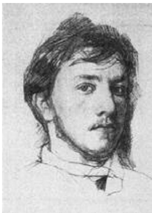
Художник В.А. Серов. Автопортрет.

Маленький Тоша (от "Валентоша" — так звали в семье сына) рано увлекся живописью и больше ничем заниматься не хотел, часто пропускал занятия в гимназии. Директор гимназии жаловался матери, что даже "в углу", куда ставили его в наказание учителя, мальчик ухитрялся рисовать их портреты, причем так хорошо, что те просили отдать им рисунки на память. После перенесенной болезни ушей он остался глухим на одно ухо.