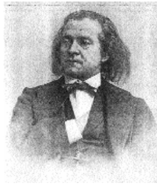
Композитор А.Н. Серов.

Александр Николаевич поведал жене, что оперу "Юдифь" он написал "случайно": «Меня очень обозлила эта "синагога"» (синагогой он прозвал консерваторию за преобладание в ней преподавателей еврейского происхождения). На какое-то обсуждение не пригласили ни одного русского, "зная, что русские не хуже их образованы, — продолжал Серов. — Я же не был приглашен под тем предлогом, что я только критику пишу; поэтому поусомнились в моих музыкальных способностях. Ну, я вот разозлился и показал им, что писать я и оперы умею".