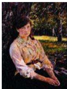
В.А. Серов. “Девушка, освещенная солнцем”.