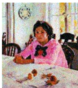
В.А. Серов. “Девочка с персиками”.

Здесь она создавала столовые для бастующих рабочих, устраивала для них передвижную "народную консерваторию", продолжала заниматься творчеством. Деревня на время была забыта. "Но, — пишет Серова, — не забыли ее мои противники. Лучшая часть моего хора была заключена в тюрьму и отправлена в Туруханский край на пять лет. Громом поразило меня это известие... Меня хватил удар, и вся правая сторона оказалась парализованной. Врачи строго-настроено запретили мне всякую деятельность, связанную с композиторством".