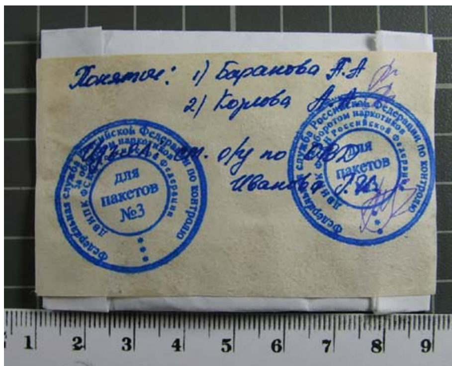
Рис. 2. Сверток, представленный на исследование, (внутренняя сторона)

После вскрытия упаковки внутри обнаружены две однотипные двояковыпуклые цилиндрические таблетки (см. рис. 3) неоднородного бежевого цвета, имеющие линейные размеры 8,6 x 3,7 мм, с плохо различимым тиснением на одной из сторон, без выраженного запаха. Масса таблеток составила 0,200 г.