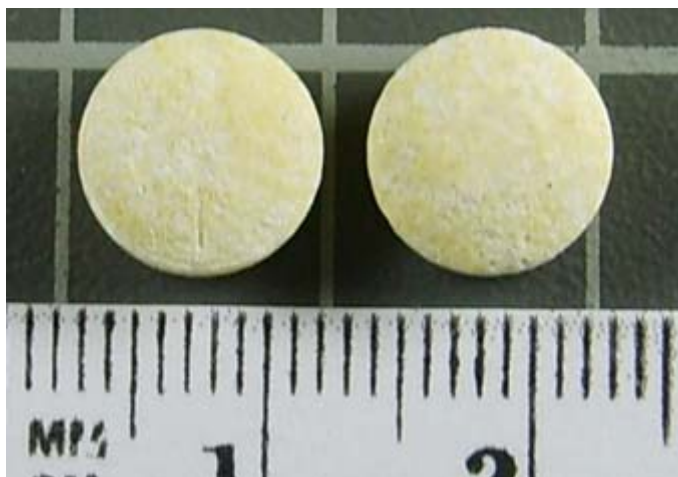
Рис. 3. Таблетки, обнаруженные в свертке

Пробоподготовка. От каждой таблетки отбирали среднюю пробу массой 0,05 г. Измельченную таблеточную массу пробы заливали метанолом, соблюдая соотношение масса пробы – растворитель 1:1, с добавлением одной капли концентрированного раствора аммиака.