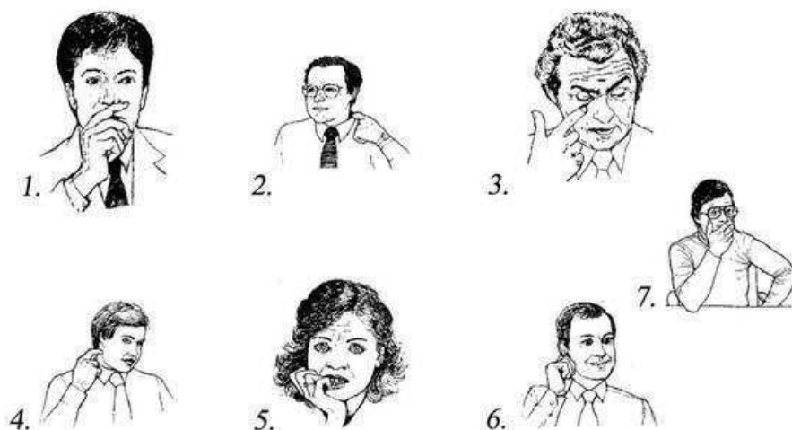
Рис. 1. Поведенческие признаки лжи

Продолговатая улыбка собеседника (губы слегка оттянуты назад от верхних и нижних зубов, образуя продолговатую линию губ, а сама улыбка не кажется глубокой) показывает на внешнее приятие, официальную вежливость другого человека, но не на искреннее участие его в общении симпатию. Оборонительная позиция и антагонизм оценивается при виде плотно сжатого рта и мышц челюсти, а также косога взгляда в вашу сторону.