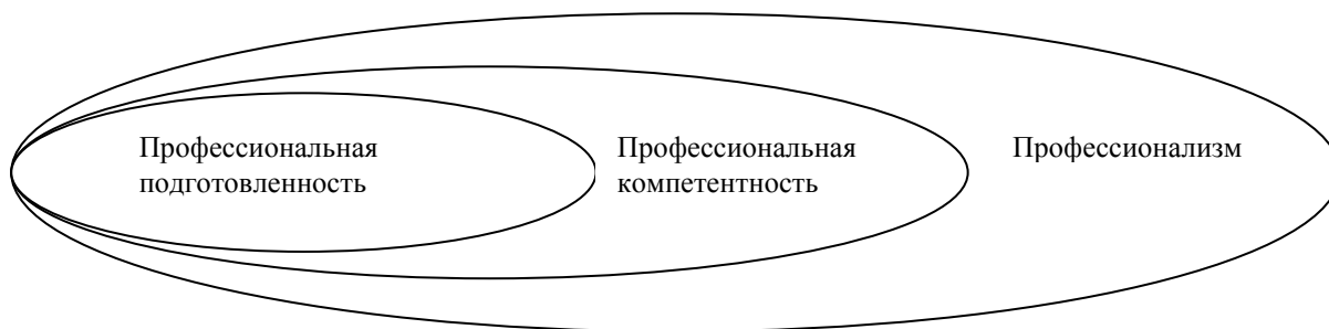
Рис. 1. Соотношение понятий «профессионализм», «профессиональная компетентность» и «профессиональная подготовленность»

Эти понятия имеют одинаково направленный вектор совершенства деятельности, высшего качества и уровня ее осуществления. Профессионализм человека наряду с компетентностью и подготовленностью обеспечивается профессиональной направленностью и наличием профессионально значимых качеств личности.