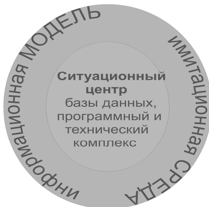
Рис. 1. Модель ситуационного центра

Центральной частью модели ситуационного центра являются: база данных, программный и технический комплекс, которые используются для создания имитационной среды и её поддержки (см. рис. 1). В базу данных должны входить различные по формату информационные потоки, обеспечивающие статические и динамические режимы работы. Для обеспечения экспертной среды созданы алгоритмы принятия решения, которые поддерживаются программным комплексом для осуществления оперативно-тактических расчетов.