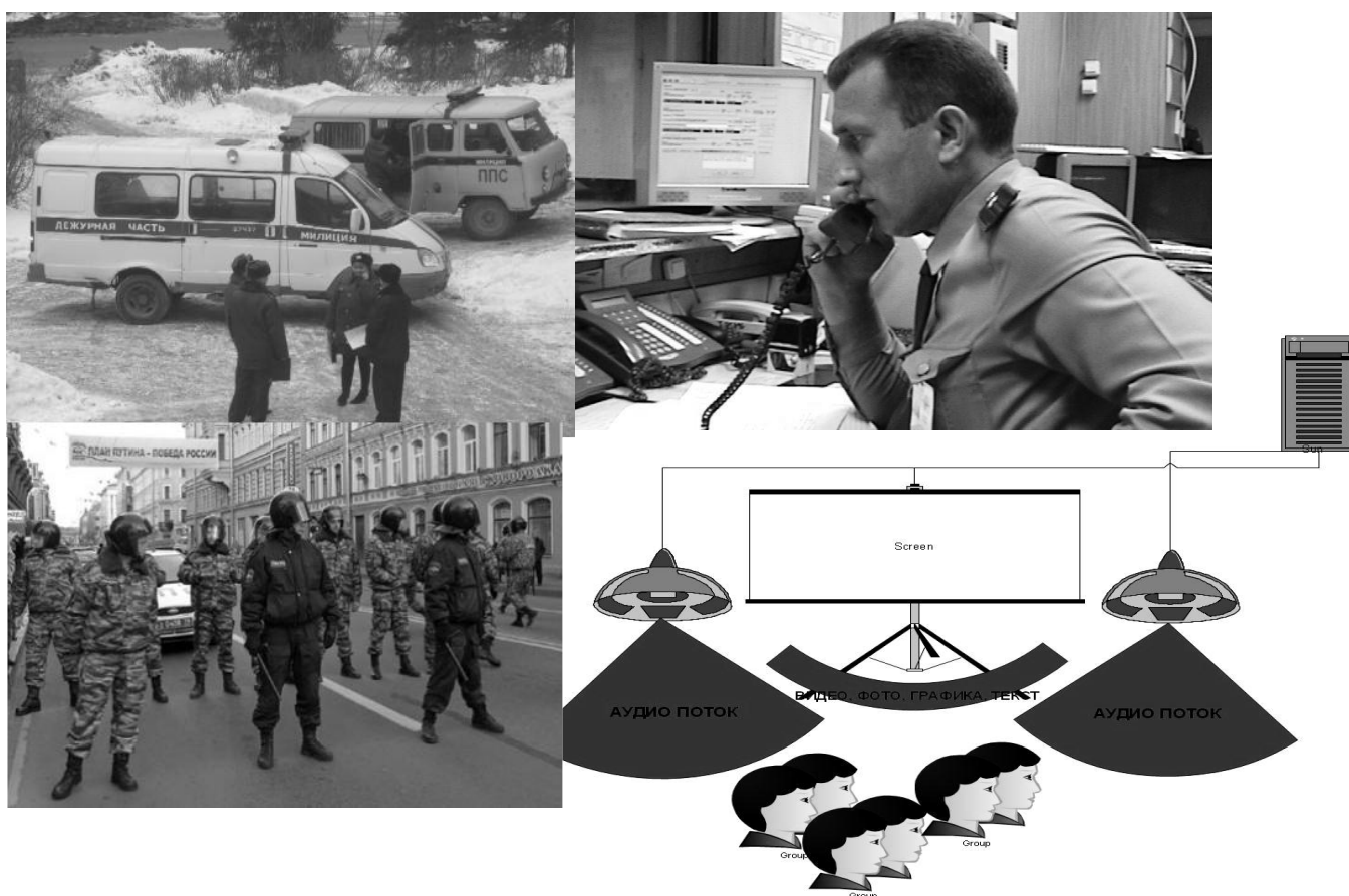
Рис. 4. Схема представления информации в ситуационном центре

Также с момента начала работы оперативного штаба через динамики в аудиторию поступает аудиосигнал радиопереговоров патрульно-постовых нарядов, следственно-оперативных групп и дежурного по ОВД, а после начала специальной операции – переговоров старших функциональных групп.