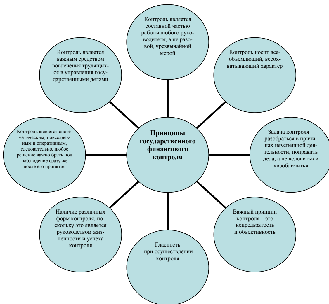
Рис. 2. Принципы государственного финансового контроля по В. И. Ленину

нин подчеркнул сущность контроля, сформулировав принципы его организации и осуществления (рис. 2).