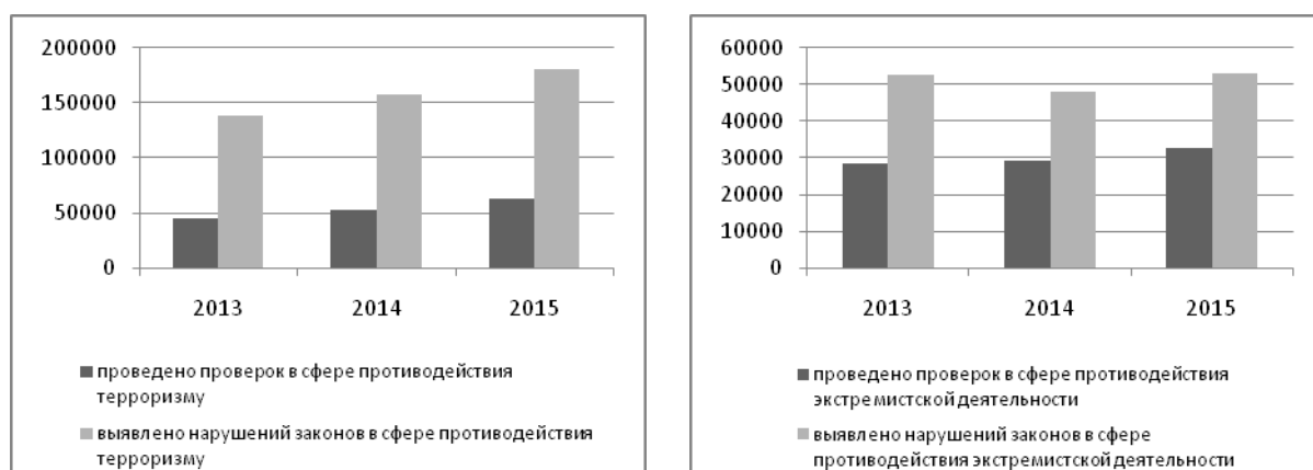
Рис. 1. Результаты работы прокуратуры в сфере противодействия терроризму и экстремистской деятельности

Кроме того, в 2015 г. в суды прокурорами направлено более 19 778 заявлений (в 2014 г. – 19 245) об обязанности органов власти субъектов, муниципалитетов и руководителей организаций обеспечить надлежащий уровень безопасности объектов и территорий.