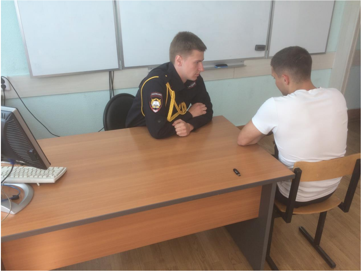
Рисунок 3. Допрос в условиях доверительного пространственного расположения

Г) Допрашиваемый (чаще всего руководитель) находится в своем рабочем кабинете за рабочим столом, а следователь за дополнительным столом на некотором удалении (Рисунок 4). Такая ситуация ставит следователя в ситуацию зависимости, подчинения, что может негативно сказаться на результате допроса. Рекомендуется перенести такой допроса в рабочий кабинет следователя, где инициатива вновь вернется к следователю, и он сможет в зависимости от тактического замысла выбрать расположение участников, описанное в пунктах А-В.