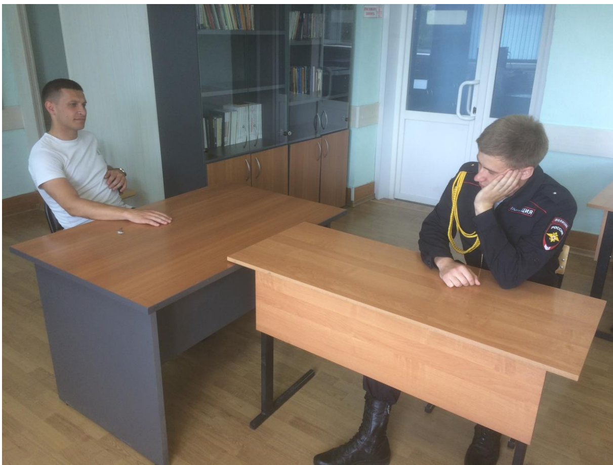
Рисунок 4. Допрос в условиях пространственного доминирования допрашиваемого

Анализ вербальной активности подозреваемого (обвиняемого) позволяет получить косвенные психологические признаки, указывающие на его виновность: