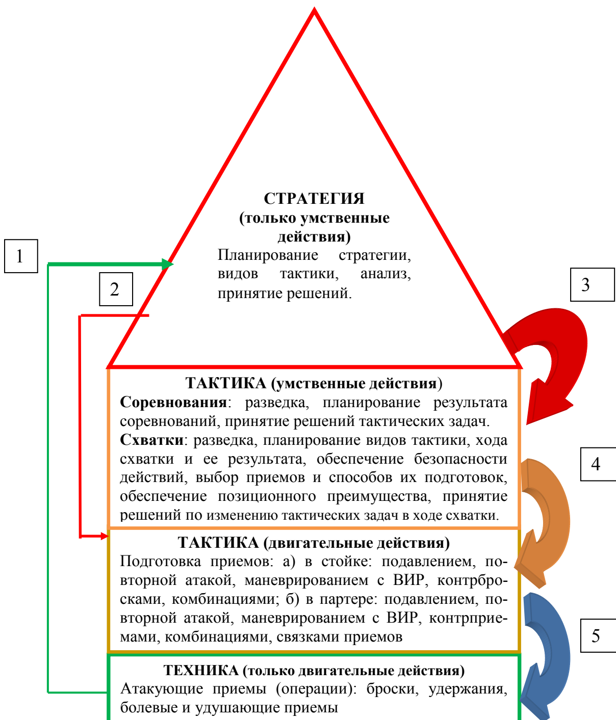
Рис. 1. Универсальная схема соотношения и взаимного влияния стратегических, тактических и технических действий на примере соревновательной деятельности спортсменов-самбистов:

1 – влияние наличия средств (техники) на возникновение стратегической цели деятельности; 2 – влияние стратегических планов на формирование тактических действий; 3 – влияние стратегических решений на принятие тактических решений; 4 – влияние тактических решений на выполнение двигательных (подготавливающих) тактических действий; 5 – влияние тактических действий на выполнение технических действий (приемов)