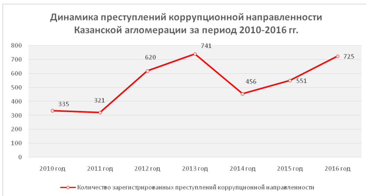
Рис. 1. Динамика преступлений коррупционной направленности в Казанской агломерации за период 2010–2016 годы

Темп роста преступлений рассматриваемой направленности в период 2015–2016 гг. составляет 131,57%, темп прироста 31,57%. Темп снижения преступлений в период с 2013 года по 2014 год составляет 61,53%.