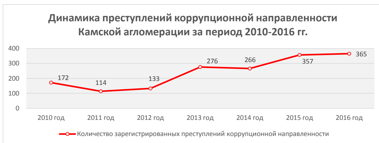
Рис. 2. Динамика преступлений коррупционной направленности в Камской агломерации в период 2010–2016 годы

В период с 2010 по 2016 годы абсолютный рост зарегистрированных преступлений составил +193 преступления (повышение в 2,12 раза), а с 2015 по 2016 годы +8 преступлений (повышение в 1,02 раза). При этом абсолютное снижение зарегистрировано с 2010 по 2011 годы и составило 58 преступлений (снижение в 1,5 раза).