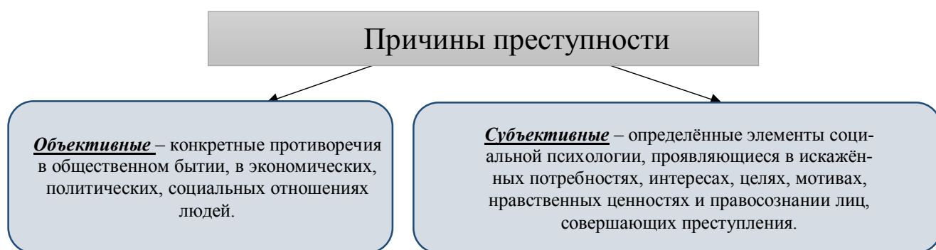
Схема №1. Причины преступности.

Причины преступности – социально – психологические детерминанты (причины и условия), которые непосредственно порождают и воспроизводят преступность и преступление как своё закономерное следствие. Существуют объективные и субъективные причины преступности. (см. схема №1).