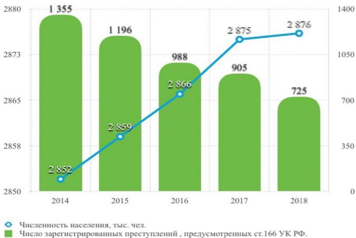
Диаграмма №1. Преступность в Красноярском крае. Корреляционная зависимость населения и зарегистрированных угонов транспортных средств.