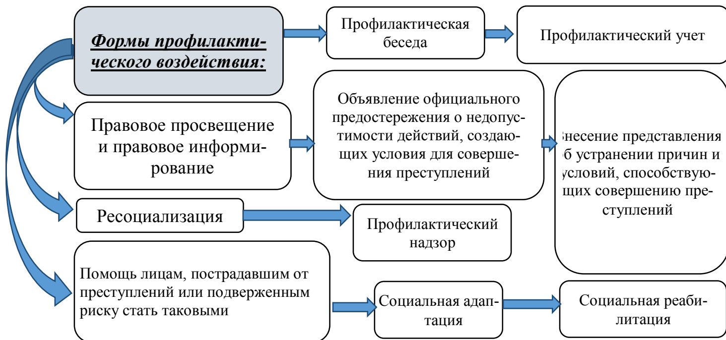
Схема № 2. «Формы профилактического воздействия».

Для применения предупредительных мер, направленных на устранение криминогенных факторов, порождающих угоны транспортных средств, необходим комплексный подход в организации эффективной профилактической деятельности. Такой подход обуславливает система профилактики преступности, которая состоит из следующих элементов: