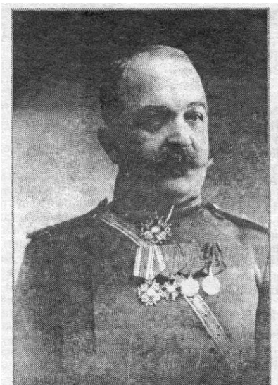
Становой пристав Брянского уезда

Таким образом, к середине XIX в. в городах Российской империи существовали должности квартальных надзирателей, к функциональным обязанностям которых относились полицейские задачи местного значения, сущность которых генетически близка к задачам современной службы участковых полиции, в сельской же местности наметился процесс разукрупнения административно-полицейских единиц с неизбежным формированием новых должностей – станы и становой приставы.