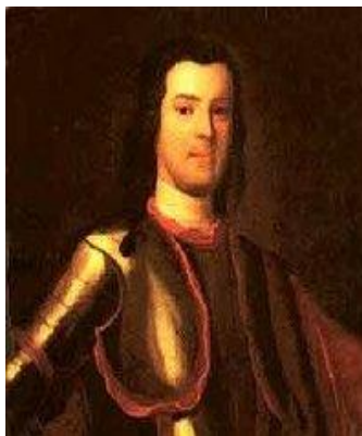
Антон Девиер – первый генерал-полицмейстер Санкт-Петербурга

С петровских реформ начала XVIII в. начинается история регулярных полицейских формирований.