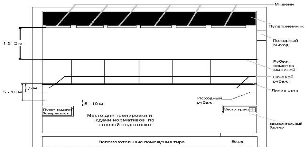
Рисунок 1. Типовая схема устройства и оборудования тира в подразделении ОВД