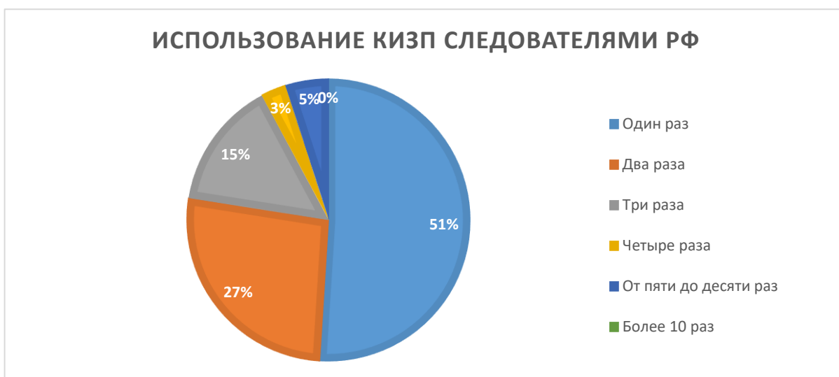
Рисунок 1.1 Использование контроля и записи переговоров следователями России (Л.И. Ивченко)

Согласно исследованию Л.И. Ивченко, лишь около половины всех опрошенных следователей осуществляли контроль и запись телефонных и иных переговоров (54,8%). Из них один раз в своей практике осуществляли контроль и запись переговоров 51% респондентов, дважды – 26,5%; трижды – 14,7%; четыре раза – 2,9%; от пяти до десяти раз 4,9%; более 10 раз – ни одного следователя 24 .