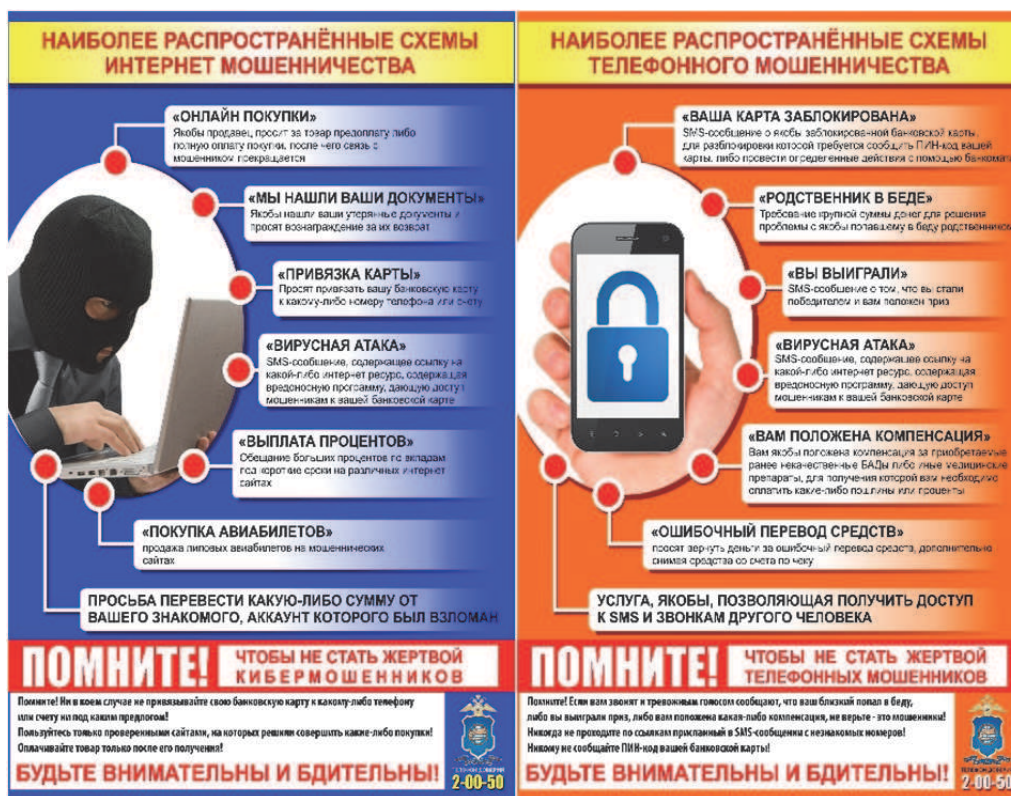
Рис. 2. Схемы мошенничеств

Основой профилактической деятельности должна стать систематическая работа со средствами массовой информации, а именно телевидением, радио, газетами, а также с различными интернет-ресурсами, в том числе социальными сетями.