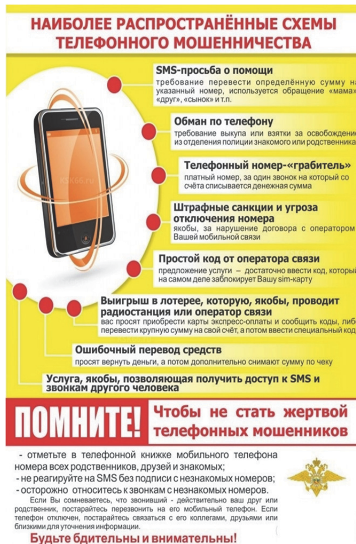
Рис. 3. Информационная памятка о телефонном мошенничестве

В качестве меры профилактического характера правоохранительным органам необходимо доводить до населения основные признаки мошенничества с использованием мобильных средств связи: