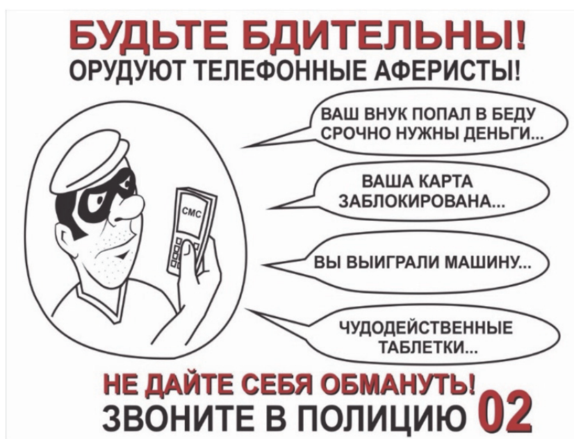
Рис. 1. Основные виды телефонных мошенничеств

Важным аспектом успешного противодействия телефонному мошенничеству является профилактическая деятельность, включающая выработку среди граждан способности распознавать потенциальных мошенников и не поддаваться манипуляциям с их стороны (рис. 1).