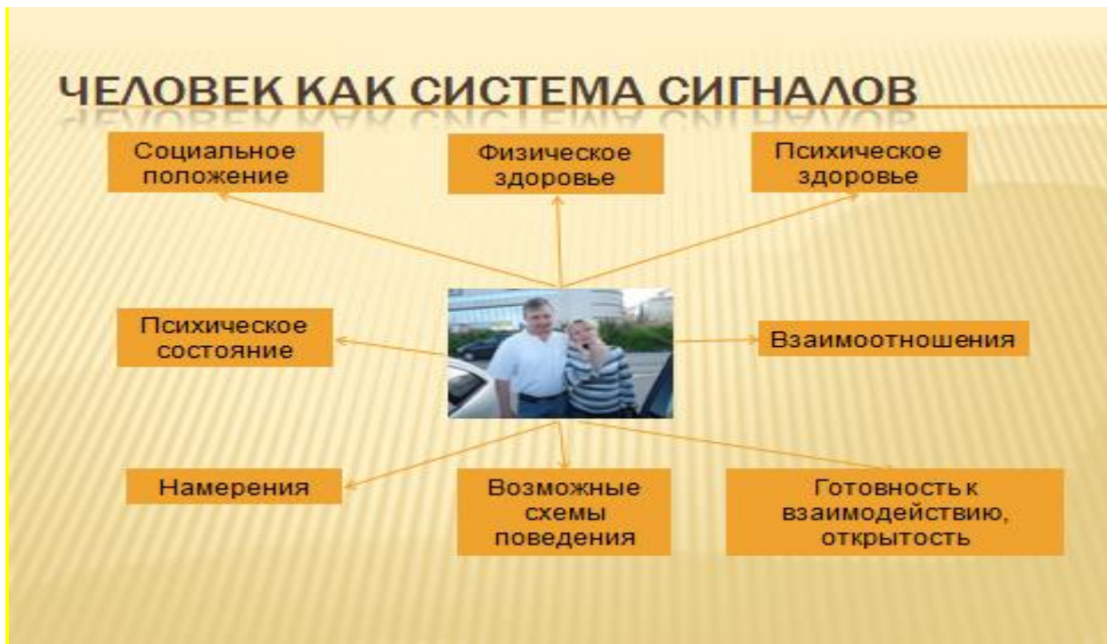
Рис. 4. Человек как система сигналов

Рассогласование между содержанием речи и жестов партнера по общению может стать видимым для сотрудника по нескольким причинам. Во-первых, установлено, что человек способен сознательно контролировать (держать в поле внимания) в среднем 7 \pm 2 объекта.