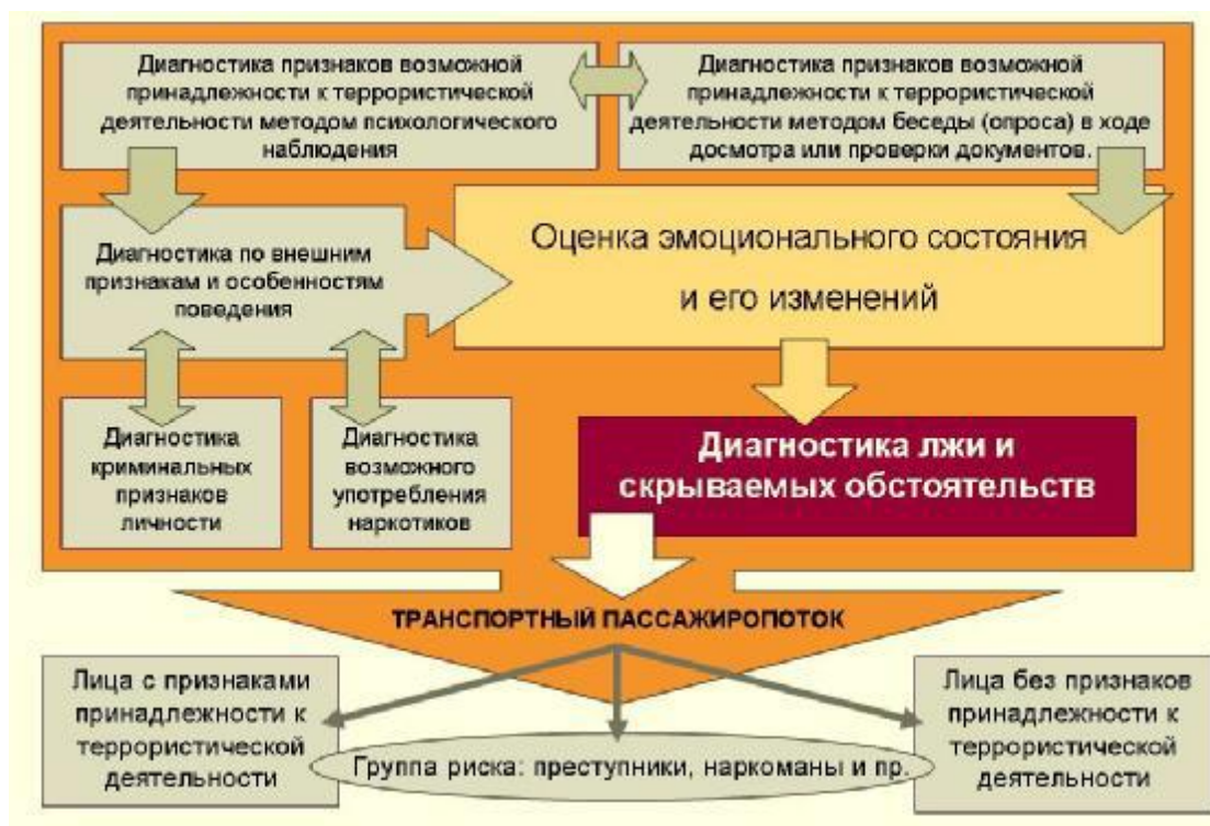
Рис. 1. Схема профайлинга

Термин «профайлинг» не имеет точного перевода с английского языка. Данное слово относится к сленговой терминологии и берет свое начало от английского «profile» — профиль. Концепция профайлинга как раз и основывается на построении профиля преступника. Основное методологическое положение заключается в том, что лица, совершившие преступление или собирающиеся его совершить, характеризуются наличием определенного набора подозрительных признаков во внешности и поведении.