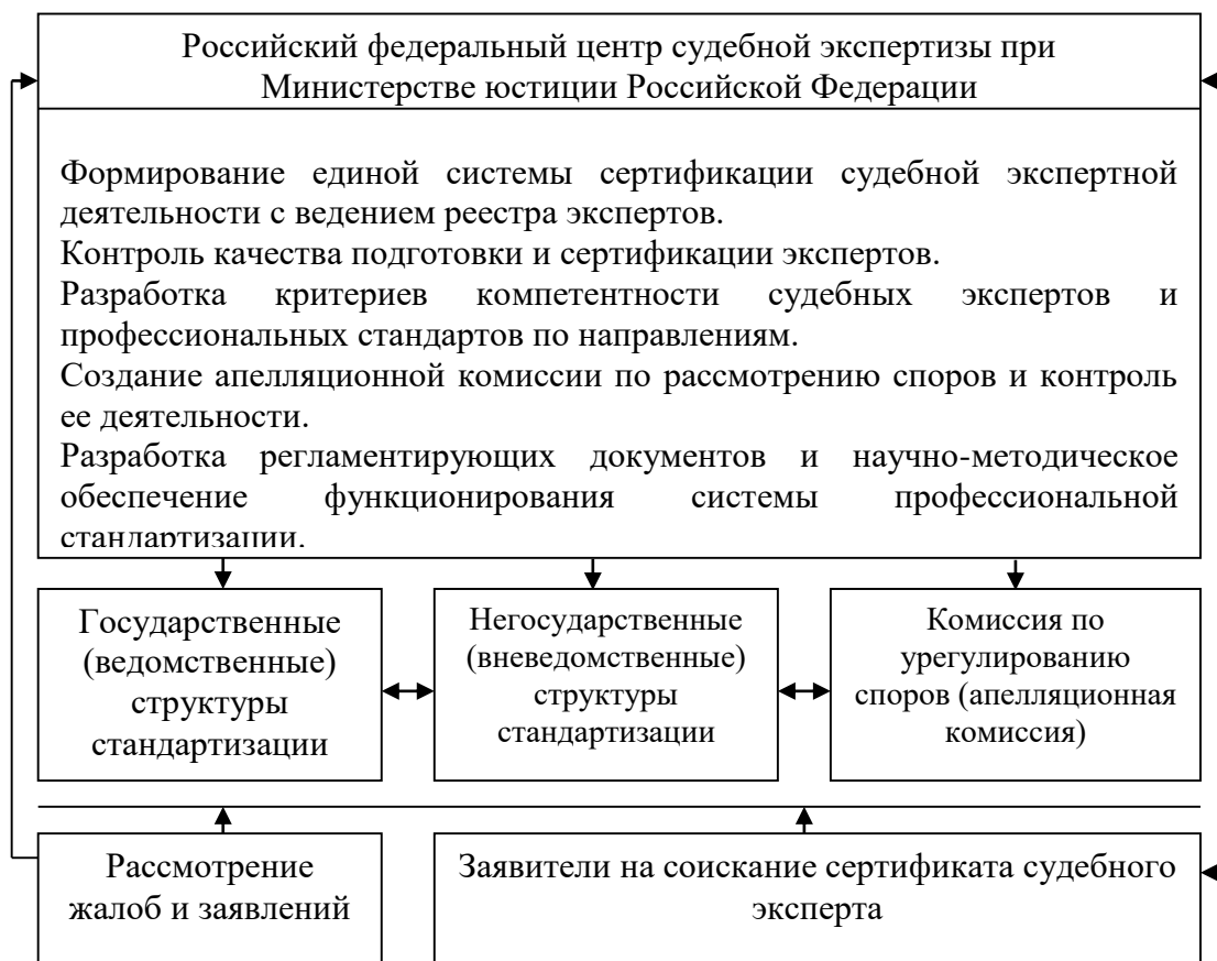
Рис. 2. Схема системы профессиональной стандартизации и контроля качества экспертной бухгалтерской деятельности

государственных органов, которым может являться РФЦСЭ. Государство должно быть заинтересовано в подобном контроле, так как рассматриваемая сфера деятельности прямо и косвенно влияет на экономическую безопасность, состояние противодействия экономической преступности, уровень доверия общество к государственной политике и др.