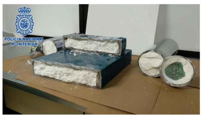
Cocaína incautada en el Aeropuerto de Barajas.

A partir de octubre se retomaron muchos vuelos y destinos hasta ese momento suspendidos por la pandemia.