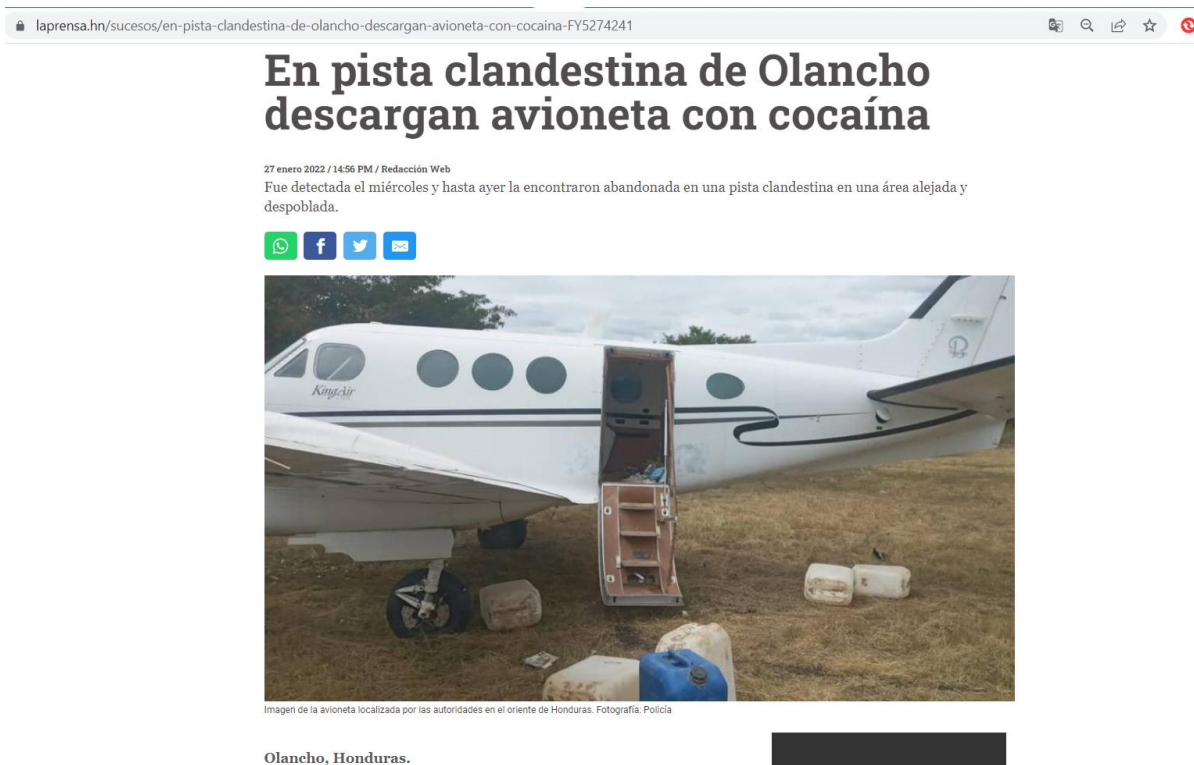
Рисунок 1.1 «Тайная взлетно-посадочная полоса, обнаруженная в Гондурасе»

Преступники могут даже подыскивать специальные места, которые в значительной степени маскируют их незаконную деятельность. Например, в январе 2022 года сотрудниками Национальной полиции Гондураса была обнаружена тайная взлетно-посадочная полоса, на которой был брошен самолет с признаками незаконной перевозки кокаина (см. рисунок 1.1) 24 .