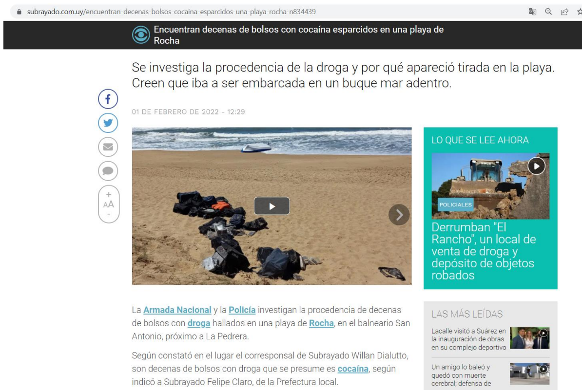
Рисунок 1.6 «Сумка с наркотиками, найденная на пляже в Роche, на курорте Сан-Антонио, недалеко от Ла-Педрера»

Предмет преступления может оставлять различные следы к таковым относятся: