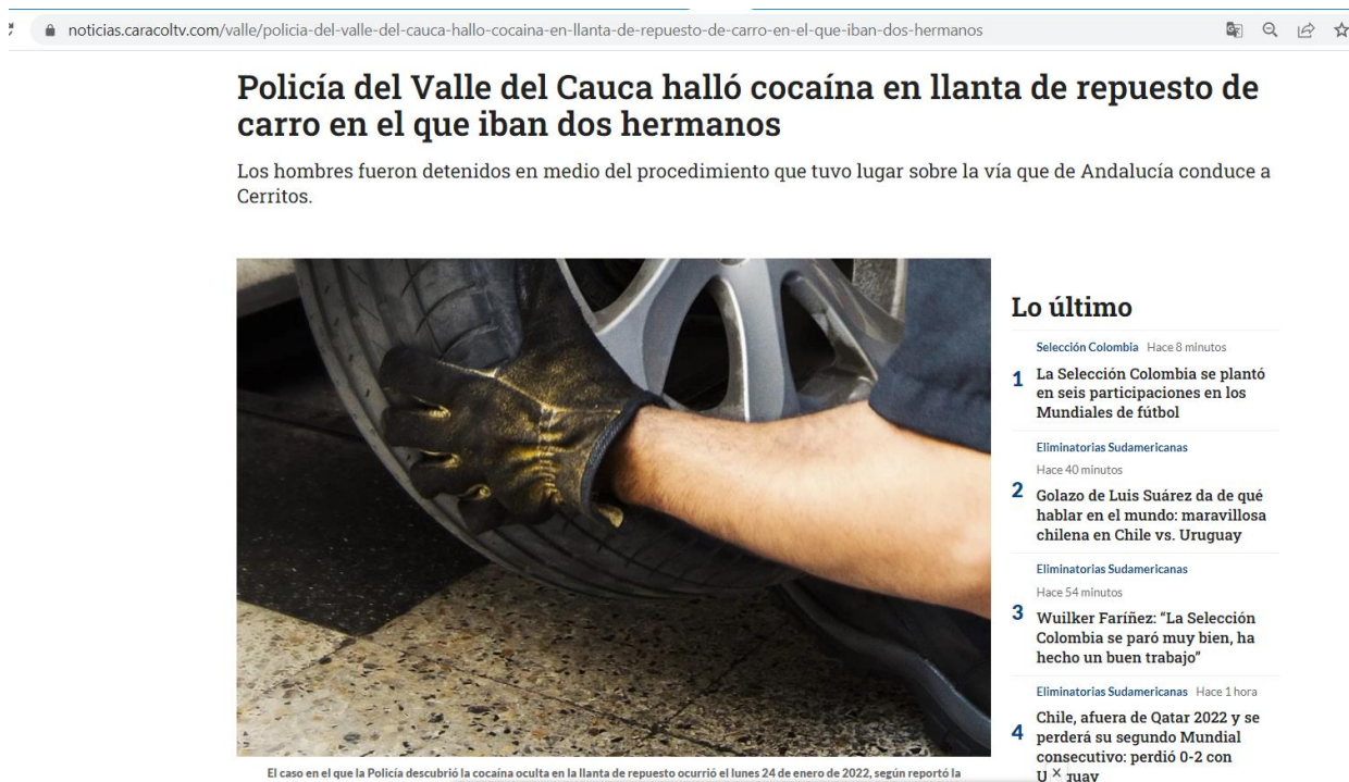
Рисунок 1.2 «Тайник с кокаином, оборудованный в запасном колесе автомобиля»

автомобиля власти обнаружили наркотик, замаскированный в запасном колесе», – заявили в следственном органе, отметив, что процедура имела место на дороге, ведущей из Андалусии в Черритос (см. рисунок 1.2) 25 .