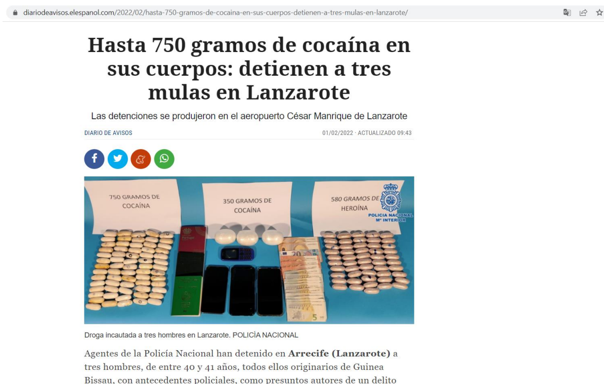
Рисунок 1.5 «Обнаруженный в результате рентгенологического исследования кокаин, перевозимый внутри тела человека»

Так, агенты национальной полиции арестовали в Арресифе (Лансароте) трех мужчин из Гвинеи-Бисау, на которых имелось полицейское досье, как на предполагаемых виновных в совершении преступления в сфере незаконного оборота наркотиков, а именно их перевозка в теле. Аресты были произведены в аэропорту имени Сезара Манрике на Лансароте в январе 2022 года, и агенты в ходе своей миссии по выявлению возможного маршрута, используемого «мулами» для доставки наркотиков на остров, проверили устройство, установленное 23 января на трех мужчинах, которые прошли соответствующие рентгенологические исследования, о чем сообщает полиция. Далее оперативники обнаружили, что эти люди прятали в своем теле 750 и 350 граммов кокаина, а также 580 граммов героина соответственно (см. рисунок 1.5) 30 .