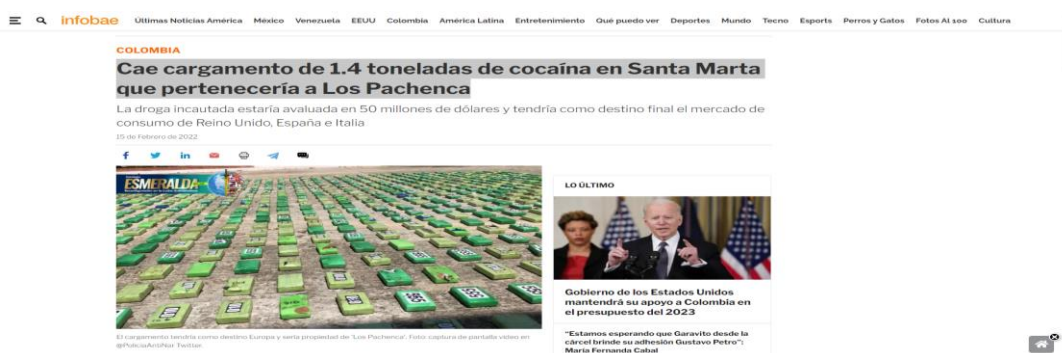
Рисунок 1.4 «1400 прямоугольных пакетов, обнаруженных в 2 контейнерах с грузом экспортных бананов»

В феврале 2022 года Национальной полицией Колумбии удалось изъять 1,4 тонны гидрохлорида кокаина в контейнерах с грузом бананов, которые направлялись в порт г. Антверпен, Бельгия. Наркотик был конфискован в ходе двух операций путем досмотра товаров после того, как полиция получила оперативную информацию о некоторых контейнерах с грузом экспортных бананов, в связи с чем они развернули операцию по обнаружению тайника. «Во время обыска и проверки этих крытых контейнеров сотрудники Управления по борьбе с наркотиками обнаружили 2 контейнера с 1400 прямоугольными пакетами, обмотанными лентами разного цвета, с порошкообразным веществом, которое при проведении Утвержденных предварительных идентификационных испытаний подтвердило содержание гидрохлорида кокаина, с массой 1,4 тонны» – сказал национальный директор по борьбе с наркотиками, генерал-майор Рикардо Аугусто Аларкон (см. рисунок 1.4) 28 .