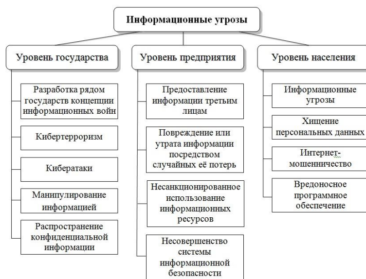
Рисунок 1. Типы информационных угроз

Так, сущность данного понятия наглядно отражается при анализе типов информационных угроз (рис. 1).