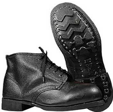
Фото 17. Ботинки.

пользуют одинаковую подошву для создания нескольких видов обуви и поэтому при исследовании следов обуви допускается вероятный вывод при установлении группы. Например, «След обуви мог быть оставлен подошвой ботинок, сапог» (фото 17, 18).