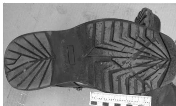
Фото 5. Подошва ботинка на правую ногу, изъятая у гр. А.