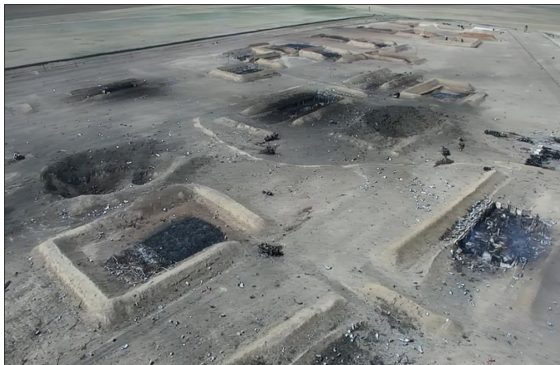
Фото 7. Место расположения разрушенного хранилища (после пожара и взрыва)