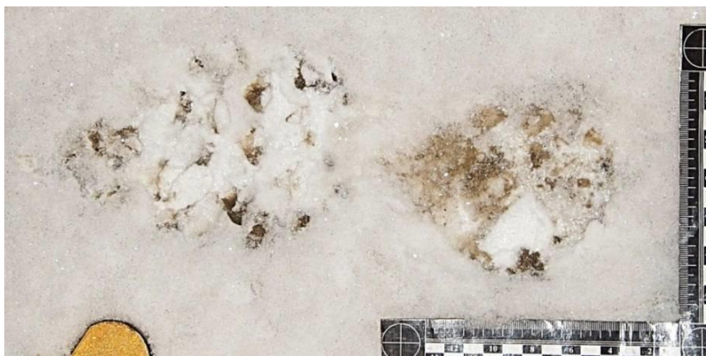
Фото 13. След обуви

Иначе говоря, при исследовании следа обуви обнаружены только общие признаки, их качество и количество достаточно для установления группы обуви.