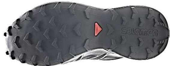
Фото 15. Подошва кроссовок

Таким образом, эксперт устанавливает группу для дальнейшего сужения поиска обуви (исключает подошву обуви сандалий, сапог, туфель и т. п.).