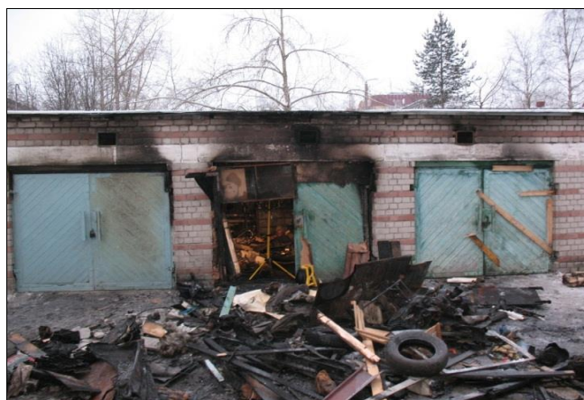
Фото 3. Общий вид повреждений гаражного бокса

В процессе осмотра места происшествия были детально изучены повреждения конструкций, сделаны смывы на предмет наличия ВВ, а также взята проба воздуха из погреба одного из взорвавшегося бокса гаража.