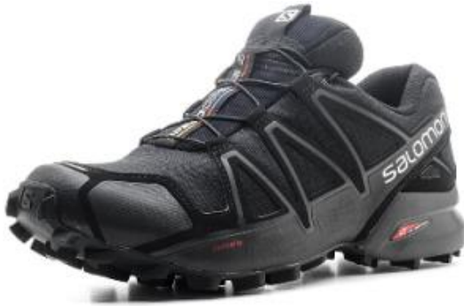
Фото 14. Кроссовок

установлено совпадение общих признаков с общими признаками подошвы кроссовок (фото 14, 15).