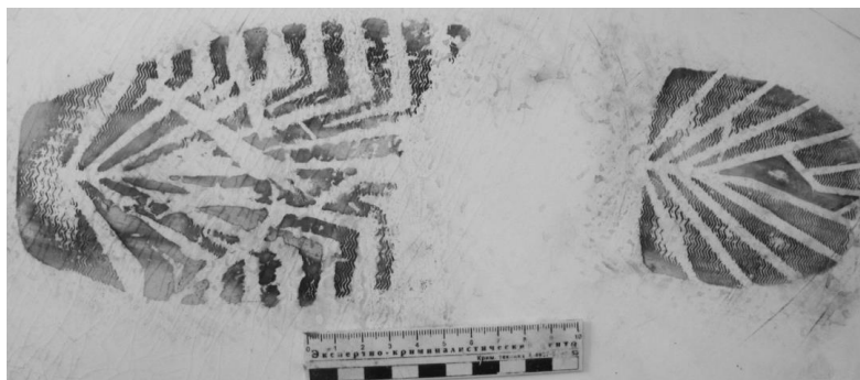
Фото 3. След обуви

ность обуви и признать его пригодным для идентификации обуви, его оставившей (след обуви оставлен подошвой ботинка на правую ногу и для идентификации обуви пригоден, фото 3).