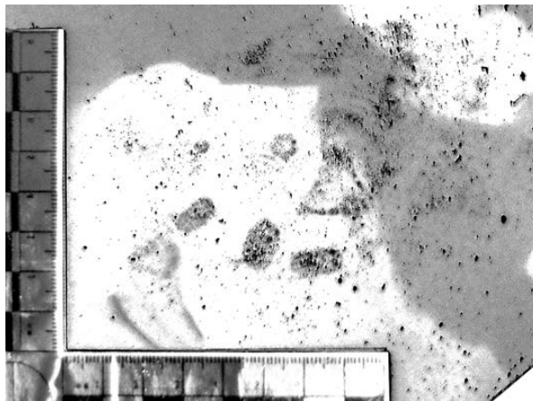
Фото 1. След обуви

фотоснимка (фото 1). Например, «фотоснимок 1 выполнен в контрастности, изображение нерезкое, имеются переэкспонированные участки в нижней левой части и в верхней правой части фотоснимка, по диагонали слева направо вниз участок фотоснимка недоэкспонированный, угол масштабной линейки соответствует 90 градусов, линейка расположена в пределах кадра».