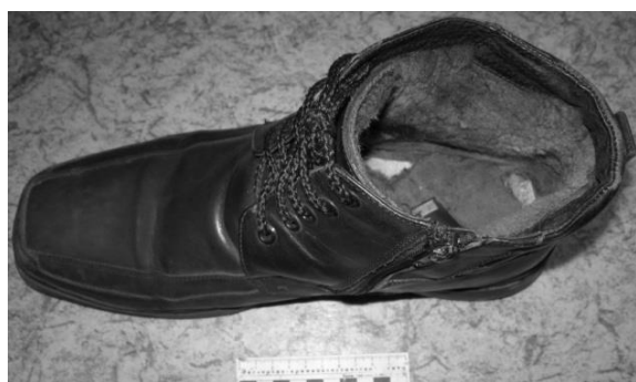
Фото 4. Мужской ботинок на правую ногу, изъятый у гр. А.

исследование с целью идентификации обуви (фото 4, 5, 6, 7).