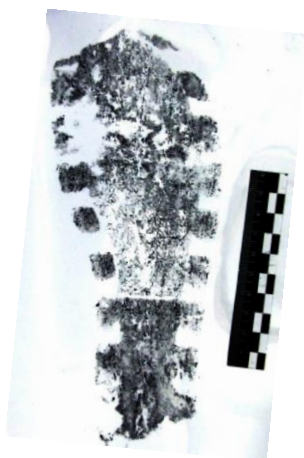
Фото 11. След обуви

Только после признания следа обуви пригодным для идентификации обуви эксперт переходит к срав-