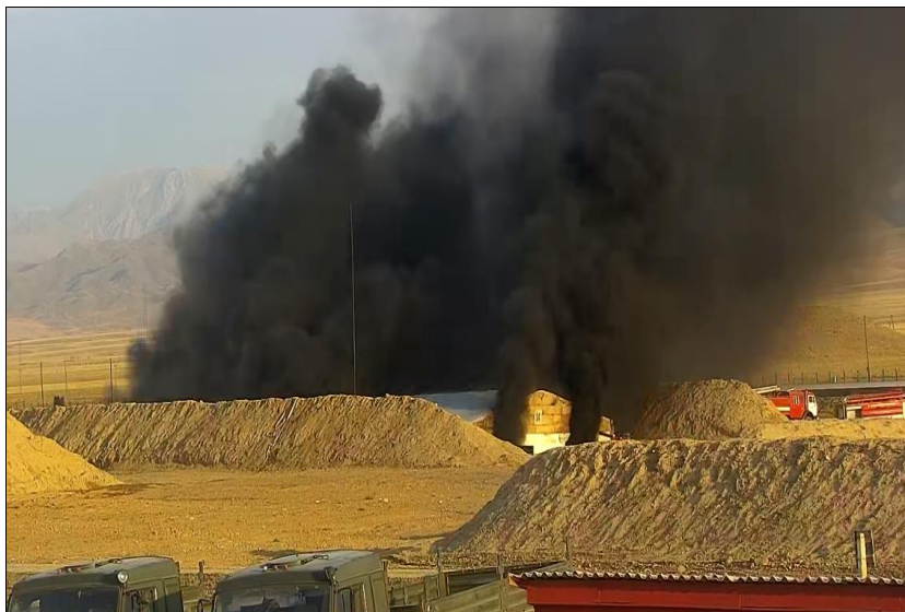
Фото 5. Выход густого черного дыма из левых и правых ворот западной стороны и с восточной стороны хранилища