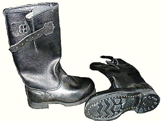
Фото 18. Сапоги.