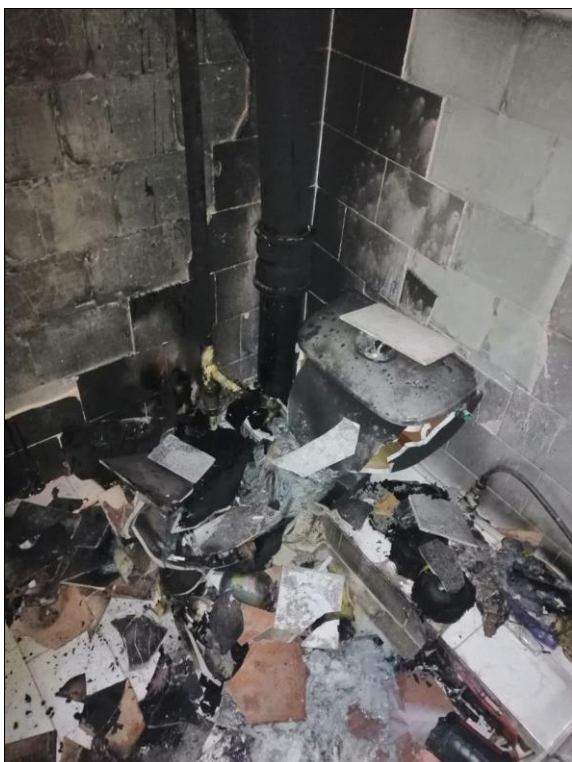
Фото 1. Разрушение унитаза и обрушение плитки

ной комнаты (фото 1) и уменьшались по мере удаления от нее. Кроме того, на внутренней стороне двери ванной комнаты было обнаружено характерное выгорание декоративной отделки, конусовидной формы, с вершиной конуса, обращенной вниз (фото 2).