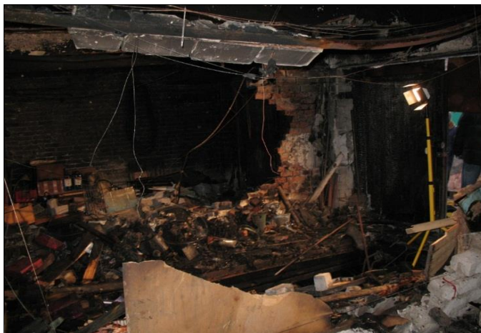
Фото 4. Внутренние повреждения гаражного бокса

В результате проведения экспертизы установлено следующее: