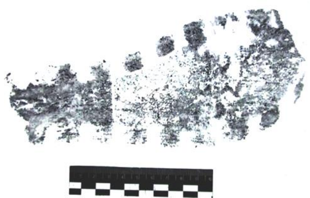
Фото 8. След обуви

и мог быть оставлен подошвой сандалии, сланца, кроссовка на правую ногу. Решить вопрос о пригодности следа обуви для идентификации возможно после сравнительного исследования при наличии сравнительных образцов, фото 8).