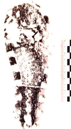
Фото 12. Экспериментальный оттиск подошвы сандалии на правую ногу, изъятый у гр. П.

нительному исследованию с целью установления тождества (фото 11, 12).