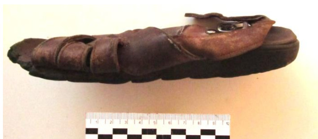
Фото 9. Сандалия на правую ногу, изъятая у гр. П.