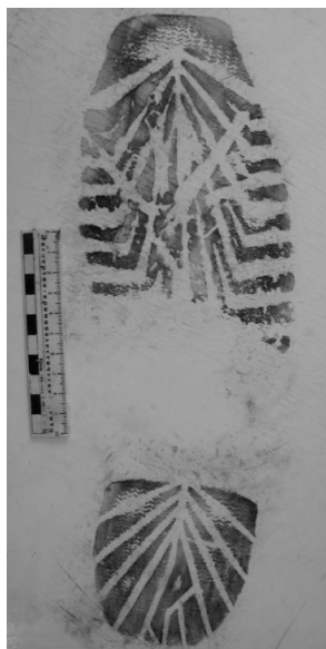
Фото 6. След обуви