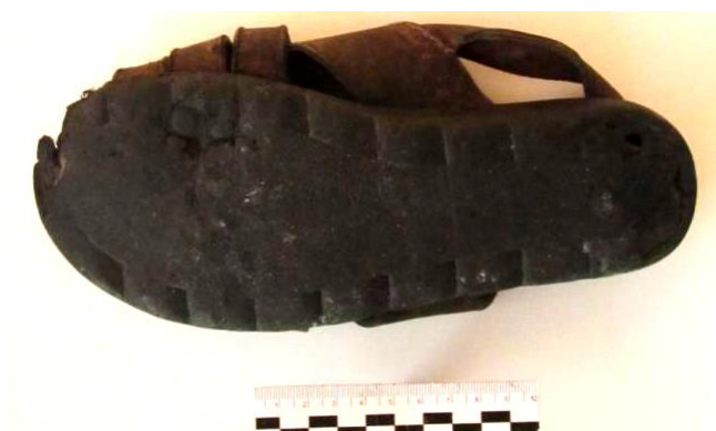
Фото 10. Подошва сандалии на правую ногу, изъятой у гр. П.

При отождествлении обуви необходимо помнить о том, что в первичной экспертизе вопрос о пригодности следа обуви для идентификации не решился (решить вопрос о пригодности следа обуви для идентификации возможно при наличии образцов для сравнительного исследования). Поэтому при проведении дополнительной экспертизы, в рассматриваемом случае, необходимо решить вопрос о пригодности следа для идентификации и только после этого переходить к идентификации. Например, «При сравнительном исследовании признаков в следе обуви, изъятом на дактилоскопическую пленку размером 110×220 мм, с признаками в экспериментальных следах подошвы сандалии на правую ногу установлено, что признаки, отобразившиеся в исследуемом следе обуви, являются общими и частными признаками по-