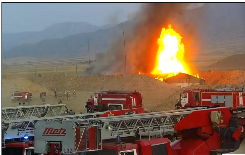
Фото 6. Вспышка с выбросом пламени, разрушение кровли с последующим активным горением юго-западной части хранилища

Хранилище, в котором произошел пожар, неотапливаемое, неэлектрифицированное, полузаглублённого типа, длиной 42 м шириной 17 м, из каменных блоков, железобетонных конструкций, с перекрытием из железобетона, центральным рядом колонн,