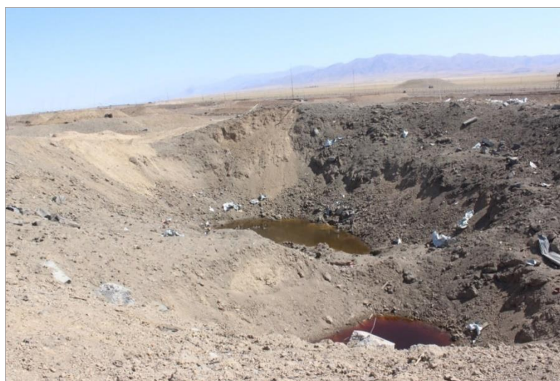
Фото 8. Общий вид двух воронок в месте расположения хранилища

Сложность производства экспертизы заключалась в том, что указанное место происшествия характеризуется большой площадью охвата, разрушениями, полным уничтожением хранилища и утратой следовой картины; требовалось изучение большого массива технической документации на хранившиеся изделия и исследование значительного объема объектов, изъятых в ходе осмотра места происшествия.