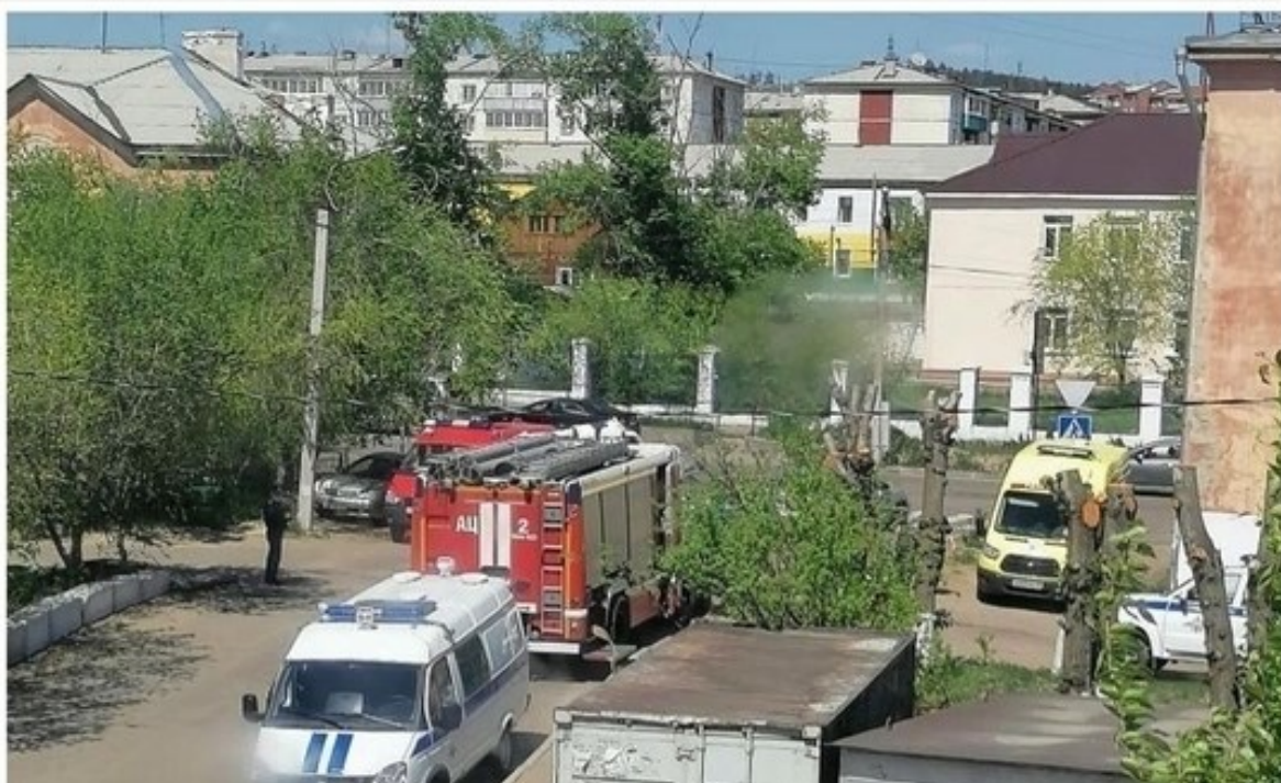
Рисунок 3. Место выявления взрывчатых веществ

При осуществлении профилактического обхода административного участка, в соответствии с приказом МВД России от 29.03.2019 № 205 5 участковый уполномоченный полиции может применять и другие формы несения службы, а именно — проведение индивидуальных профилактических бесед с гражданами и прием заявлений, сообщений граждан.