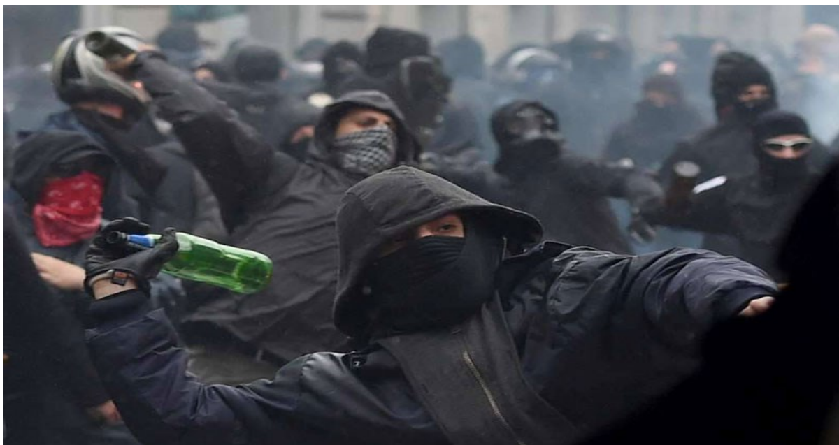
Рисунок 1. Организованная группа для реализации террористического акта

Любое экстремистское направление деятельности включает в себя нетерпимость к какой-либо группе лиц. При этом нетерпимость к группе лиц настолько велика, что люди объединяются в экстремистские организации того или иного толка для того, чтобы вести деятельность, связанную с пропагандой и насилием в поддержку конкретной экстремистской идеологии.