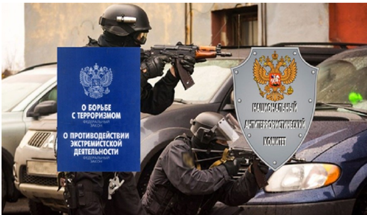
Рисунок 2. Взаимодействие участковый уполномоченный полиции осуществляет взаимодействие с различными правоохранительными органами, государственными организациями и гражданами

Основная нагрузка по выполнению данных обязанностей возлагается на подразделения участковых уполномоченных полиции. Участковые уполномоченные полиции, являясь многочисленным подразделением в сфере внутренних дел, наделяются значительными полномочиями. За каждым участковым закрепляется свой административный участок, на котором проживают различные категории граждан, где защита их жизни и здоровья является одной из приоритетных задач правоохранителей.