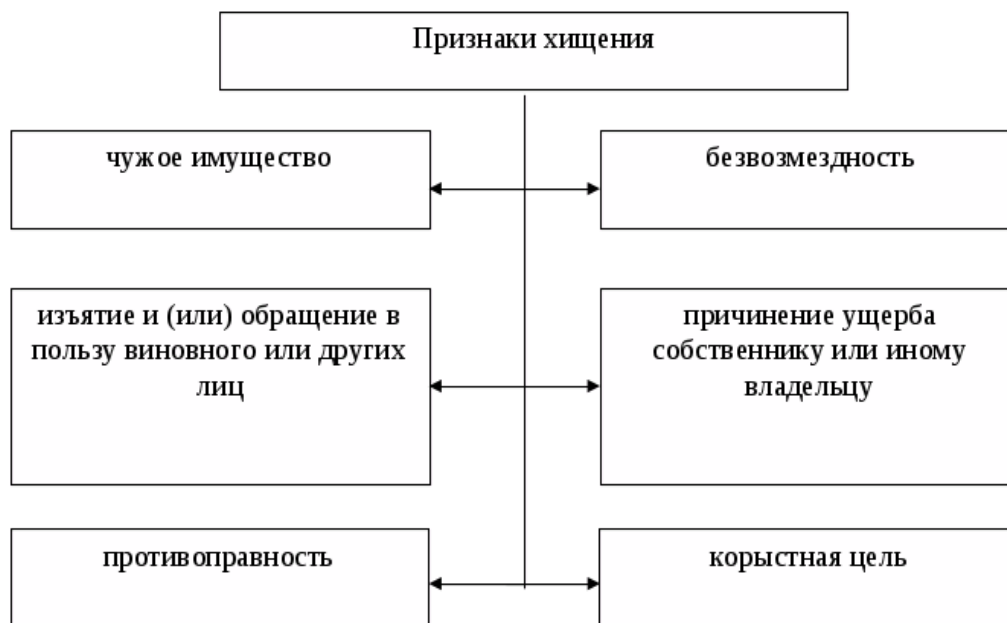
Рисунок 27.2 – Признаки хищения