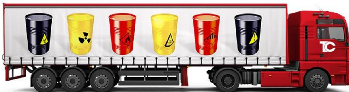
Рис. 5. Транспортное средство, перевозящее опасные грузы

Далее инспектор следует вышеуказанному алгоритму действий сотрудников ДПС при выезде на место ДТП.