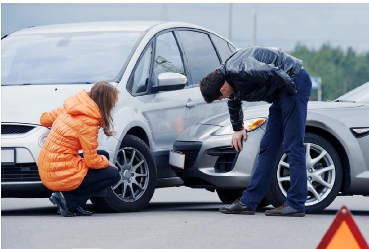
Рис. 1. Боковое столкновение (дорожно-транспортное происшествие, в котором произошло только механическое повреждение транспортных средств)

1. Происшествия, в которых произошло только механическое повреждение транспортных средств (рис. 1).