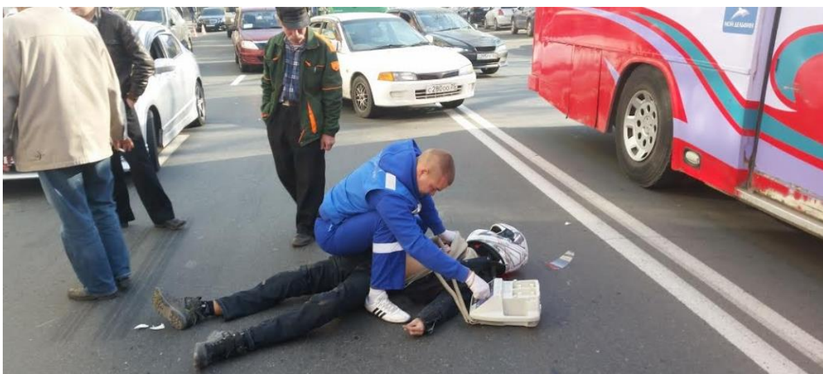
Рис. 2. Дорожно-транспортное происшествие, в котором есть пострадавший

При непосредственном получении сообщения о ДТП сотрудник обязан внимательно выслушать заявителя и зафиксировать: