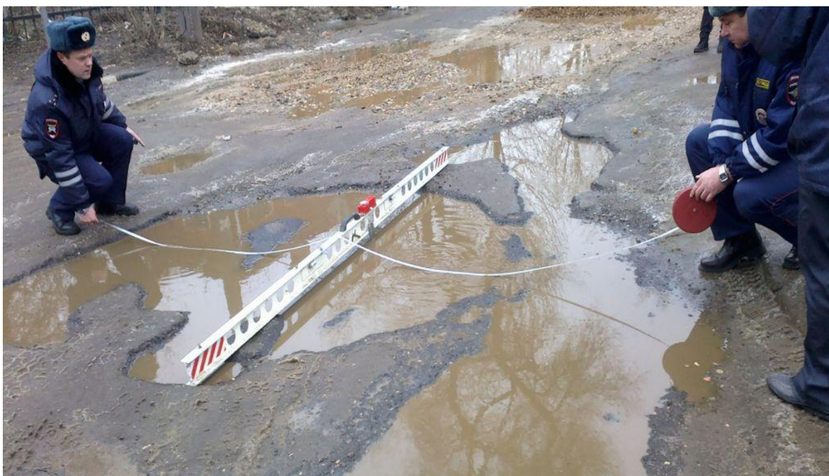
Рис. 3. Измерение ям на дороге (необходимые данные для внесения в протокол осмотра и акт недостатков улично-дорожной сети)

12) составляет протокол осмотра места совершения административного правонарушения и схему ДТП (см. пример на рис. 4).