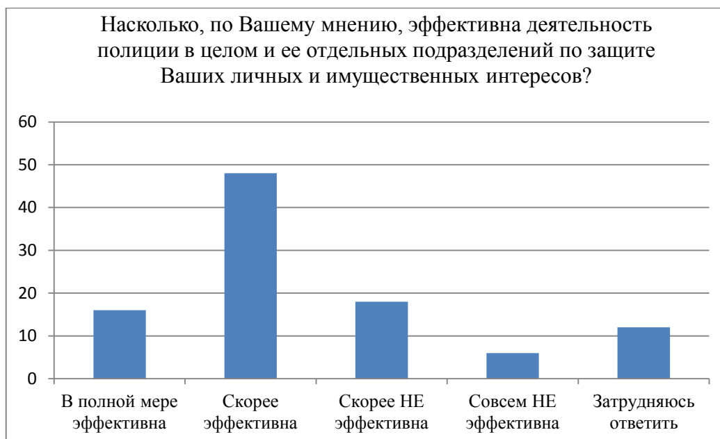
График № 2. Данные социологического опроса за 2018 год, проведенного в Приволжском федеральном округе

Таким образом, при создавшейся ситуации и с учетом статистических данных возникает необходимость максимально возможного освобождения оперативного состава с тем, чтобы сосредоточить усилия сотрудников оперативных подразделений полиции на инициативной оперативно-розыскной деятельности, особенно на преодолении криминального противодействия правоохранительной и правоприменительной деятельности.