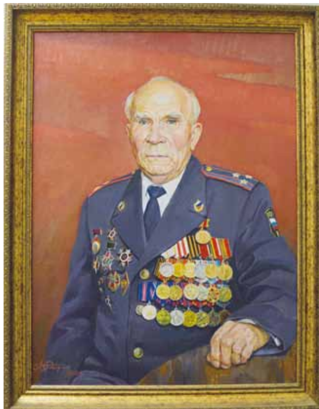
Тот самый портрет