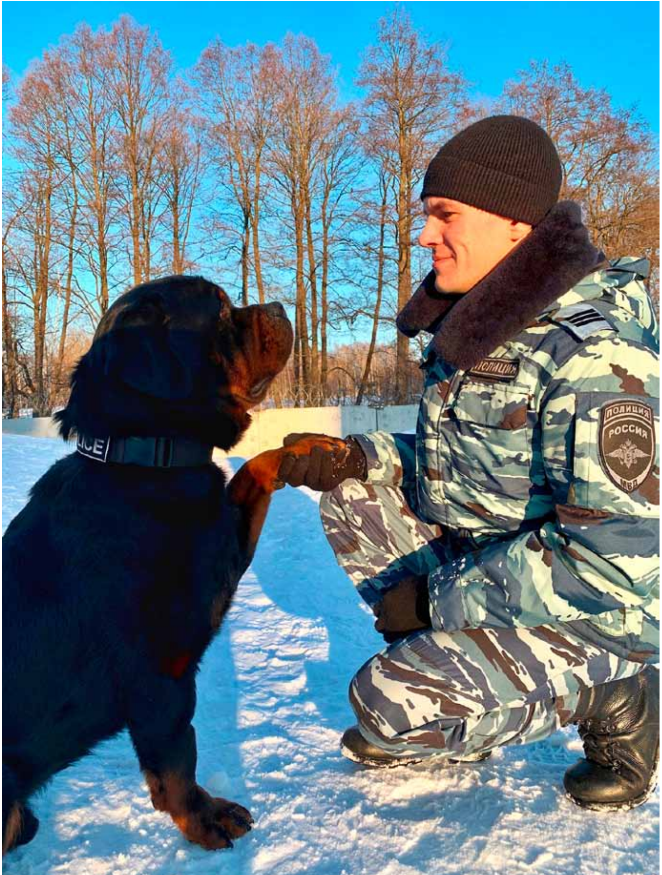
Фотография победителя фотоконкурса «Профессия кинолог» среди слушателей ФГКУ ДПО «РШ СРС МВД России» первого потока 2020 г.