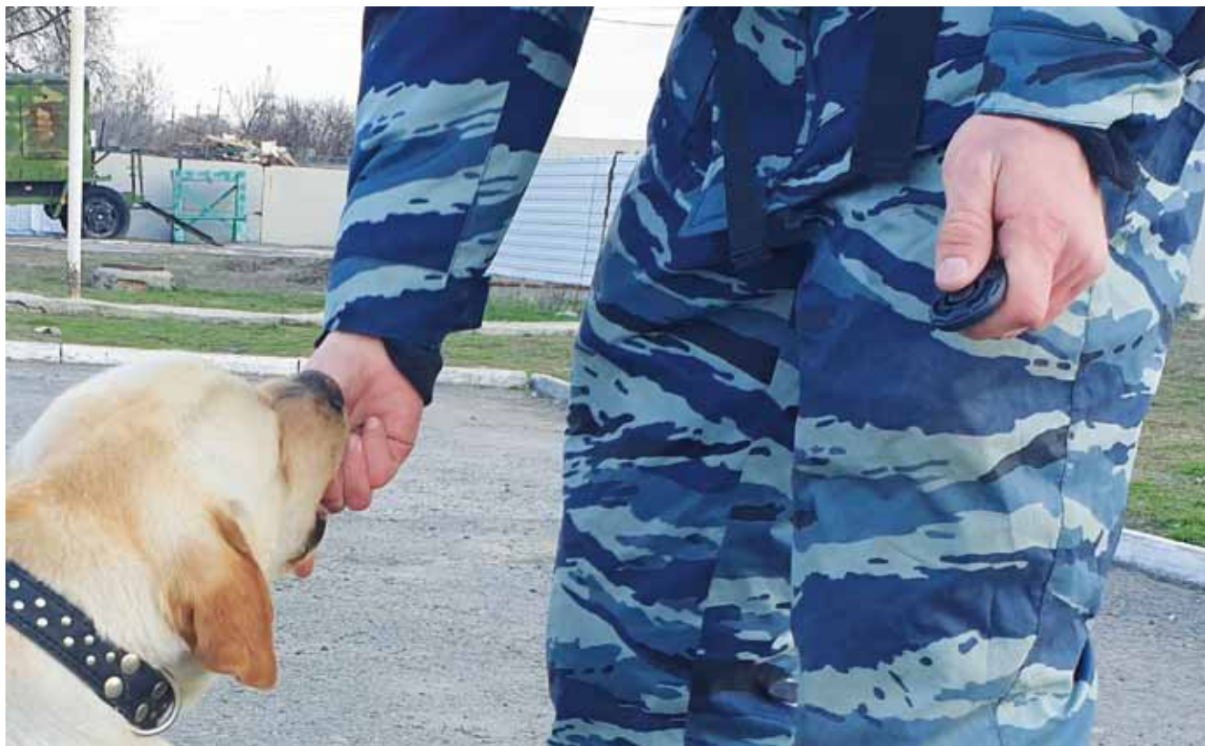
Формирование условного положительного подкрепления

кинологу остается подлавливать необходимое поведение служебной собаки и подкреплять его вплоть до закрепления поведенческого акта. Например, специалист-кинолог ожидает самостоятельной посадки служебной собаки и подкрепляет это действие. В отличие от выработки навыка на основе классических условных рефлексов, в начале оперантной дрессировки даже не подается команда «Сидеть!». Когда служебная собака начинает заинтересованно садиться в ожидании подкрепления, можно вводить, собственно, саму команду «Сидеть!» и подкреплять посадку, только если служебная собака села после команды.