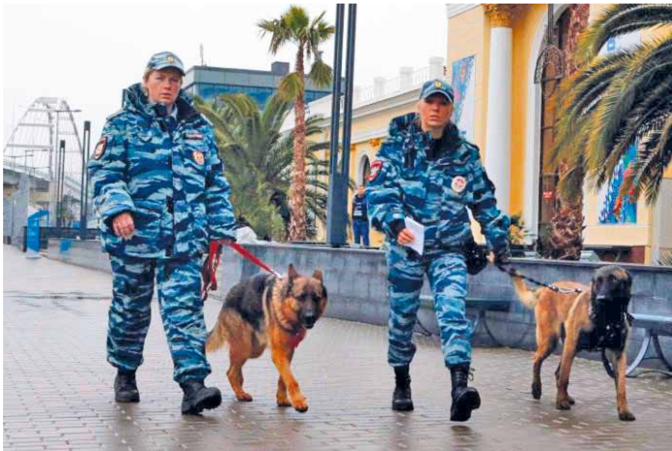
Сотрудники ППС со служебными собаками при патрулировании

Специалист-кинолог может не предупреждать о намерении применить служебную собаку, если промедление в применении создает непосредственную опасность жизни и здоровью гражданина или сотрудника полиции или может повлечь иные тяжкие последствия.