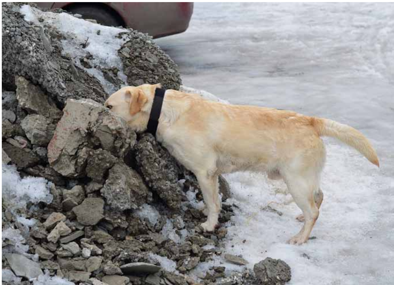
Работа собаки – обнаружила