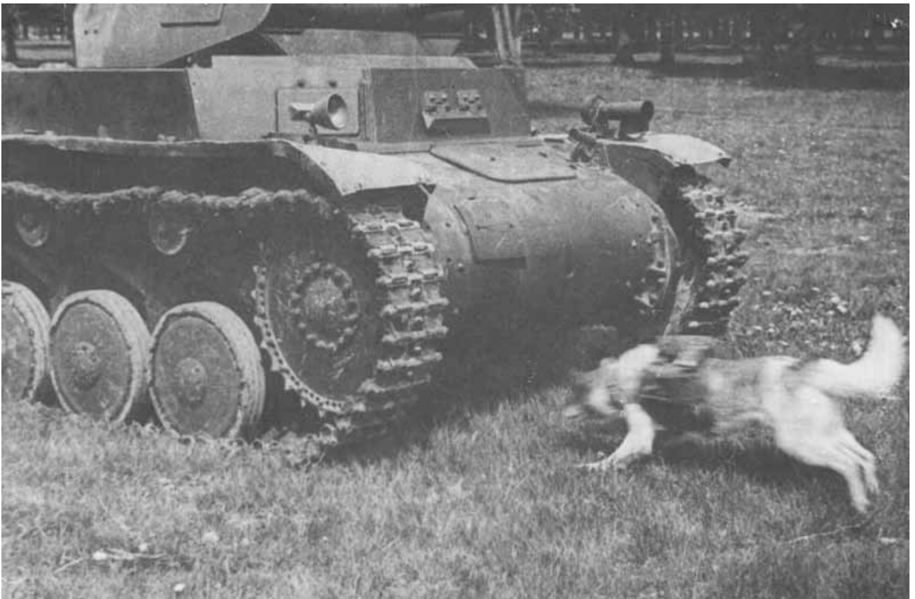
Работа собак – истребителей танков

Хорошо, что мы живем в мирное время. Однако необходимо помнить тех, кто обеспечил наше счастливое настоящее, и быть достойными их памяти, развивая кинологическую службу, совершенствуя подготовку служебных собак, добиваясь безотказности в их работе.