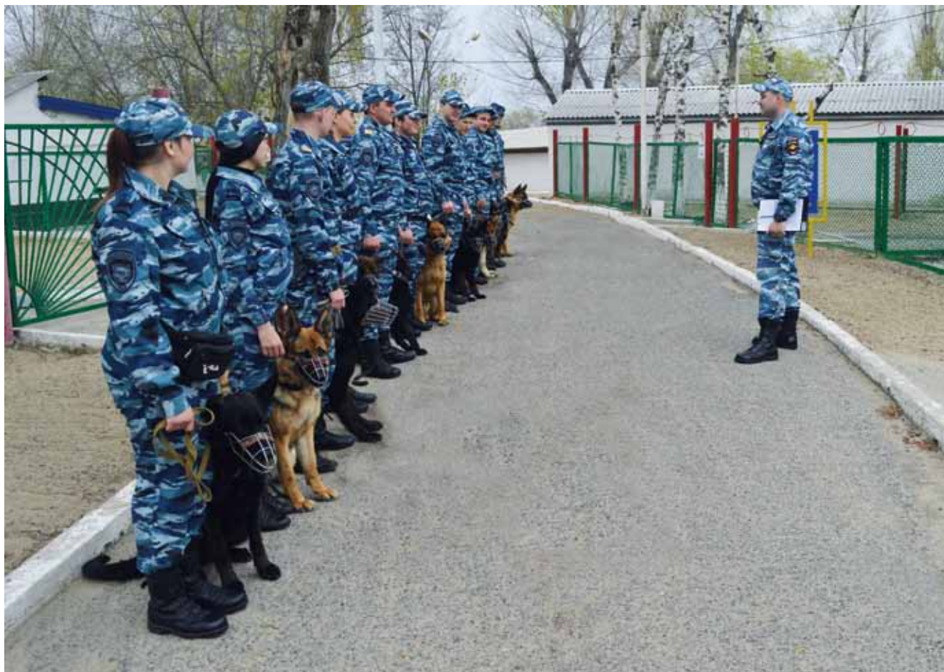
Организационная часть практического занятия

семинары являются основной методологической структурой изучения материала служебной кинологии, ветеринарии, порядка действий специалиста-кинолога на месте происшествия и т.д. Теоретические занятия проводятся по известным образовательным методикам с применением современных технических средств обучения.