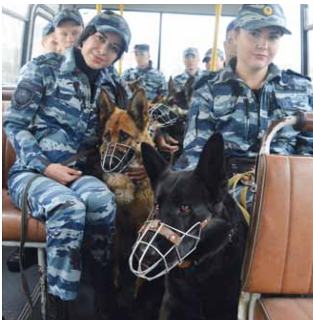
Выезд на практическое занятие

Практические занятия со специалистами-кинологами по дрессировке служебных собак проводятся в разное время суток как на территории подразделения или вблизи него, так и с выходом (выездом) за пределы образовательной организации (отдалённые полигоны, объекты инфраструктуры города и т.п.). Продолжительность занятий увеличивается постепенно, начиная с двухчасовых и заканчивая шести-восьмичасовыми практическими занятиями.