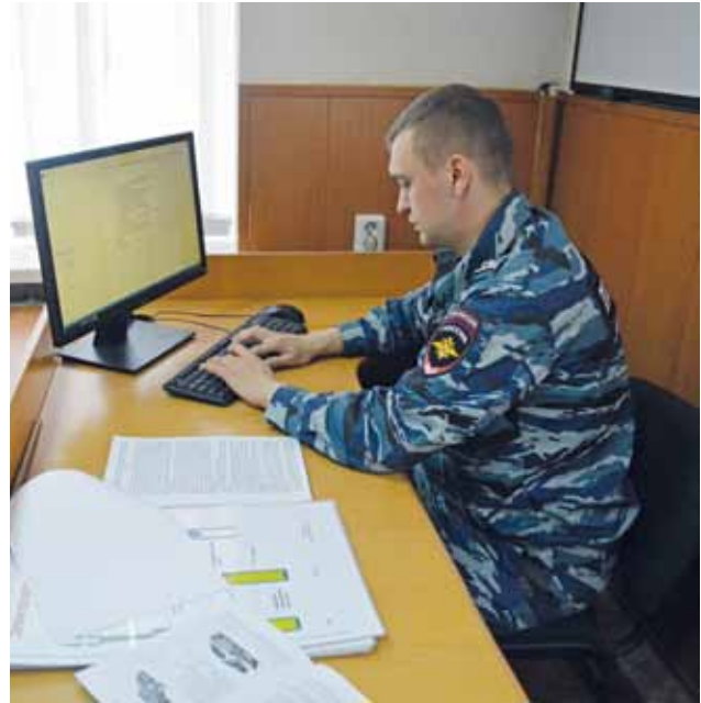
Методическая подготовка к проведению практического занятия

По мере необходимости преподаватель проводит показ отдельных видов усложнения приёмов. Каждое очередное практическое занятие рекомендуется про-