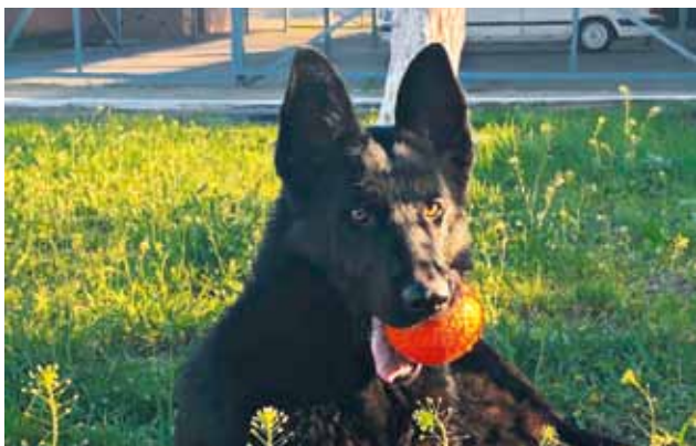
Служебная собака Рина

дают положительные эмоции и позитивный заряд. Использование возможностей животных обусловлено их специфическими биологическими качествами, превосходящими возможности человека: более острое обоняние, слух, зрение, высокие скорость реакции, выносливость.