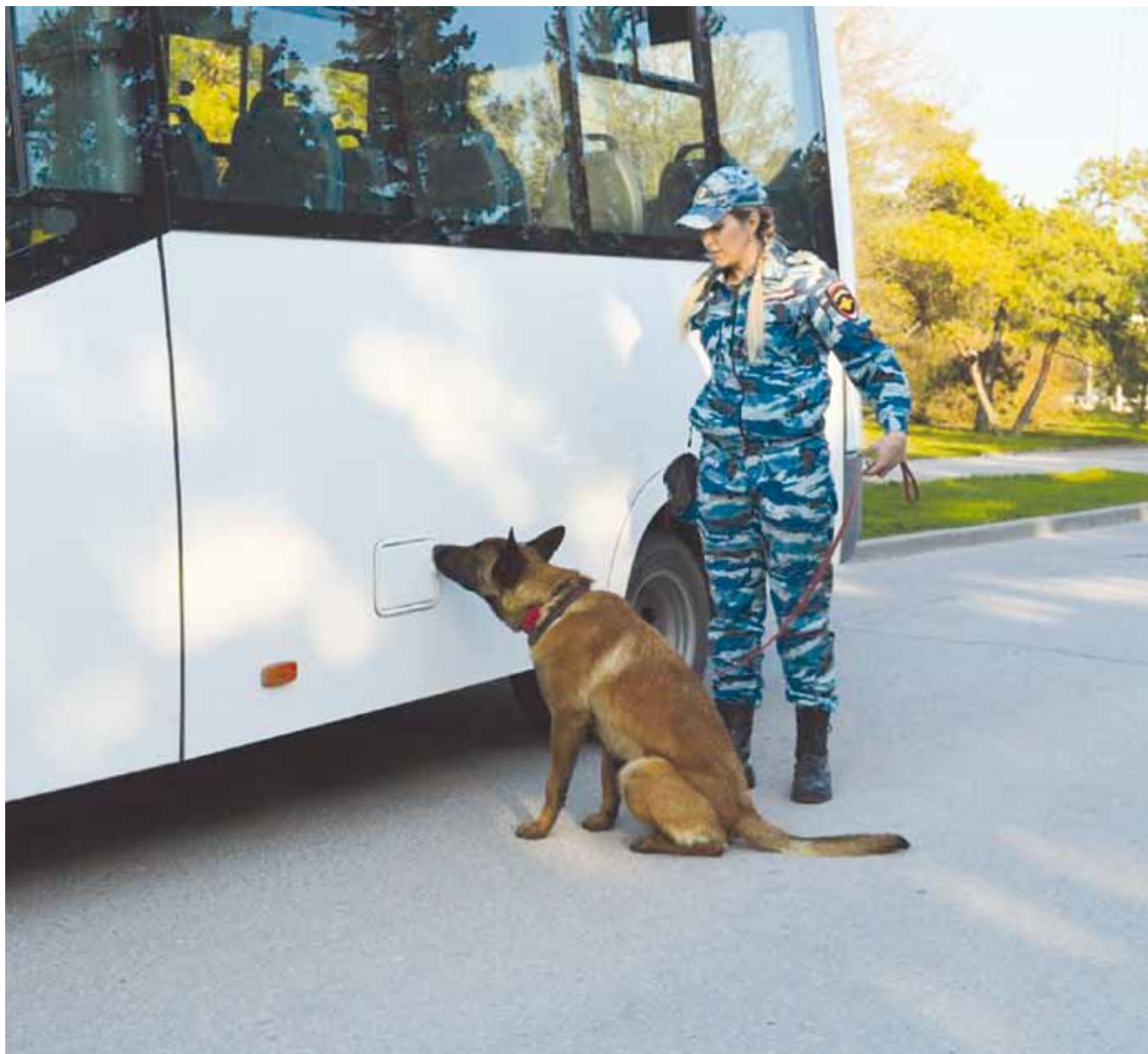
На занятиях по специальному курсу дрессировки каждое обозначение служебной собакой искомого запаха должно подкрепляться

поведение. Но не стоит забывать, что для многих специалистов-кинологов и служебных собак предпочтительным, в том числе и из-за коротких сроков обучения, остается научение в форме классических условных рефлексов. Каждый специалист-кинолог должен, учитывая индивидуальные особенности служебной собаки, сроки обучения, поставленные задачи и т.д., решить, какая форма научения подойдет в конкретном случае. При этом возможны сочетания разных форм, методов и способов дрессировки служебных собак. Но что бы ни выбрал специалист-кинолог, окон-