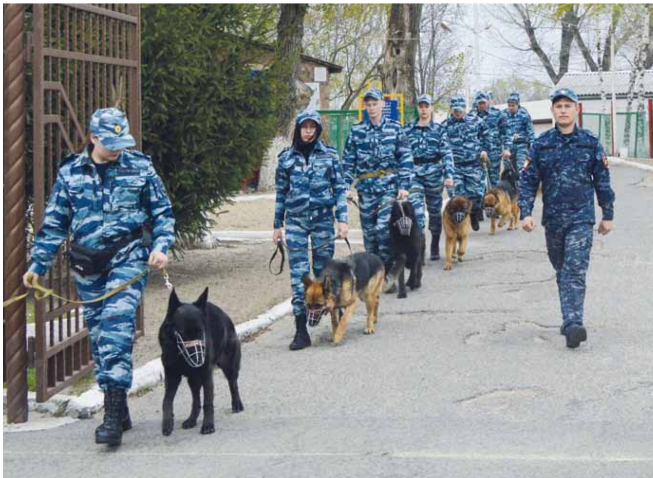
Преподаватель должен изучить индивидуальные особенности специалистов-кинологов и служебных собак

ского занятия, который является обязательным документом на занятии. Кроме того, преподаватель может составить для себя подробную методическую разработку к данному занятию, которая не является обязательным документом, но имеет очень большое значение, особенно для преподавателя с небольшим опытом работы.