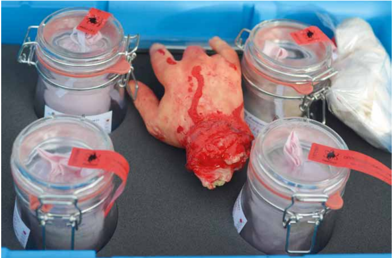
Учебные реквизиты для подготовки собак по поиску человеческих останков

зор... Конечно же, я утрирую, но с таким нежеланием подавать голос, как у этого кобеля, я не сталкивался давно. Классическая схема: собака – голодная (минус два кормления), в закрывающемся контейнере – вкусная еда. Человек показывает собаке, что в контейнере, отбегает на небольшое расстояние, прикрывает контейнер. Проводник отпускает собаку, все ждут залихватистый лай. Бой в этой ситуации говорит – нет. На следующий день то же самое. Сейчас он вроде бы немного похудел, но на первых занятиях, глядя на его живот, я понимал, что без еды он вполне может перезимовать и подавать голос ему без надобности еще месяца два. Из огромного количества способов заставить собаку полаять есть еще один достаточно быстрый – удаление хозяина на расстояние. Это можно делать в незнакомой местности, можно в вольере. Отошли, собака забеспокоилась, подала голос, мы ее тут же подкрепили. Но способ хорош,