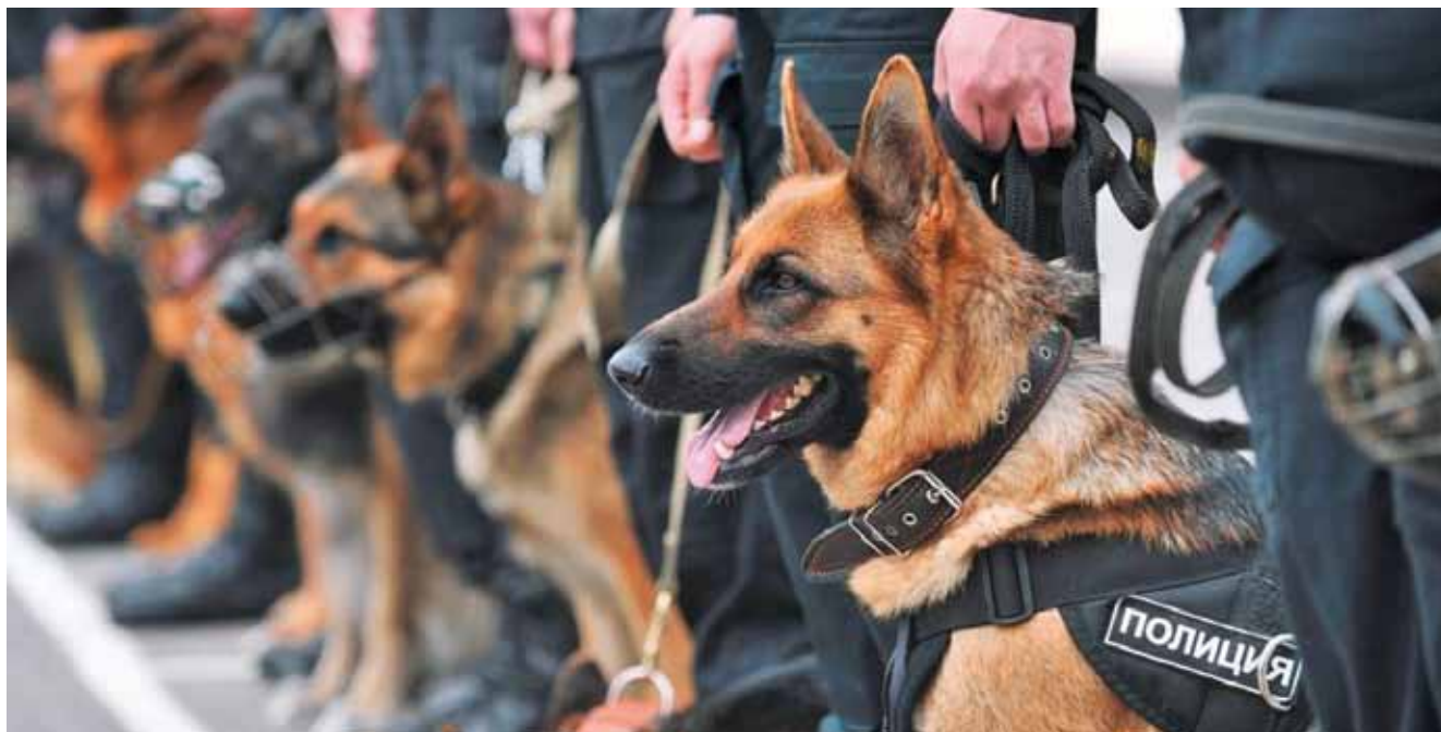
Специальное средство полиции – служебная собака

9. Для защиты охраняемых объектов, блокирования движения групп граждан, совершающих противоправные действия.