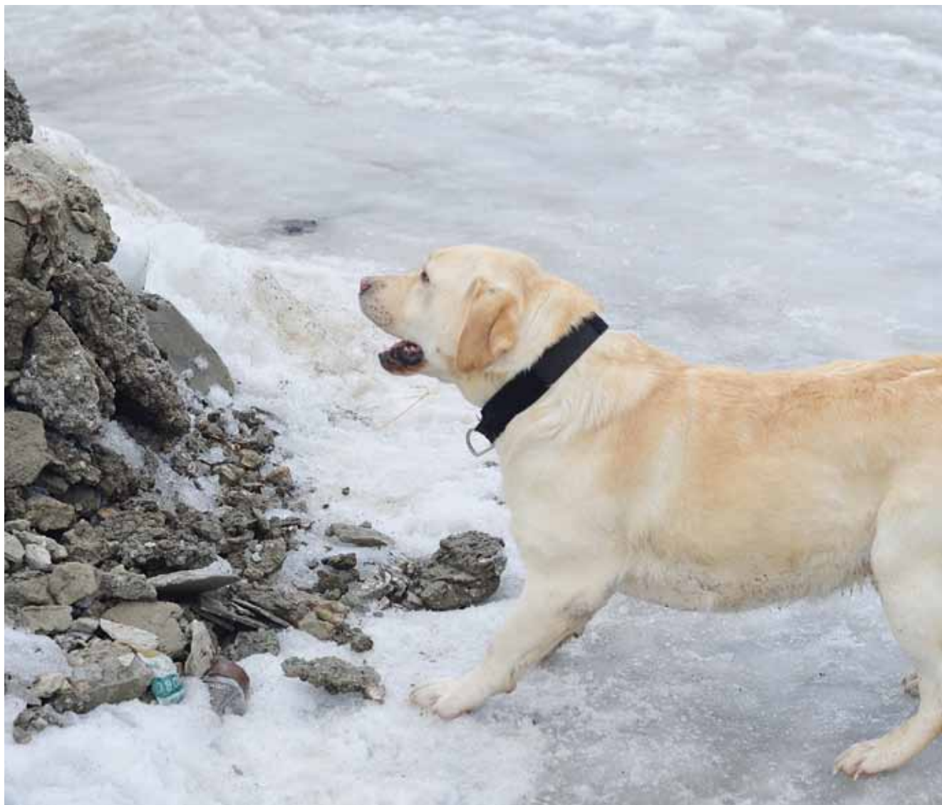
Работа собаки – обозначила

Подведем итог. Первым этапом является выработка сигнального обозначения, в качестве которого мы выбрали лай. Второй этап – введение запаха, это мы производим одновременно с несложной маскировкой контейнера. Третий этап – работа на плоскости с постепенным увеличением обыскиваемого участка, введением раздражителей, открытых закладок, параллельно осуществляем проводки. Есть еще четвертый, не менее важный, этап, о котором я не могу не упомянуть, – это решение тактических задач непосредственно при работе на месте происшествия. Конечно, существуют базовые рекомендации, но каждый случай индивидуален