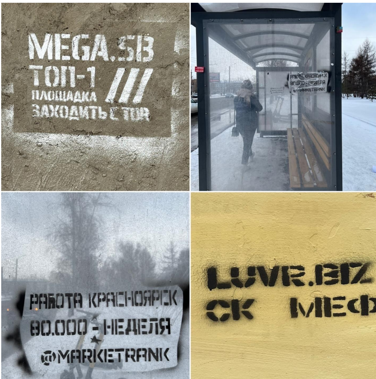
Рисунок 3. Реклама наркомаркетплейсов, торгующих наркотиками.