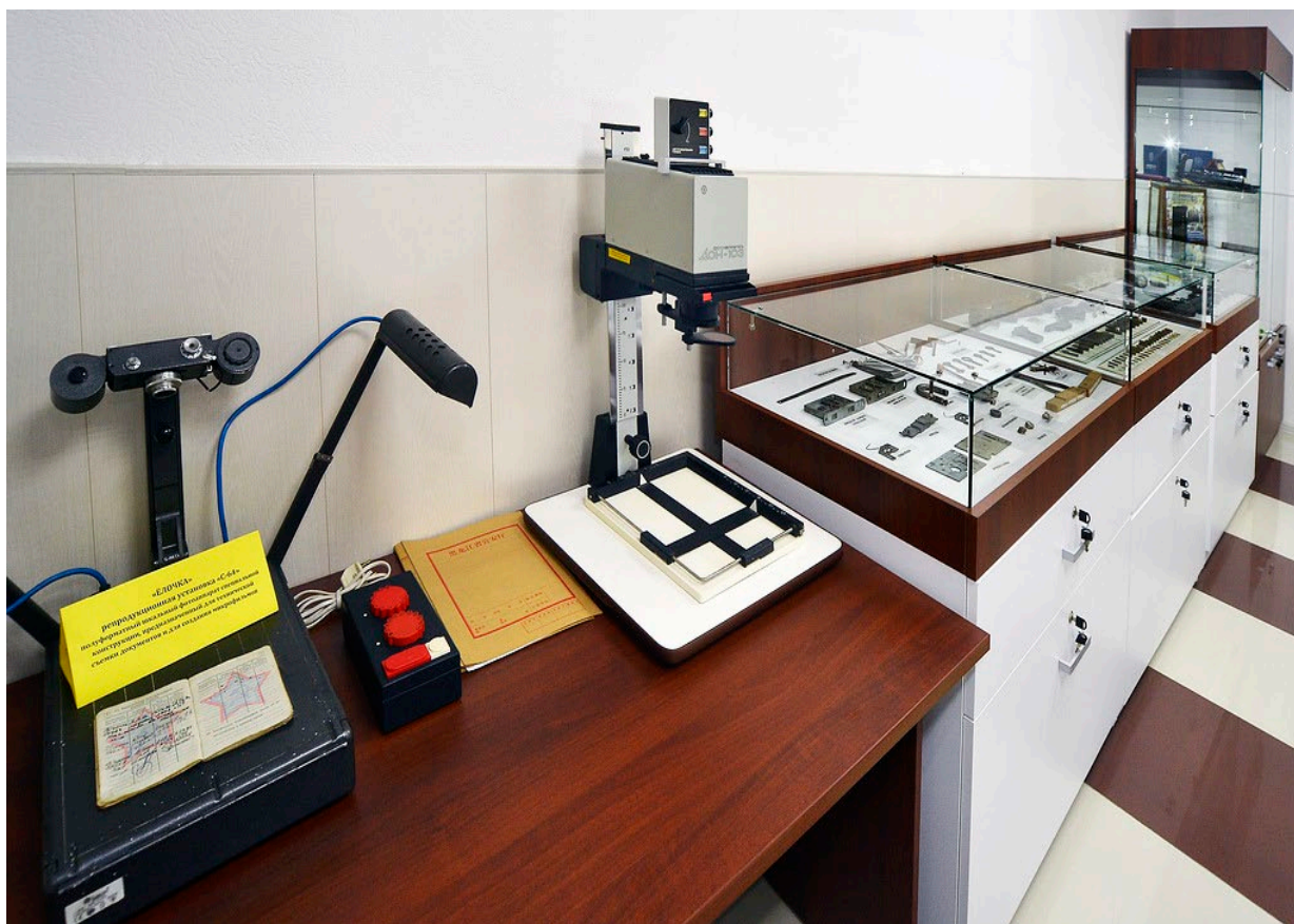
Ил. 1. Экспозиция музея криминалистики

Основная задача использования криминалистического полигона – повышение эффективности практического обучения, обеспечение условий для проведения учебных занятий по дисциплинам «Криминалистика», «Уголовный процесс», «Первая помощь», «Уголовное право». Использование экспозиции музея криминалистики (иллюстрации 1–2) может способствовать достижению воспитательных целей образовательного процесса, более глубокому изучению истории органов внутренних дел в целом и экспертно-криминалистических подразделений в частности.