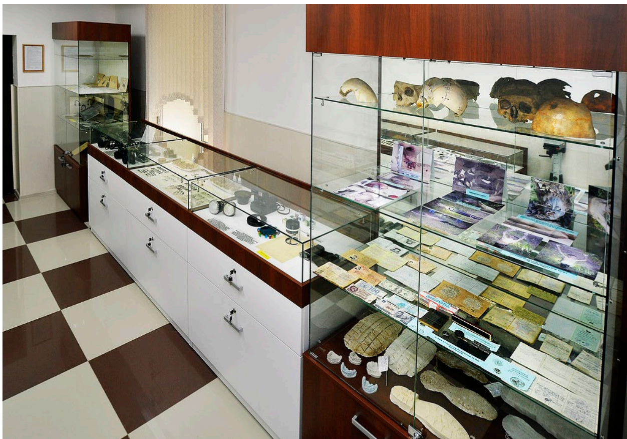
Ил. 2. Экспозиция музея криминалистики

Проведение учебных занятий на базе криминалистического полигона предусматривается рабочими программами учебных дисциплин. На полигонах формируются и отрабатываются практические навыки установления личности по следам пальцев рук и признакам внешности, установления исполнителя рукописного текста по признакам почерка, выявления фактов полной и частичной подделки документов и распознавания фальшивых денежных знаков, классификации огнестрельного и холодного оружия, использования данных различных видов криминалистических учетов и пр.