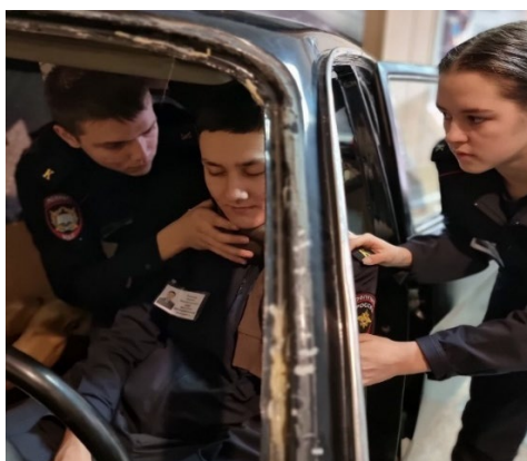
Ил. 14. Первичный осмотр пострадавшего в автомобиле, фиксация шеи подручными средствами