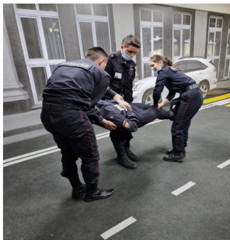
Ил. 15. Переноска пострадавшего

Заключительная часть включает в себя подведение итогов занятия, закрепление темы и определение заданий для самостоятельной работы. При подведении итогов и закреплении темы преподавателю необходимо обратить внимание на типичные ошибки, допускаемые при оказании первой помощи пострадавшим, указать способы их исправления (либо недопущения).