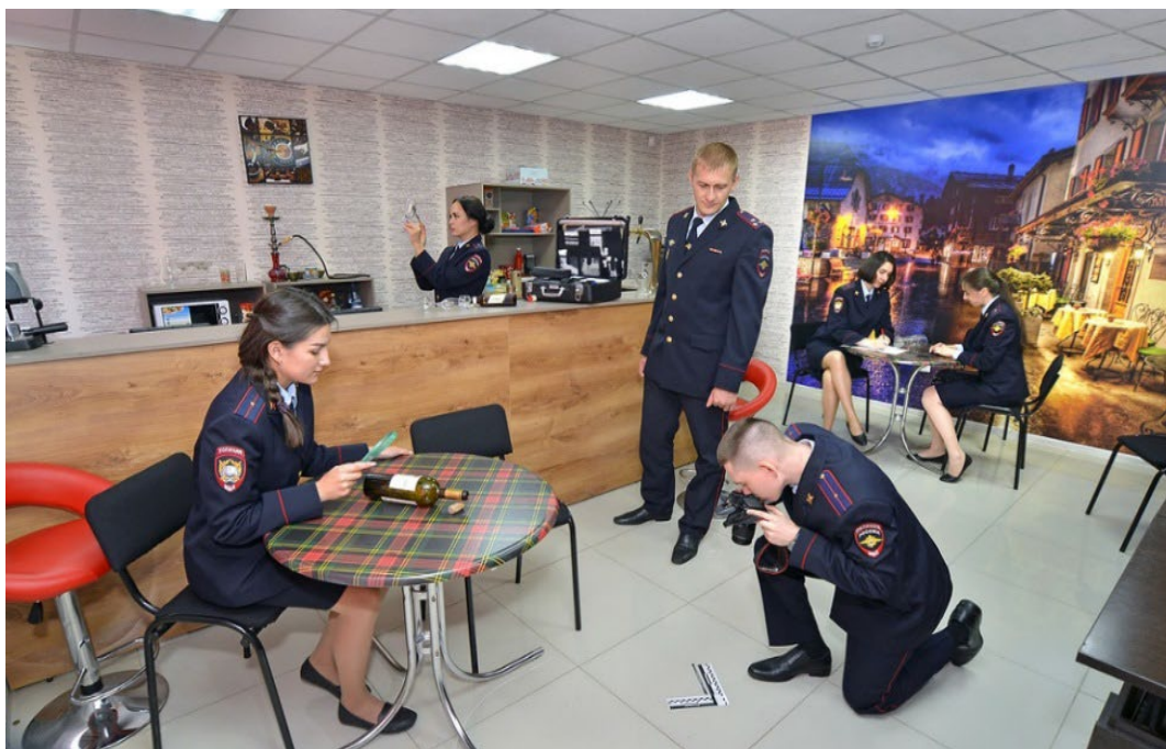
Ил. 9. Поиск и фиксация следов членами следственно-оперативной группы в рамках практических занятий на полигоне «Кафе»

подгруппа, то она следит за проведением занятия в аудитории через систему видеонаблюдения и также фиксирует допускаемые ошибки.