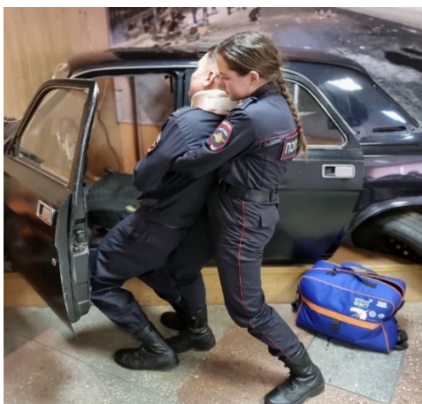
Ил. 13. Извлечение пострадавшего из автомобиля