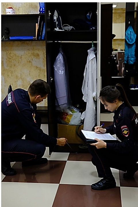
Ил. 4. Осмотр элементов вещной обстановки полигона «Квартира» в рамках практических занятий