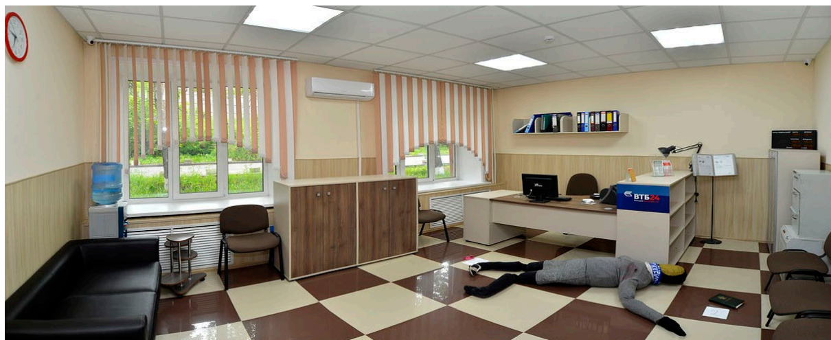
Ил. 6. Обстановка криминалистического полигона «Офис»

Криминалистический полигон «Офис» представляет собой помещение, в котором воссоздана обстановка служебного кабинета (офиса): имеется рабочее место сотрудника, необходимая мебель (шкафы, сейфы и т. д.), оргтехника и др. Обстановка помещения позволяет смоделировать офис руководителя, офис туроператора, офис микрофинансовой организации и др., в зависимости от моделируемой преподавателем ситуации (иллюстрация 6). В шкафах имеются некоторые виды финансовых бухгалтерских документов, позволяющих при моделировании следственной ситуации в условиях обыска в офисе коммерческой организации сформировать у обучающихся навык обращения с изымаемыми документами экономического характера.