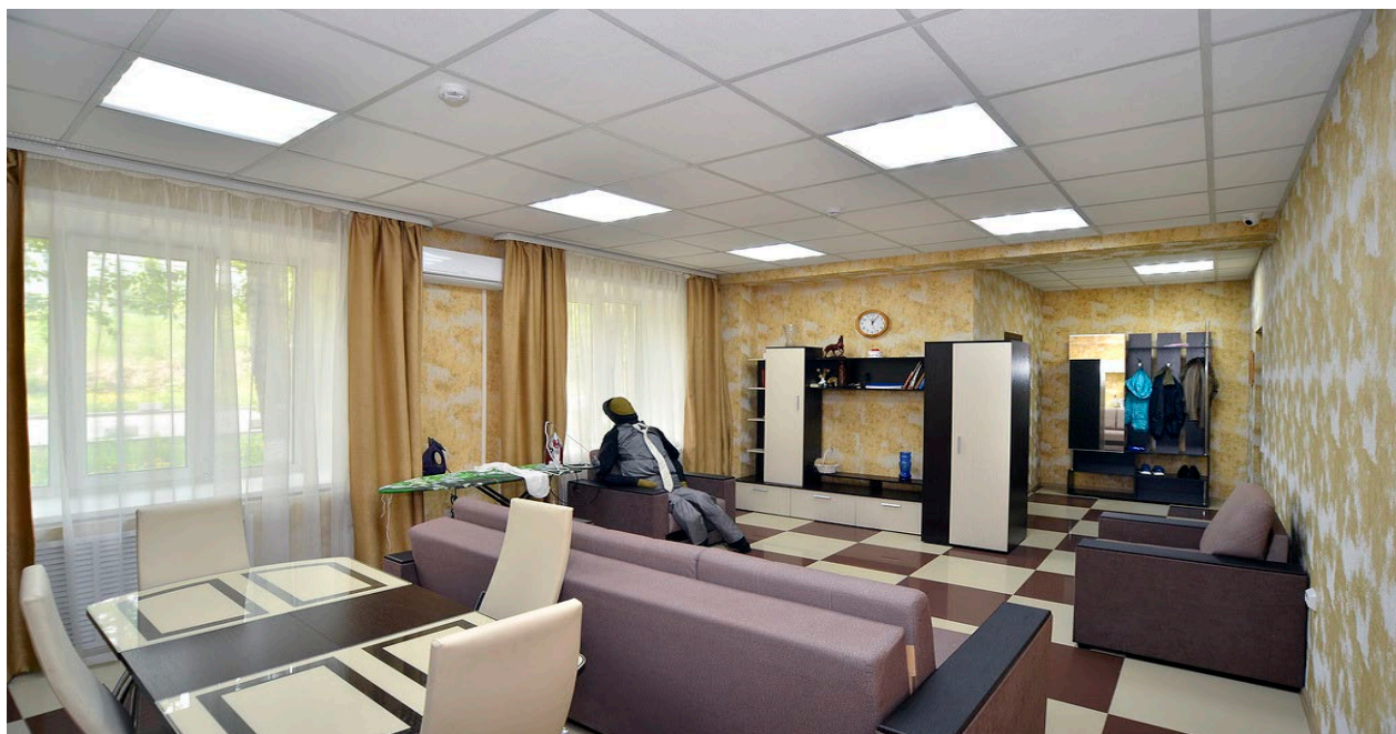
Ил. 3. Обстановка криминалистического полигона «Квартира»

Криминалистический полигон «Квартира» (далее – «Квартира») представляет собой современно оформленную квартиру-студию, состоящую из прихожей, гостиной, кухонной зоны и санитарного узла (иллюстрация 3). «Квартира» оборудована необходимой мебелью: кухонные и плательные шкафы, диваны, кресла, предметы интерьера и т. п., что помогает создать обстановку, максимально приближенную к реальной. Данное учебное помещение в полной мере позволяет смоделировать обстановку проведения обыска, осмотра места происшествия, изъятия образцов для сравнительного исследования, проверки показаний на месте, а в некоторых случаях следственного эксперимента – даже допроса по месту жительства допрашиваемого.