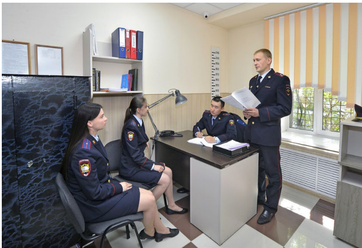
Ил. 17. Отработка обучающимися тактики допроса на криминалистическом полигоне «Кабинет следователя»

Криминалистический полигон «Кабинет следователя» представляет собой помещение, снабженное перегородкой со стеклом с односторонней светопропускающей способностью, что позволяет проводить предъявление для опознания живых лиц в условиях, исключающих визуальное восприятие опознающего лица опознаваемым. Кроме того, имитация обстановки рабочего кабинета следователя позволяет отрабатывать с обучающимися тактические приемы проведения допроса и очной ставки (иллюстрация 17).