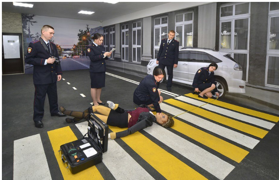
Ил. 16. Осмотр трупа на месте его обнаружения в условиях криминалистического полигона «Улица»

акцентировано на процессуально значимой информации, содержащейся во вводной (сведениях, характеризующих личность подозреваемых, временных факторах проведения различных действий участников учений и др.).