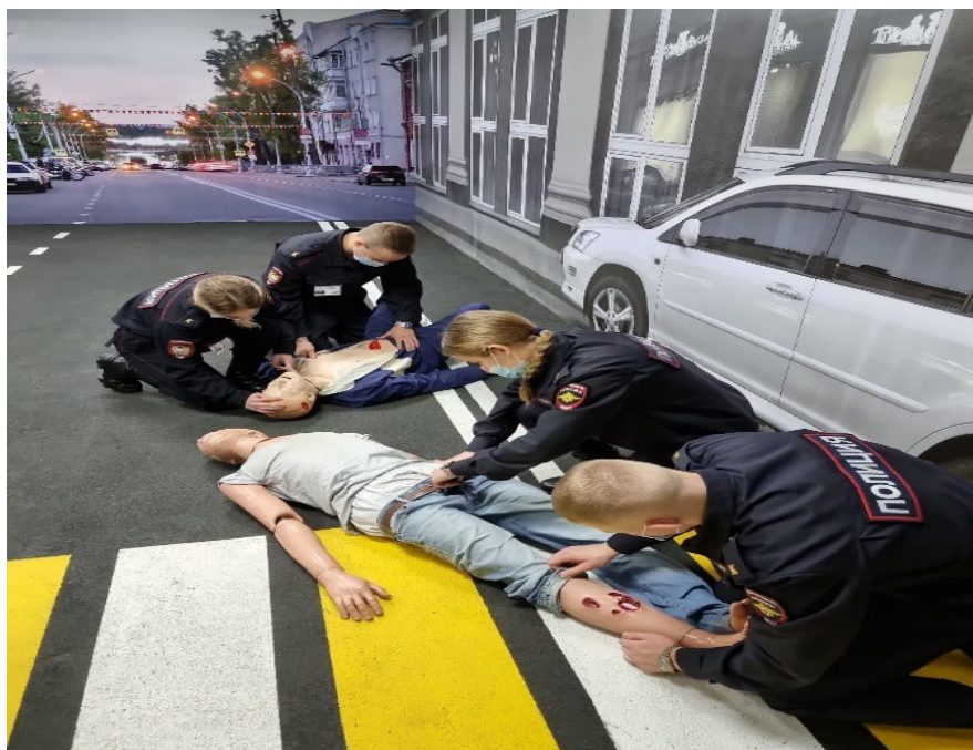
Ил. 11. Первичный осмотр пострадавшего

Учебная группа делится на несколько подгрупп по 2 человека. Обучающиеся выполняют осмотр пострадавшего.