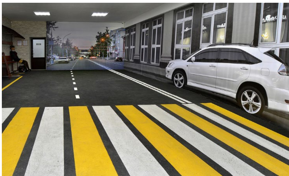
Ил. 10. Обстановка криминалистического полигона «Улица»

Учебно-тренировочная площадка криминалистического полигона «Улица» представляет собой помещение, в котором воссоздана обстановка проезжей части с расположенными на ней автомобилем или его частью, остановкой общественного транспорта, используемыми для решения практико-ориентированных задач образовательного процесса, позволяющими инсценировать дорожно-транспортное происшествие, в том числе для отработки практических навыков по оказанию первой помощи пострадавшим (иллюстрация 10).