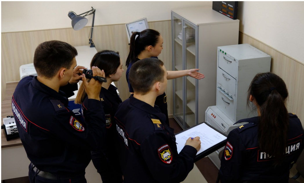
Ил. 7. Работа обучающихся при отработке тактики проверки показаний на месте в условиях полигона «Офис»

Для решения частной задачи по отработке определенных тактических приемов проверки показаний на месте необходимо составлять фабулу с учетом условий реализации данных приемов. Впоследствии одновременно с анализом последовательности действий участников следственно-оперативной группы преподаватели должны акцентировать внимание на соблюдении обучающимися рекомендаций криминалистической тактики производства проверки показаний на месте. Например, если действия обучающихся направлены на предоставление «тактической» самостоятельности лицу, чьи показания проверяются, то обязательно должна быть сохранена руководящая и организующая роль следователя: проверяемое лицо самостоятельно указывает маршрут движения, рассказывает о характере пути следования, его особенностях, объектах, которые на нем находятся.