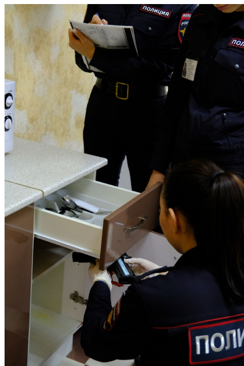
Ил. 5. Поиск и обнаружение следов и вещественных доказательств на полигоне «Квартира» в рамках практических занятий

Перед началом выполнения практической части занятия (работы с фабулой) возможно в форме коротких вопросов к аудитории повторить теоретические основы обыска: основания, условия, круг участников, порядок производства, тактические приемы и процессуальное оформление.