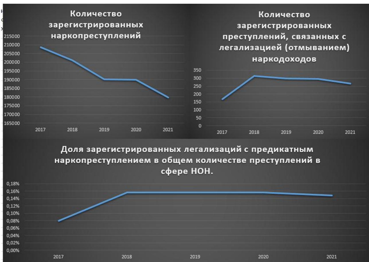
График динамики количества зарегистрированных преступлений, связанных с легализацией (отмыванием) наркодоходов.