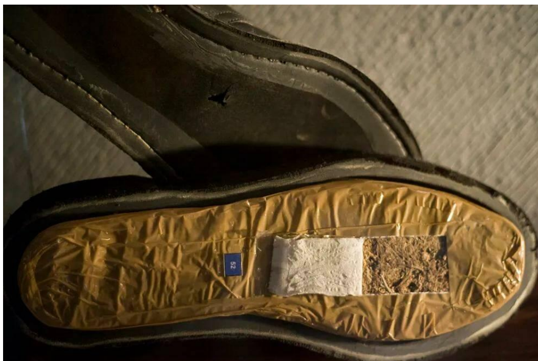
Рисунок 2. Обувь, используемая для контрабанды марихуаны. Данный ботинок находится в Музее наркотиков при штаб-квартире Министерства обороны в г. Мехико (Мексика).

2. Внутриполостной способ сокрытия. Этот способ связан с помещением НС и ПВ в тело человека. Это может быть осуществлено следующими способами: