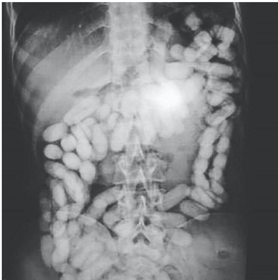
Рисунок 3. Рентгеновский снимок желудочно-кишечного тракта, в котором находятся 54 капсулы с героином.

2.2.3. Маскировка НС и ПВ в зубных протезах. Это делается в ротовой полости человека путем помещения НС и ПВ под коронки, фарфоровые или композитные пластины (виниры) или пломбы.