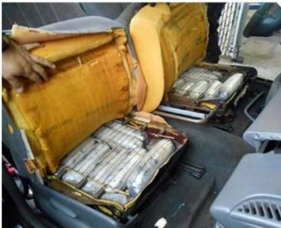
Рисунок 1 Наркотические средства в упаковке под тканевой основой сидения автомобиля.

2. Отправка почтовым отправлением. Этот способ контрабанды НС и ПВ был отмечен в 23 % изученных нами судебных приговоров (13 из 50). Как правило этот способ выполняется с использованием средств связи, которые обеспечивают анонимность абонентов (мессенджеры Telegram, Vtriar, Signal, Wire; анонимных фотохостингов; web-сайтов торговых площадок, созданных для торговли наркотиков в «теневом секторе» Интернета) для общения с соучастниками контрабанды НС и ПВ и потребителями (приобретателями) данных НС и ПВ, а также средств анонимных платежей (например, криптовалюты) для оплаты приобретенных НС и ПВ и их пересылку через государственную границу Российской Федерации. При отправке и доставке посылки используются различные почтовые и курьерские службы, при этом сведения об отправителе и о содержимом посылки либо не указываются, либо используются ложные.