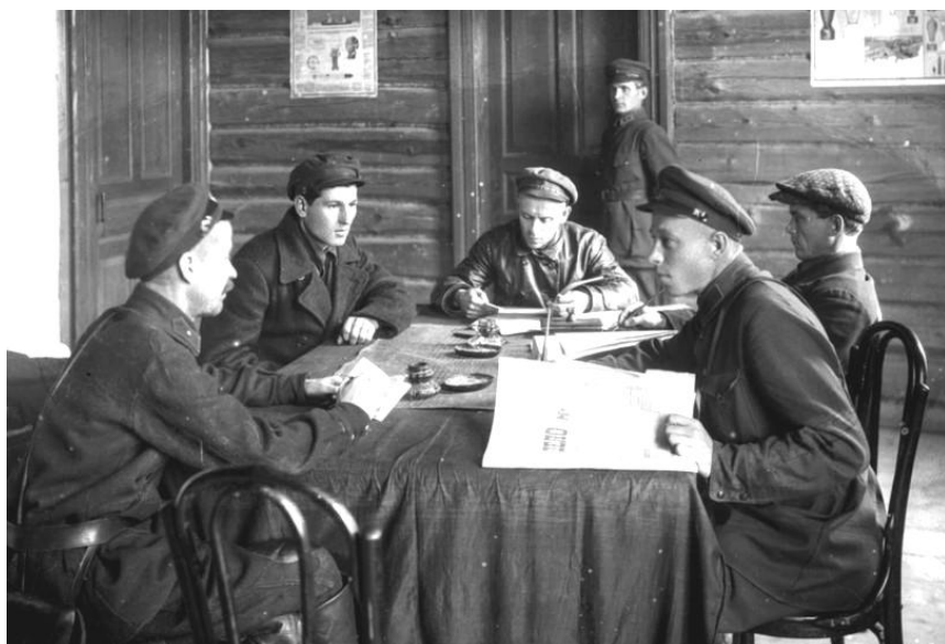
Участие волостных милиционеров и сельских исполнителей в составлении списков для раскулачивания