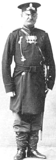
Околоточный надзиратель 1883 год