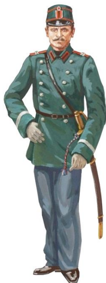
Унтер-офицер городской полиции 1867 год