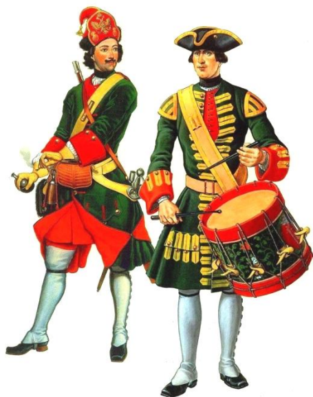
Солдаты Преображенского полка