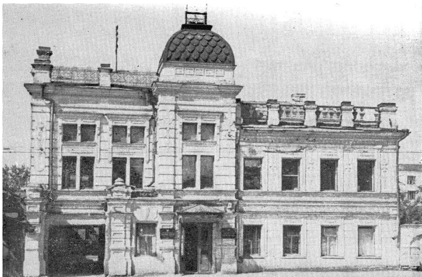
Здание по ул. Карла Либкнехта, 3, где размещалось Управление Екатеринбургской губернской милиции