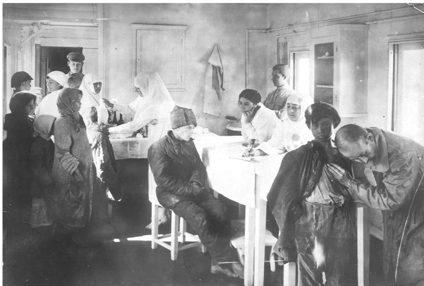
Регистрация и медосмотр беспризорных детей и подростков