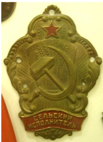
Знак сельского исполнителя