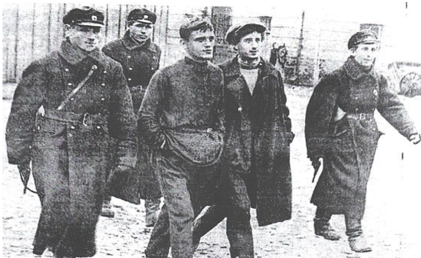
Этапирование хулиганов в районное отделение РКМ (1923 г.)