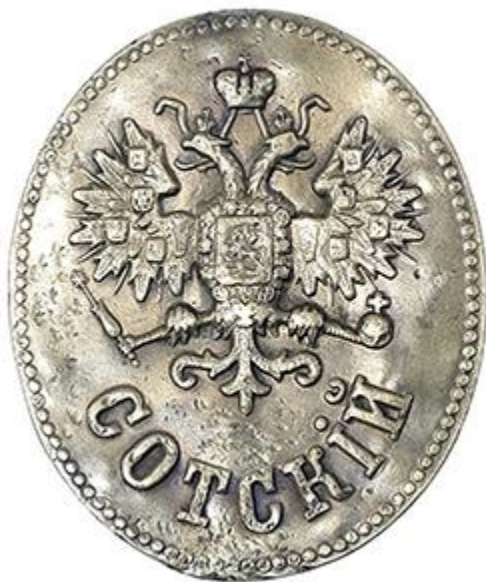
Жетон сотского образца 1838 года