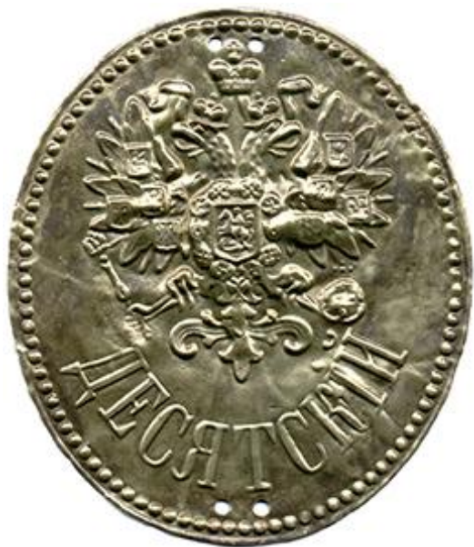
Жетон десятичного образца 1838 года