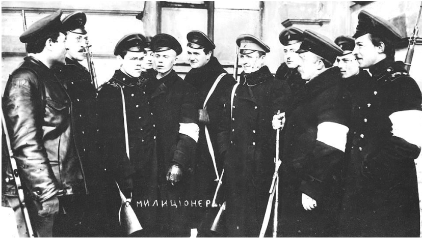
Гражданская милиция в Петрограде весной 1917 года