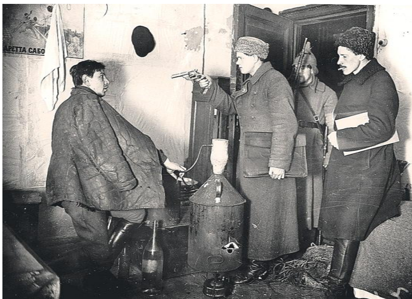
Изъятие самогонного аппарата работниками РКМ