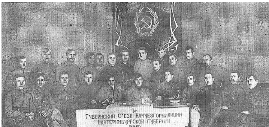
Участники первого губернского съезда начальников уездной и городской милиции. Екатеринбург, 1920 год