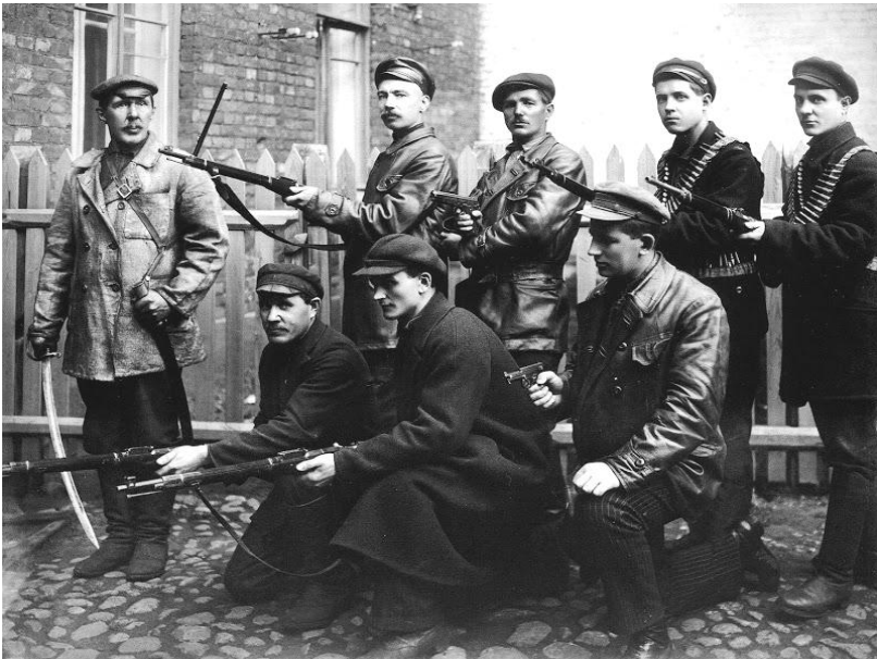
Красногвардейцы в 1917 году