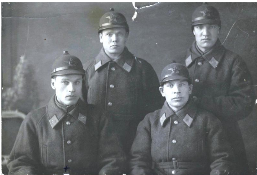
Участковые надзиратели в форме образца 1925 года