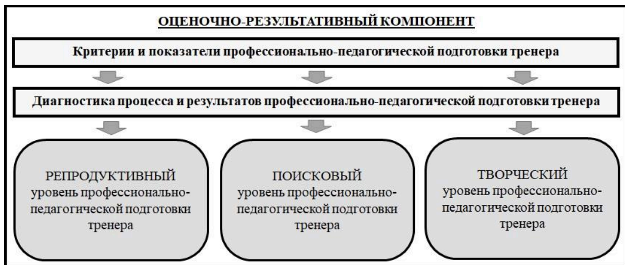
Рисунок 5 – Оценочно-результативный компонент модели организации подготовки тренеров по служебно-прикладным видам спорта

Оценочно-результативный компонент позволяет на основе диагностики процесса профессионально-педагогической подготовки определять уровни (креативный, продуктивный и репродуктивный) подготовленности тренеров к реализации задач организации тренировочного процесса в группах спортивного совершенствования по служебно-прикладным видам спорта (см. рисунок 5).