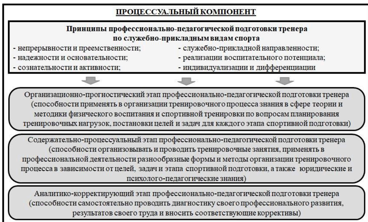
Рисунок 4 – Процессуальный компонент модели организации подготовки тренеров по служебно-прикладным видам спорта

Процессуальный компонент направлен на реализацию процесса профессионально-педагогической подготовки тренера. Этот процесс включает в себя совокупность профессионально значимых компетенций, технологию организации учебного процесса на основе методов, форм и средств, направленных на актуализацию профессиональных качеств, и включает ряд этапов: организационно-прогностический, содержательно-процессуальный, аналитико-корректирующий (см. рисунок 4).