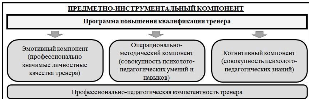
Рисунок 3 – Предметно-инструментальный компонент модели организации подготовки тренеров по служебно-прикладным видам спорта

Учитывая особенности организации тренировочного процесса в группах спортивного совершенствования по служебно-прикладным видам спорта и специфические задачи организации профессиональной служебной и физической подготовки сотрудника органов внутренних дел Российской Федерации, необходимо выделить следующие компоненты процесса профессионально-педагогической подготовки тренера: когнитивный