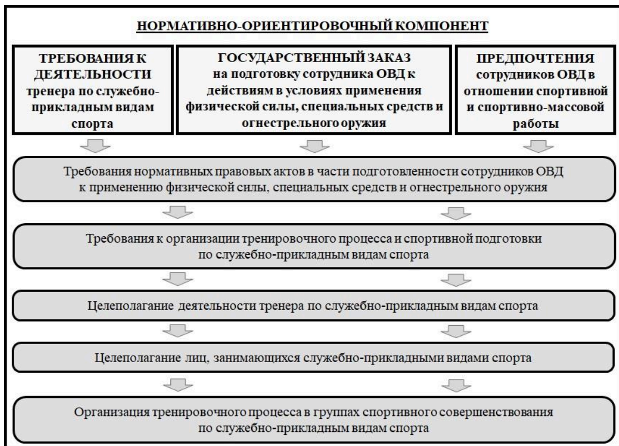
Рисунок 1 – Нормативно-ориентировочный компонент модели организации подготовки тренеров по служебно-прикладным видам спорта

Предметно-инструментальный компонент модели реализуется преимущественно в процессе повышения квалификации посредством реализации задач профессионально-педагогической и специальной подготовки тренеров. Данный компонент модели направлен на актуализацию профессионально-личностных качеств, формирование ценностного отношения к организации тренировочного процесса в служебно-прикладных видах спорта и его сопряжение с организацией учебного процесса в системе профессиональной служебной и физической подготовки (см. рисунок 3).