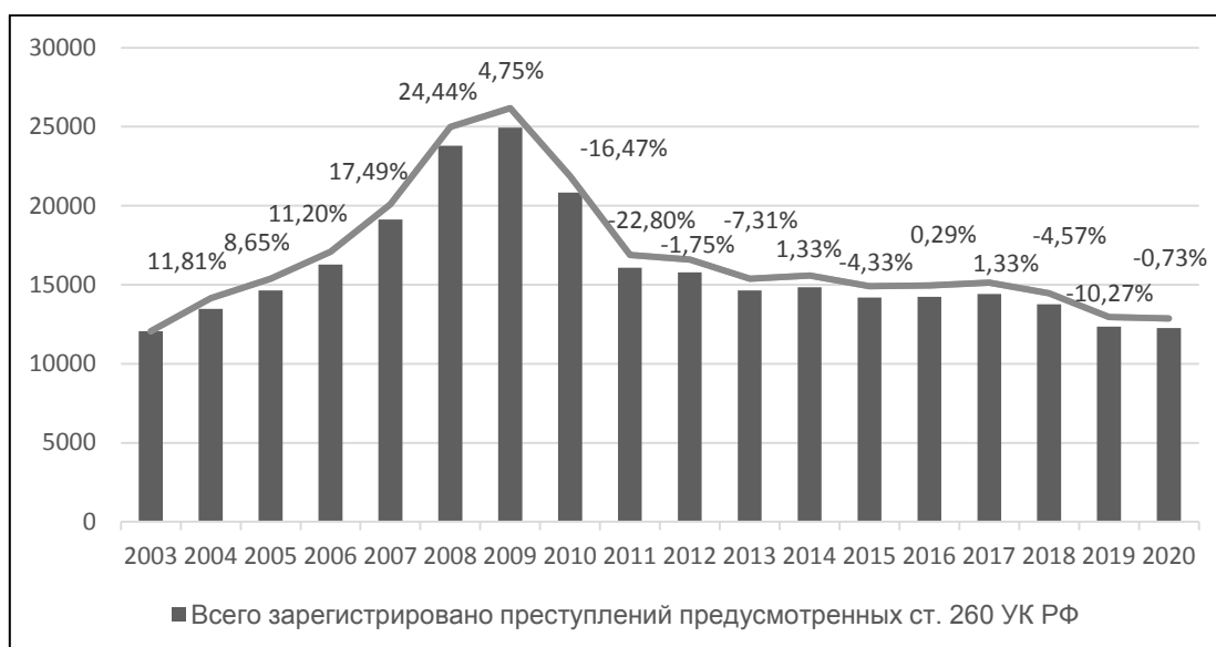
Рис. 2. Динамика преступлений, предусмотренных ст. 260 УК РФ, по отношению к предыдущему году, по данным ГИАЦ МВД России (2003–2020 гг.)

На рис. 2 показаны изменения количества зарегистрированных преступлений, предусмотренных ст. 260 УК РФ, по отношению к предыдущему году.