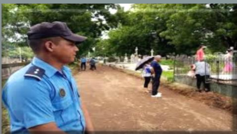
Охват общих мероприятий

Пешее патрулирование очень эффективно в местах с большим скоплением людей, например, на рынках и в районах, где патрулирование невозможно осуществлять ни на одном из транспортных средств.