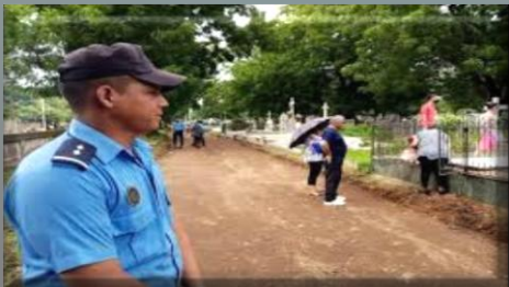
Coberturas de actividades comunes

El servicio de infantería es muy útil en lugares de gran aglomeración de personas tales como en mercados y zonas donde no se puede patrullar en ningún medio automotor