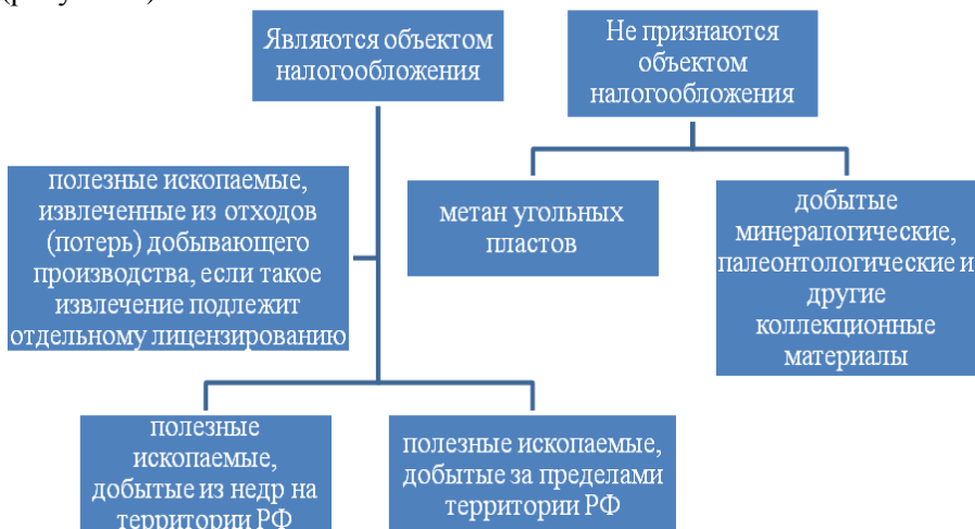
Рис. 7. Объекты налогообложения

Объекты налогообложения представлены полезными ископаемыми (рисунок 7).