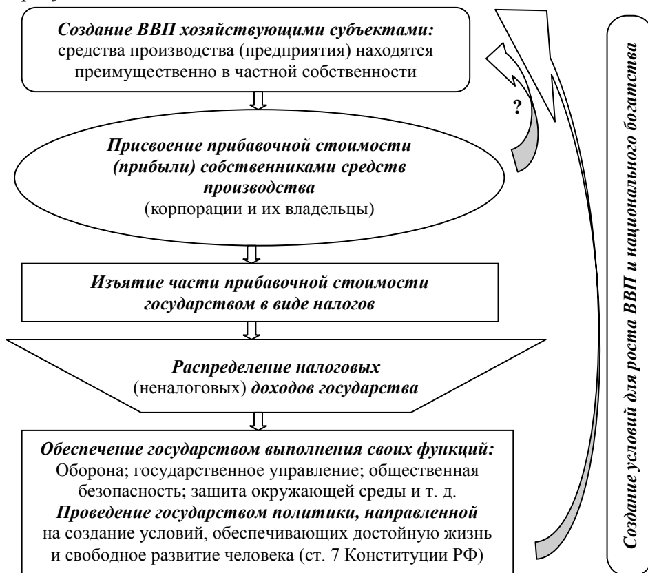
Рис. 2. Смешанная экономическая система

Смешанная экономическая система, основанная на капиталистических отношениях, имеет иную структуру экономики, отраженную на рисунке 2.