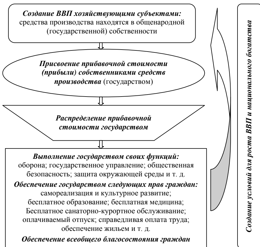
Рис. 1. Социалистическая экономическая система

Главной движущей силой капиталистической экономики является частная инициатива класса буржуазии (собственники средств производства), целью которой считается получение прибыли на вложенный капитал и личное обогащение. При этом задача государства в основном заключается в обеспечении прав граждан и сдерживании капиталистов в жажде наживы. Главной движущей силой в социалистической экономике является стремление человека к самореализации и осознание им того, что любой производительный труд будет вознагражден. При этом средства производства находятся в общенародной (государственной) собственности, что гарантирует отсутствие дискриминации при распределении доходов, рост национального богатства и благосостояния граждан. На рисунке 1 представлена упрощенная схема социалистической экономики.