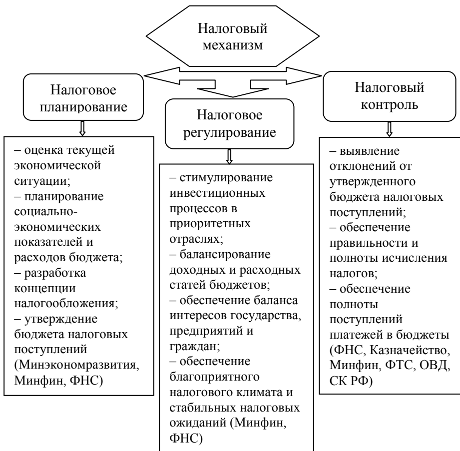
Рис. 3. Налоговый механизм

Субъектами налоговой политики выступают Федерация, субъекты Федерации и муниципальные образования (города, районы, округа, поселения). Каждый из субъектов обладает налоговым суверенитетом в пределах полномочий, установленных налоговым законодательством. Эффективное функционирование налогового механизма возможно только при слаженной работе законодательной и исполнительной ветвей власти, т. к. налоговое законодательство разрабатывается представительными органами власти, а исполнение задач по налоговому наполнению бюджетов лежит на исполнительном органе – ФНС РФ.