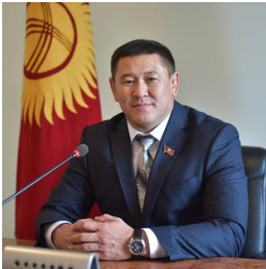
Депутат Жогорку Кенеша Кыргызской Республики Жакышов Русланбек Шергазиевич

Добрый день уважаемые участники международного молодежного Форума "Безопасное общество: стратегии профилактики правонарушений"! В этом году мы отмечаем 55-лет образованию Академии Министерства внутренних дел Кыргызской Республики, и это особенно значимое время для обсуждения важных аспектов обеспечения безопасности и защиты прав граждан.