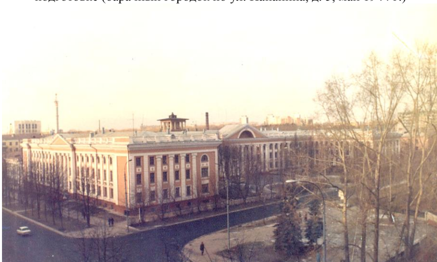
Учебный корпус Свердловского пожарно-технического училища МВД СССР по адресу г. Свердловск, ул. Мира 22, построен в 1955 году. Использовался для временного обучения курсантов – слушателей для подготовки специалистов для прохождения службы в системе ИТК МВД СССР.