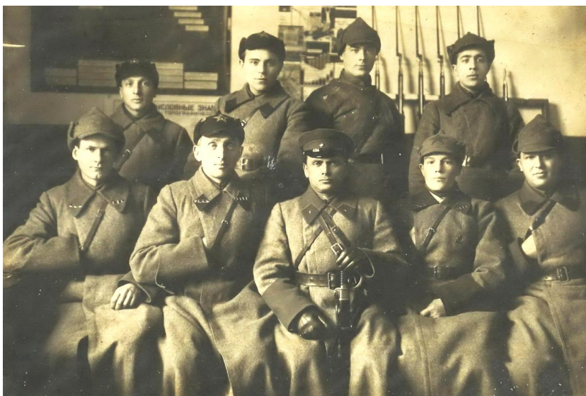
Начальствующий состав и курсанты Уральской областной школы ОГПУ в г. Свердловске в 1932 году (Архив УФСБ России по Свердловской области)