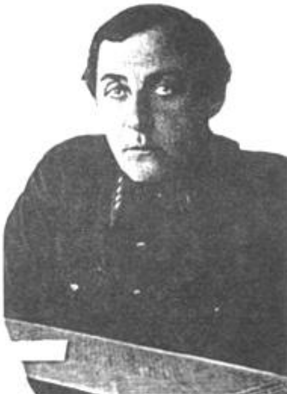
Рапопорт Григорий Яковлевич (1890–1938). Полномочный представитель ОГПУ по Уральской области с 20 марта 1931 года по 25 июля 1933 года). Член ВКП(б). Служил в органах ВЧК (ОГПУ) с 1918 года. Репрессирован в 1938 году