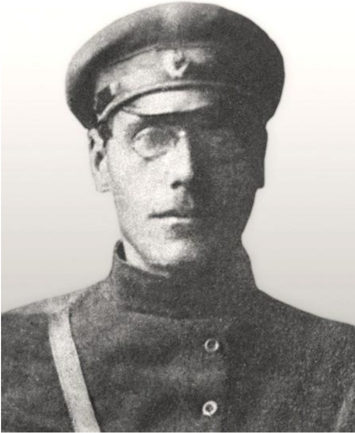
Савотин Петр Григорьевич – первый начальник Екатеринбургского губернского управления НКВД РСФСР с октября 1919 по 1923 год. Содействовал созданию и обеспечению учебного процесса на курсах младших и старших милиционеров в 1920 году (ГАСО. Ф. 9р. Оп. 1. Д. 24)