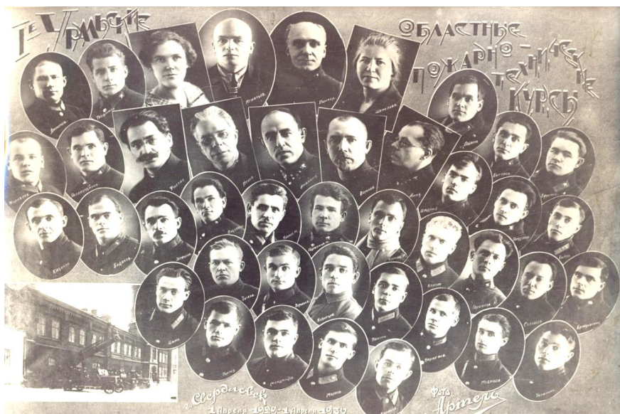
Первый выпуск Уральских областных пожарно-технических курсов в 1930 г. В правом нижнем углу – здание пожарной части № 1 г. Свердловска на ул. Карла Либкнехта д. 8.