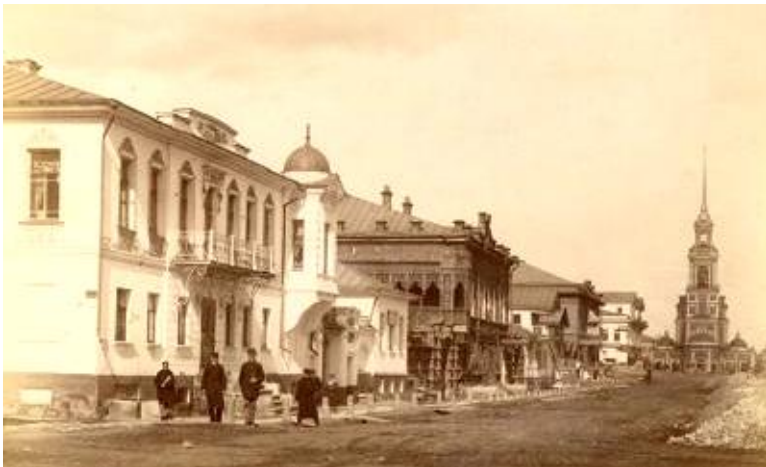
Здание по проспекту Ленина, д. 17, (бывший дом купца Рязанова, Главный проспект, д. 19 до революции 1917 года), где располагалось до 1931 года Управление РКМ по Уральской области (с 1919 по 1923 г. – Управление по РКМ Екатеринбургской губернии) (ГАСО. Ф. 9р. Оп. 1. Д. 5)