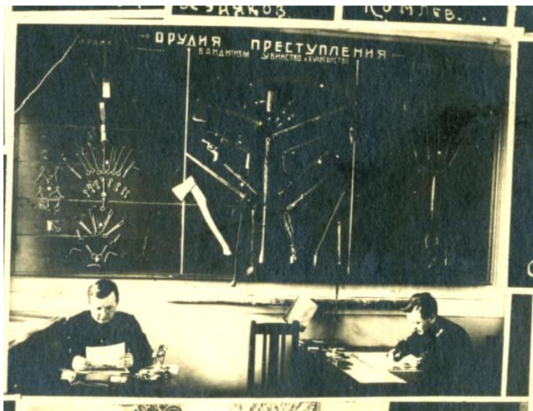
Учебное занятие в специализированном кабинете криминалистики.