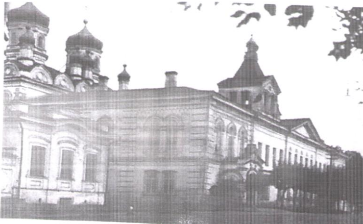
Бывший дом Екатеринбургского архиепископа на улице Чапаева, д. 9 (бывшая улица Архиепископская). Первое здание курсов младшего начальствующего состава в г. Екатеринбурге в 1920 г. (ГАСО. Ф. 9р. Оп. 1. Д. 2)