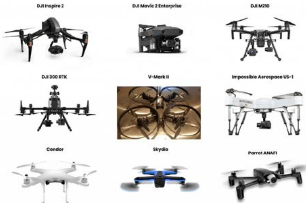
Рис. 2. Типы БАС, используемые полицейскими управлениями в США

Рассмотрим преимущества, получаемые при использовании БАС правоохранительными органами, благодаря которым они быстро внедряются по всему миру.