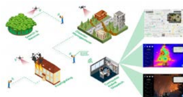
Рис. 6. БАС в охране общественного порядка и обеспечении общественной безопасности

Это решение использует сети 4G/LTE/5G для полетов за пределами прямой видимости (BVLOS) или в режиме расширенной прямой видимости (EVLOS), а также для потоковой передачи видео высокого разрешения (HD). На рисунке 6 приведена иллюстрация того, как работает система [7].