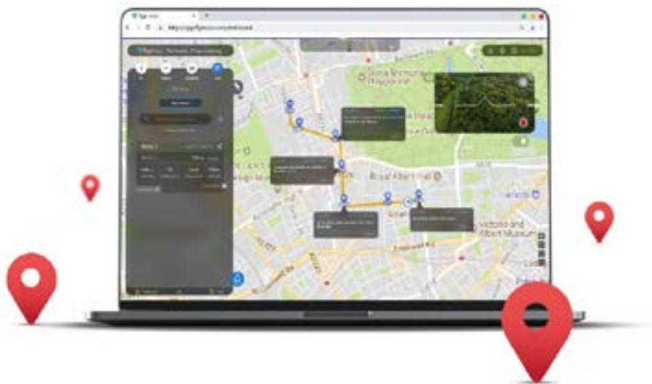
Рис. 10. Пример панели доступа к карте

Быстрый доступ к карте и видеоархив. Оператор, использующий панель управления FlytBase (рисунок 10), получает доступ к карте, на которой в режиме реального времени отображается местоположение всех подключенных к системе беспилотных летательных аппаратов. Во время выполнения задания оператор может закрепить важную