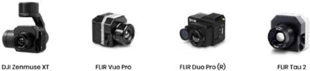
Рис. 4. Тепловизионное оборудование, используемое совместно с БАС в США