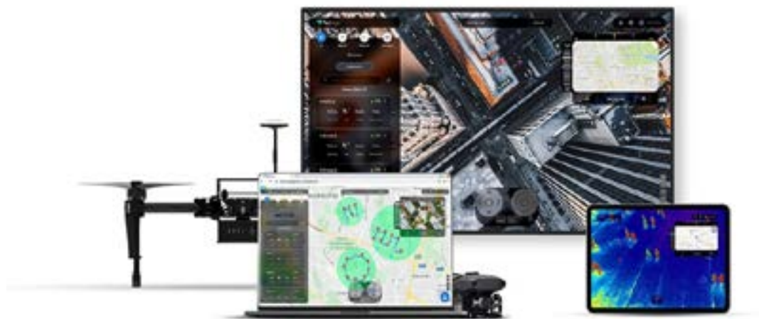
Рис. 9. Управление несколькими беспилотниками с помощью одной панели управления

Управление одновременно несколькими беспилотниками. Один оператор может использовать панель управления FlytBase для управления несколькими дронами, включая подвесное оборудование каждого из них (рисунок 9). Такая возможность весьма полезна в операциях, требующих охвата большой территории с разных точек зрения, например при поиске и спасении, наблюдении, розыске людей и т. д.