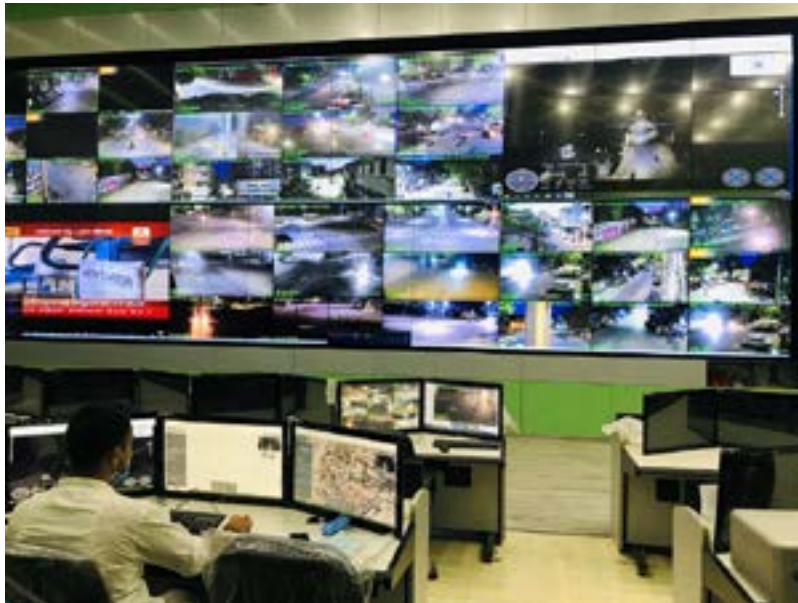
Рис. 7. Центральный диспетчерский пункт FlytBase

Эта функция сыграла большую роль во время карантина в период пандемии COVID-19 в Индии в 2020 г. Стартап под названием Dronelab с помощью волонтеров и полиции охватил БАС весь город Ахмадабад (индийский город в штате Гуджарат) и транслировал видео непосредственно на панель управления FlytBase в центральном диспетчерском пункте (рисунок 7).