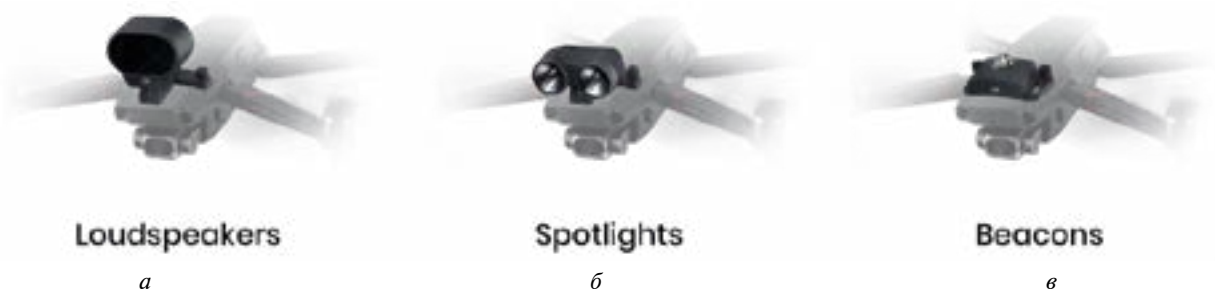
Рис. 5. Группа навесных устройств для использования с БАС

Следующая группа устройств – громкоговорители (рисунок 5а). Большие беспилотные летательные аппараты могут оснащаться громкоговорителями, которые используются для распространения объявлений и сдерживания толпы.