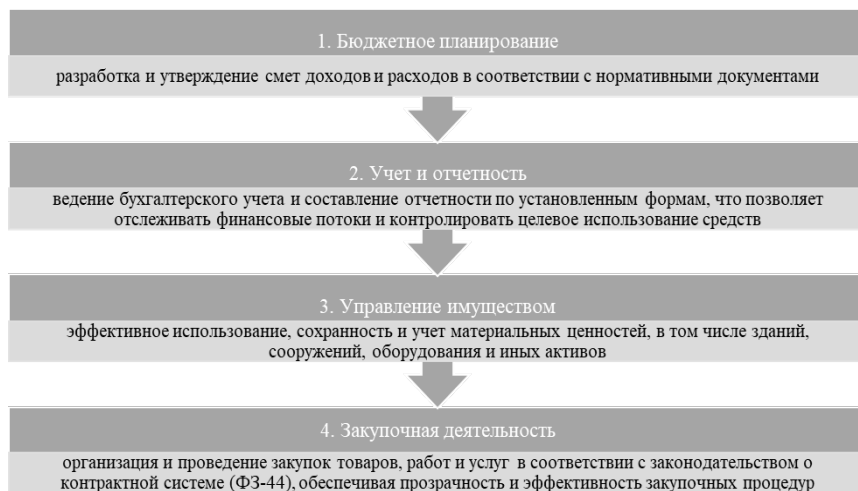
Рис. 2. Общие особенности финансово-хозяйственной деятельности бюджетных учреждений МВД России

Схематично общие особенности (отличительные черты) ФХД бюджетных учреждений МВД России можно представить следующим образом (рис. 2):