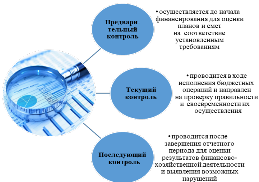
Рис. 1. Формы финансового контроля

ФХД бюджетных учреждений МВД России включает управление финансовыми ресурсами, материальными ценностями, а также процессами, связанными с выполнением бюджетных обязательств и достижением уставных целей.