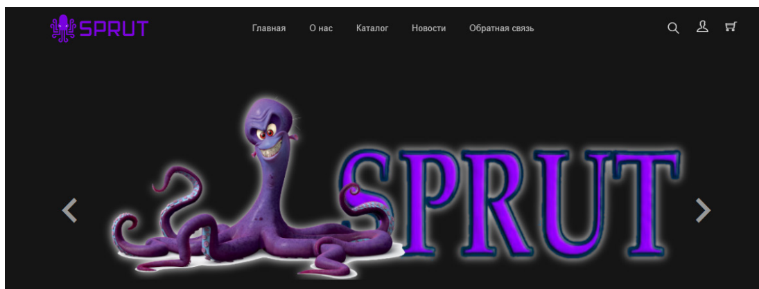
Рис. 1. Интерфейс оперативно-следственного тренажера «Спрут»

Так, для обеспечения достижения ключевых целей и задач, обозначенных Стратегией цифровой трансформации в Московском университете МВД России имени В. Я. Кикотя на 2022–2024 гг., кафедрой оперативно-разыскной деятельности филиала проведена работа по созданию и интеграции в образовательный процесс оперативно-следственного тренажера «Спрут» (далее – ОСТ «Спрут») (рис. 1).