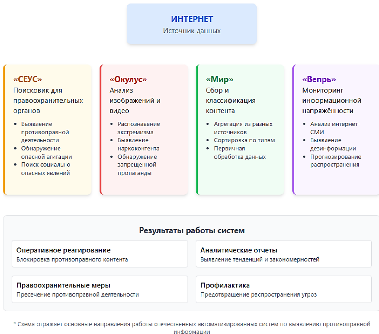
Рис. 2. Автоматизированные поисковые системы для выявления противоправной информации в Интернете 20

Эти системы образуют комплексный инструмент для мониторинга и выявления противоправного контента в различных сегментах информационного пространства (рисунок 2);