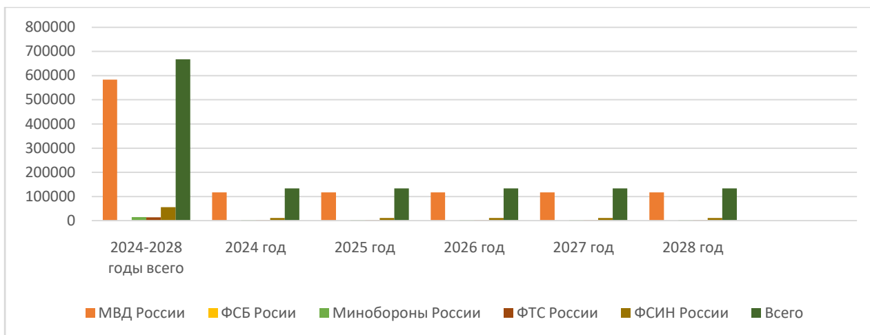
Рис 1. Применение мер безопасности