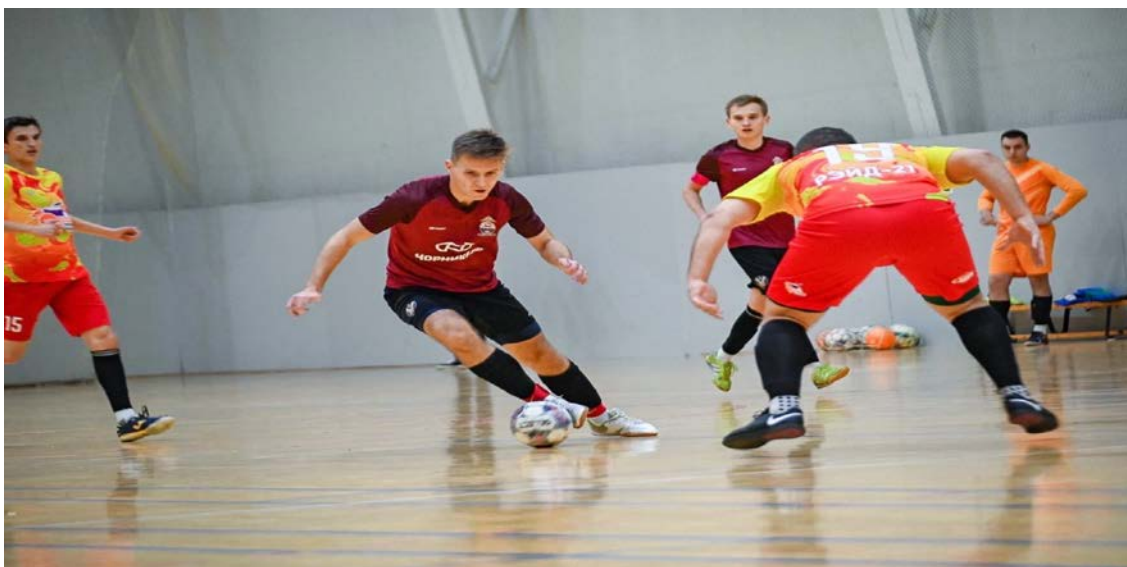
Рис. 1. Реализация командной работы в футболе