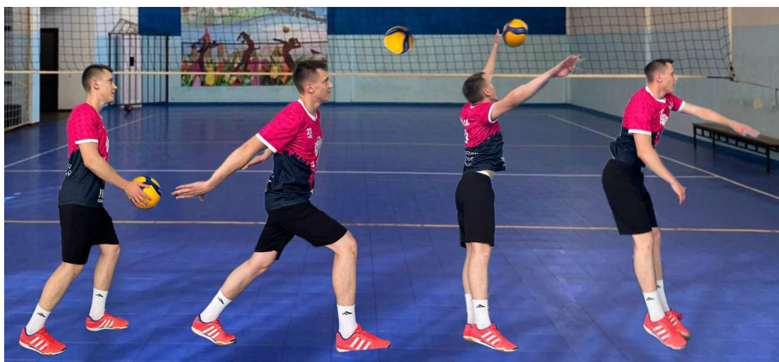
Рис. 8. Подача в прыжке

Силовая подача — подача мяча в прыжке. Это самая сложная разновидность подачи, которая используется преимущественно профессиональными игроками. Чаще всего ее применяют в мужских командах.