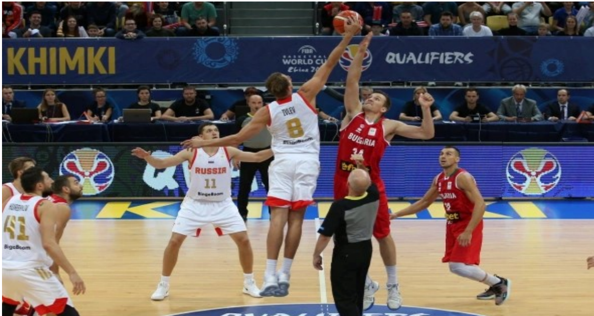
Рис. 6. Реализация командной игры в баскетбол

до 5 минут (нападение и защита в позиционной игре), наибольшее потребление кислорода достигается только к концу работы (за счёт анаэробно-аэробного процесса).