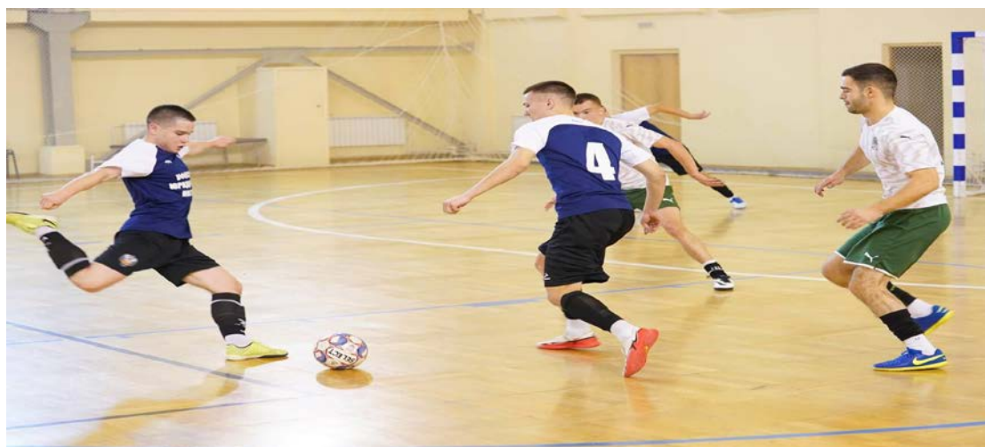
Рис. 4. Реализация командной игры в мини-футбол

Волейбол воспитывает чувство ответственности перед коллективом, умение работать в команде и доверять окружающим. Также он помогает формированию привычки регулярно заниматься спортом и вести здоровый образ жизни.