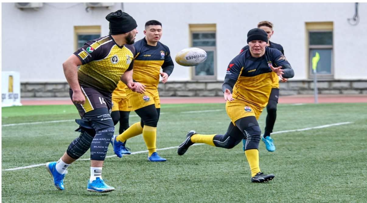
Рис. 11. Отработка скоростных передач в регби

В регби, как и в любом другом виде спорта, физическая подготовка играет ключевую роль. Она включает в себя несколько важных аспектов: