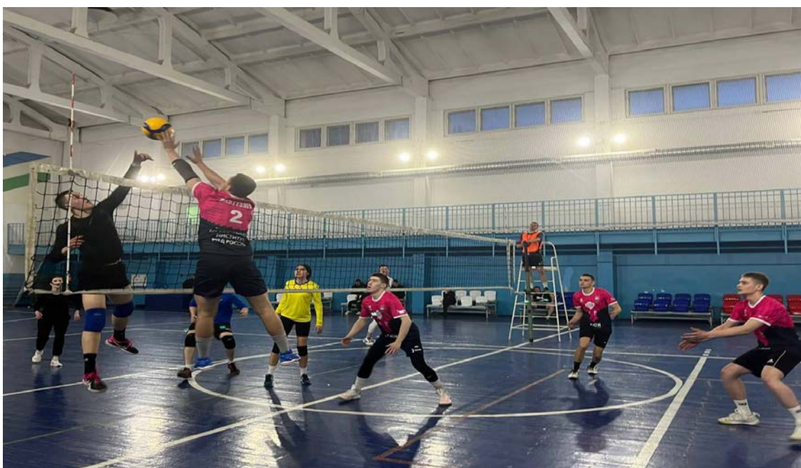
Рис. 2. Реализация командной работы в волейболе

Основными спортивными командными играми считают волейбол, мини-футбол, регби, баскетбол.