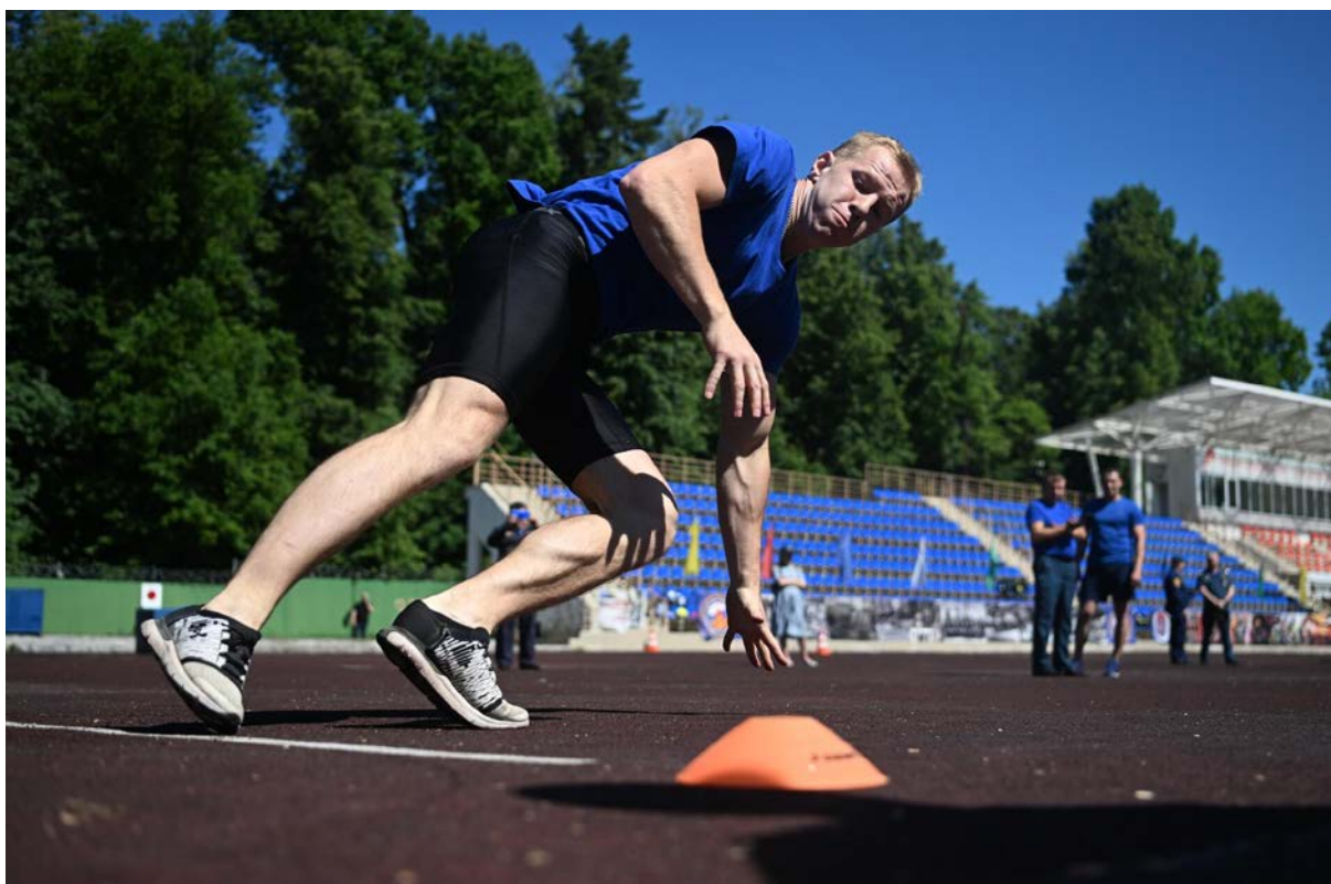
Рис. 15. Упражнение «челночный бег»

Внедрение командных спортивных соревнований способствует мобилизации сил и позволяет сравнивать свои достижения с результатами товарищей. Поощрение вселяет уверенность в свои силы, развивает чувство собственного достоинства, помогает сплочению коллектива. Критика и самокритика предполагают объективную оценку действий обучаемых, воспитание чувства ответственности, выявление и устранение недостатков. Критика применяется без резкости и грубости. Принуждение позволяет заставить слабоуспевающих выполнить упражнение, проявить волевые качества, смелость и решительность.