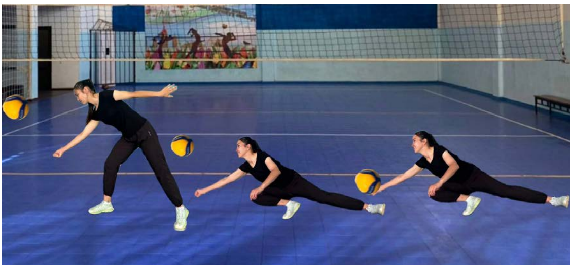
Рис. 7. Прием мяча снизу одной рукой