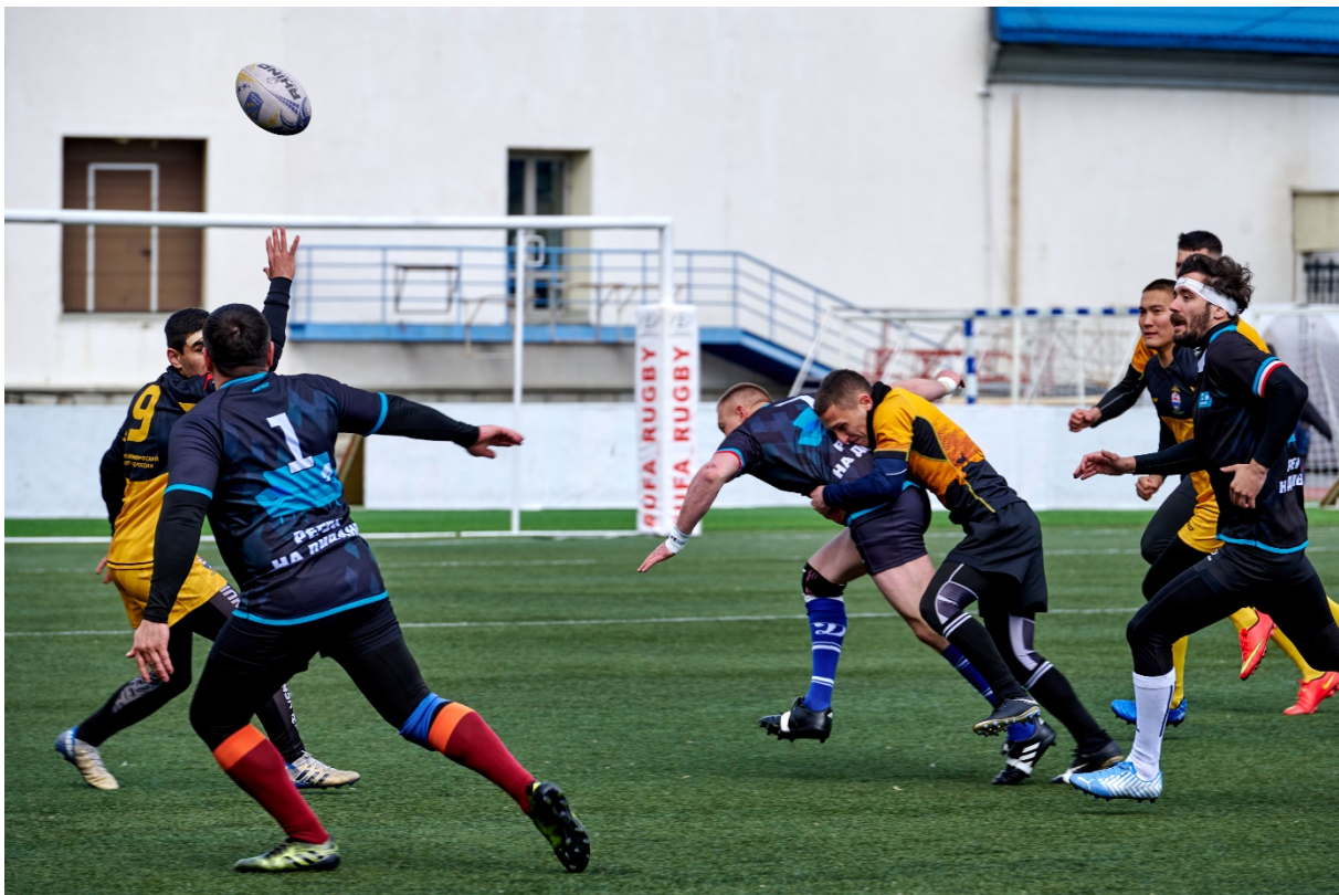
Рис. 10. Силовая борьба (силовой контакт) в игровом моменте

Регби – это не только спорт, но и соревновательная деятельность, требующая специальной подготовки. Во время игры необходимо развивать координационные способности, гибкость и зрительную систему. Спортсмену нужно следить за перемещениями игроков с мячом и без него, а также за летящим мячом. Он должен определить точку его падения, поймать его и за очень короткое время проанализировать ситуацию, чтобы принять правильное решение.