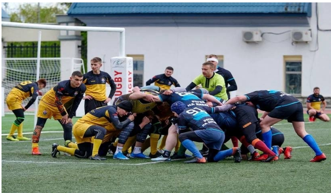
Рис. 5. Реализация командной игры в регби

В регби игрокам необходимо обладать различными физическими качествами: силой, мощностью, выносливостью, скоростью и подвижностью. Лишь немногие виды спорта требуют такого широкого спектра навыков.