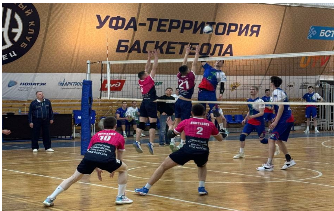
Рис. 3. Реализация командной игры в волейболе

Спортивные игры традиционно популярны во внеурочной работе благодаря разностороннему воздействию на организм человека, в том числе эмоциональному, поэтому служат эффективным средством физического воспитания. Разнообразные движения и действия, выполняемые участниками спортивной игры, влияют на общее состояние здоровья человека. Они способствуют укреплению двигательного аппарата, улучшению общего обмена веществ, повышению жизнедеятельности всех органов и систем организма и являются средством активного отдыха особенно для лиц, занятых напряженной умственной деятельностью. Спортивные командные игры относятся к тем элементам игровой деятельности, в которых ярко выражена роль движений, так как для спортивной игры характерны активные двигательные действия. Эти действия частично ограничиваются правилами (общепринятыми, установленными руководителем или играющими). Они направляются на преодоление различных трудностей по пути к достижению поставленной цели (выиграть, овладеть определенными приемами) 1 .