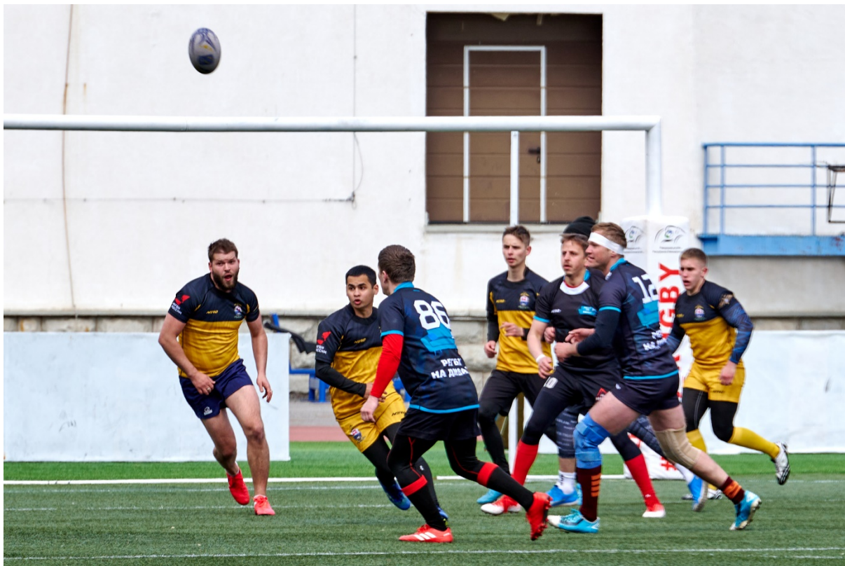
Рис. 12. Классическое регби

МВД России позволит им проявить все свои лучшие качества в соревновательной борьбе.