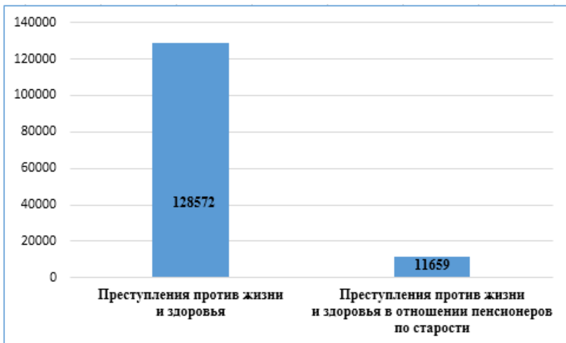
Рис. 2.1. Соотношение преступлений против жизни и здоровья пенсионеров по старости к общему массиву зарегистрированных преступлений против жизни и здоровья в 2024 г.

По ст. 112 Уголовного кодекса Российской Федерации 17 «Умышленное причинение средней тяжести вреда здоровью» – 22 159, из них в отношении пожилых – 1 533 (6,9 %).