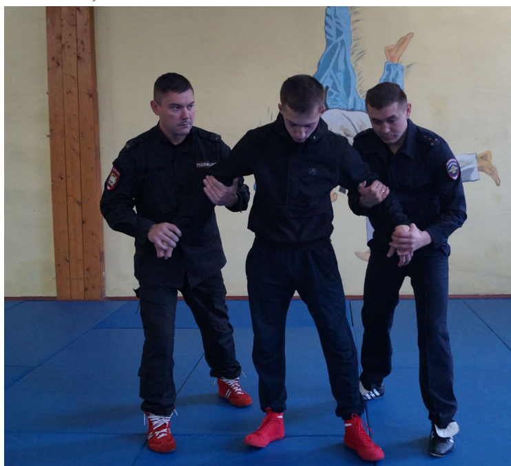
Фото № 26

Б. Оба сотрудника одновременно захватывают запястье правонарушителя одной рукой и выполняют прием дожим кисти «под ручку» (фото № 26, 27).