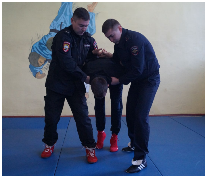
Фото № 29

Б. Оба сотрудника одновременно захватывают предплечье правонарушителя одной рукой и выполняют загиб руки за спину «толчком» (фото № 30).