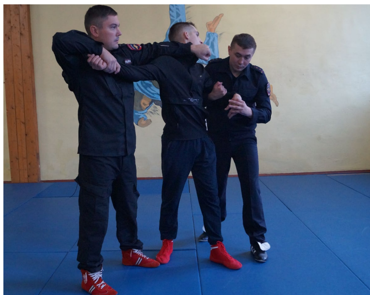
Фото № 16

Б. Первый сотрудник при подходе спереди выполняет рычаг руки через предплечье (фото № 16), одновременно второй сотрудник выполняет дожим кисти «под ручку» (фото № 17).