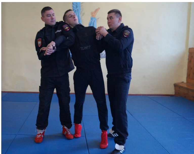
Фото № 17

2. Ограничение свободы передвижения правонарушителя вдвоем с напарником с выполнением загиба руки за спину «толчком».