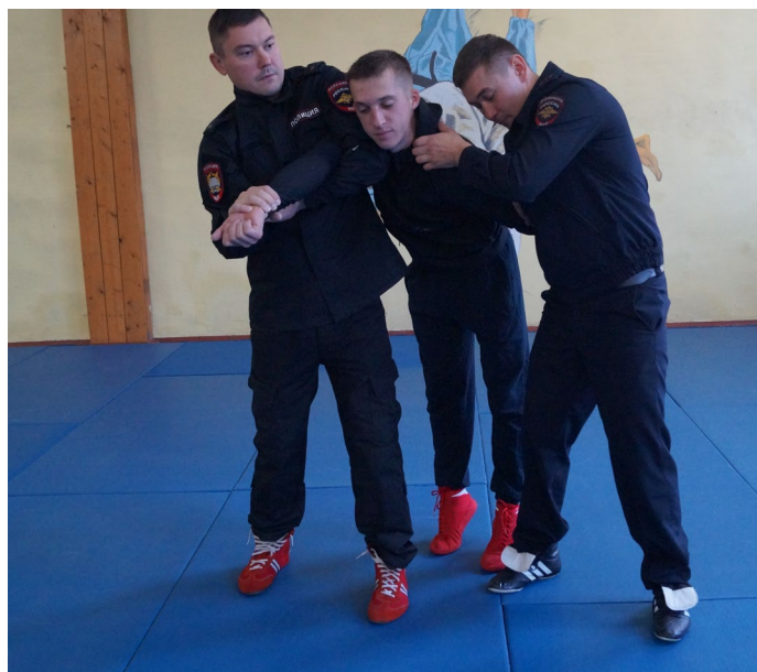
Фото № 21

3. Ограничение свободы передвижения правонарушителя вдвоем с напарником с выполнением броска захватом ног сзади.