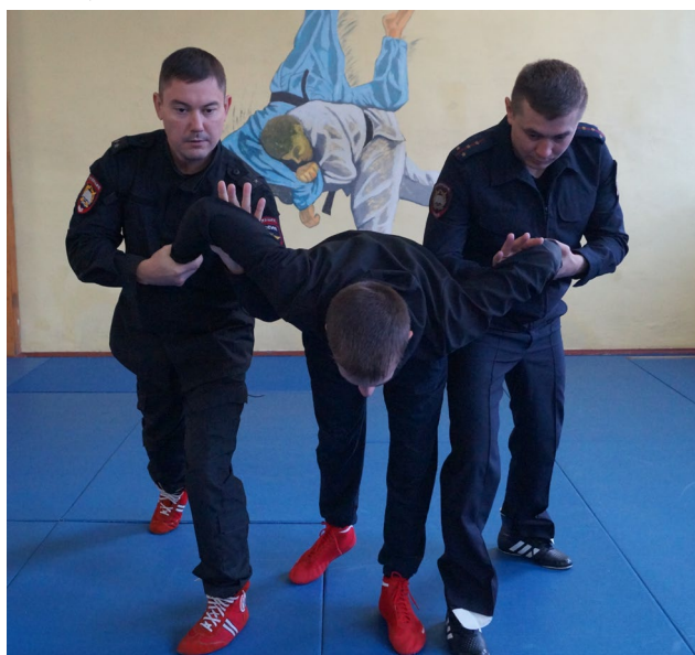
Фото № 30

Б. Оба сотрудника одновременно захватывают предплечье правонарушителя одной рукой и выполняют загиб руки за спину «толчком» (фото № 30).