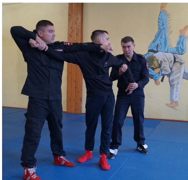
Фото № 10

А. Первый сотрудник захватывает одной рукой предплечье задерживаемого, а другой – плечо. Одновременно второй сотрудник двумя руками обхватывает другую руку правонарушителя, блокирует ее и зависает. Далее первый сотрудник наносит расслабляющий удар основанием руки в его лицо и выполняет рычаг руки через предплечье (фото № 10). Вторым сотрудником, не отпуская захваченную руку, разворачивает и выполняет дожим кисти «под ручку» (фото № 11).