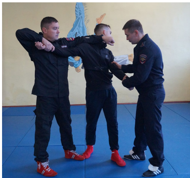
Фото № 12

Б. Оба сотрудника захватывают одной рукой предплечье задерживаемого, а другой – плечо с обеих сторон (фото № 12). Один из сотрудников наносит расслабляющий удар основанием руки в его лицо и одновременно с напарником выполняет рычаг рук через предплечье (фото № 13).