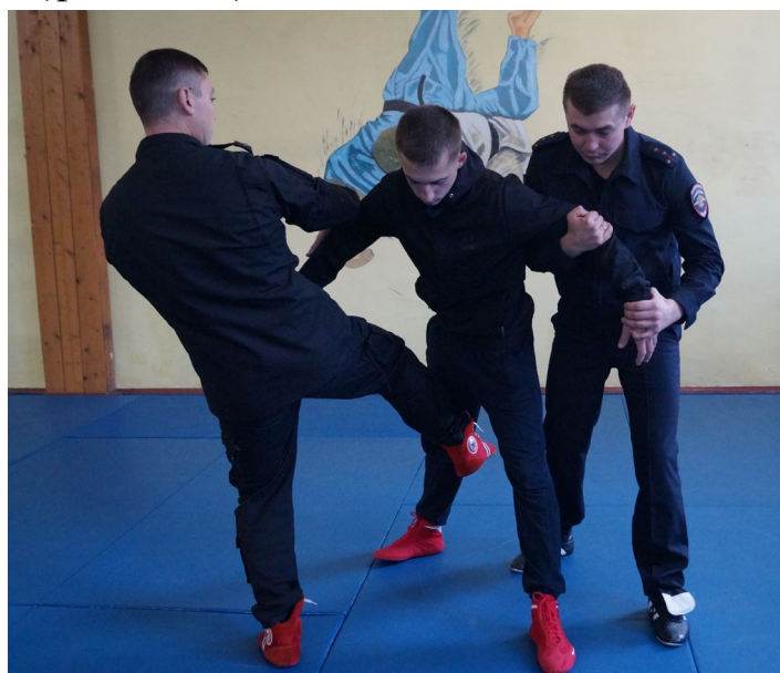
Фото № 14

А. Первый сотрудник при подходе спереди блокирует левую или правую руку правонарушителя и тянет ее вниз, одновременно второй сотрудник при подходе сзади выполняет прием дожим кисти «под ручку» (фото № 14). После этого первый сотрудник переходит на загиб руки за спину «рывком» (фото № 15).