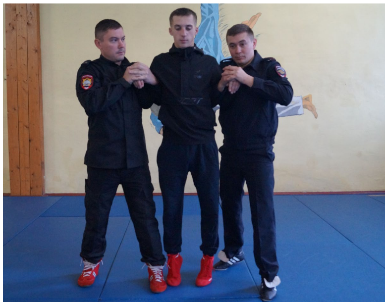
Фото № 27

2. Ограничение свободы передвижения правонарушителя вдвоем с напарником с выполнением загиба руки за спину «толчком».