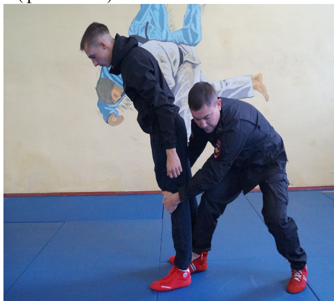
Фото № 22

Первый сотрудник, стоящий за спиной правонарушителя, выполняет бросок захватом ног сзади (фото № 22). Второй сотрудник сокращает дистанцию и выполняет загиб руки за спину, скручивая внутрь. После этого первый сотрудник загибает за спину свободную руку правонарушителя (фото № 23).