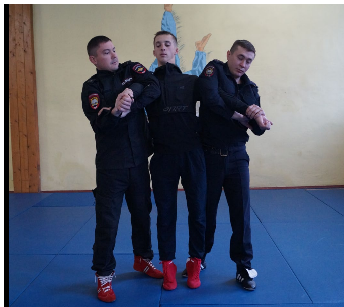
Фото № 13