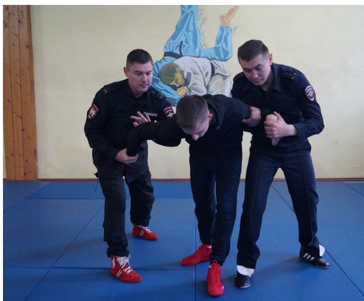
Фото № 24

А. Первый сотрудник блокирует левую или правую руку правонарушителя и тянет ее вниз, одновременно второй сотрудник выполняет прием дожим кисти «под ручку» (фото № 24). После этого первый сотрудник переходит на загиб руки за спину (фото № 25).