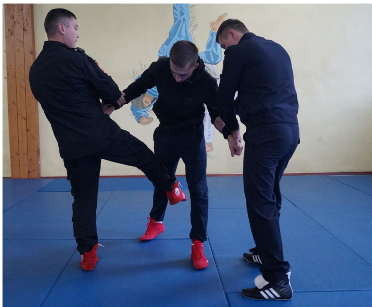
Фото № 8

Оба сотрудника захватывают предплечья задерживаемого с обеих сторон, разводят руки в стороны. Один из сотрудников наносит расслабляющий удар голенью по бедру правонарушителя изнутри и одновременно с напарником выполняет скручивание рук внутрь (фото № 8). После чего они переходят на загиб рук за спину (фото № 9).