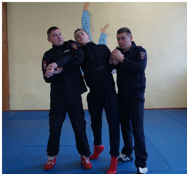
Фото № 11

Б. Оба сотрудника захватывают одной рукой предплечье задерживаемого, а другой – плечо с обеих сторон (фото № 12). Один из сотрудников наносит расслабляющий удар основанием руки в его лицо и одновременно с напарником выполняет рычаг рук через предплечье (фото № 13).