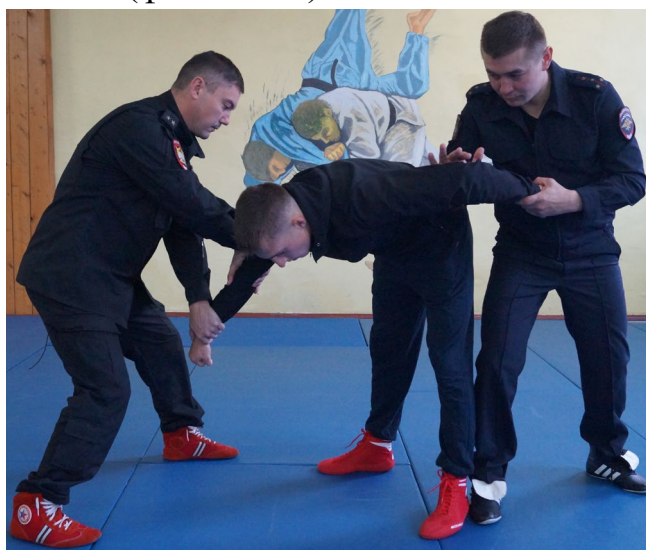
Фото № 18

А. Первый сотрудник при подходе спереди блокирует левую или правую руку правонарушителя и тянет ее вниз, одновременно второй сотрудник при подходе сзади выполняет прием загиб руки за спину «толчком» (фото № 18). После этого первый сотрудник переходит на загиб руки за спину «рывком» (фото № 19).