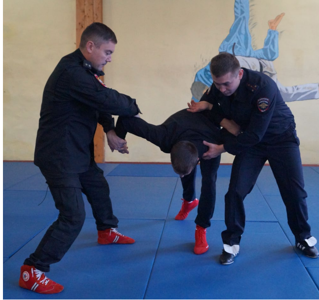
Фото № 19

Б. Первый сотрудник при подходе спереди выполняет рычаг руки через предплечье, одновременно второй сотрудник выполняет загиб руки за спину «толчком» (фото № 20, 21).