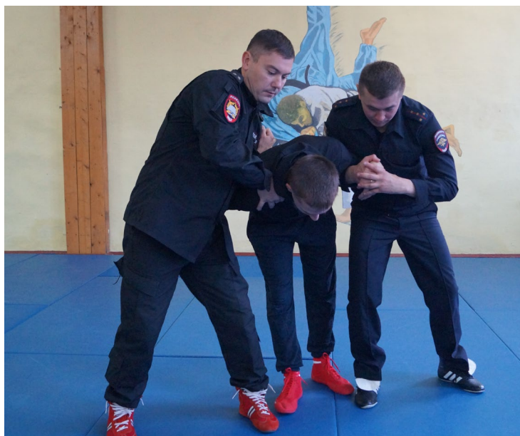
Фото № 25

Б. Оба сотрудника одновременно захватывают запястье правонарушителя одной рукой и выполняют прием дожим кисти «под ручку» (фото № 26, 27).