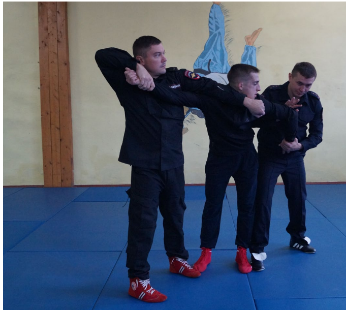
Фото № 20

Б. Первый сотрудник при подходе спереди выполняет рычаг руки через предплечье, одновременно второй сотрудник выполняет загиб руки за спину «толчком» (фото № 20, 21).