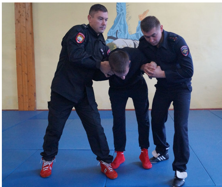
Фото № 15

Б. Первый сотрудник при подходе спереди выполняет рычаг руки через предплечье (фото № 16), одновременно второй сотрудник выполняет дожим кисти «под ручку» (фото № 17).