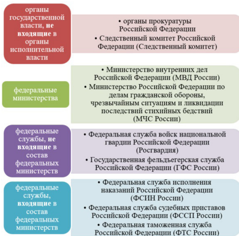
Рис. 3. Иные виды государственной службы

Государственная служба иных видов (рис. 3) предполагает возможность прохождения государственной службы Российской Федерации, т. е. перечень иных видов государственной службы и, соответственно, в целом система государственной службы являются открытыми.