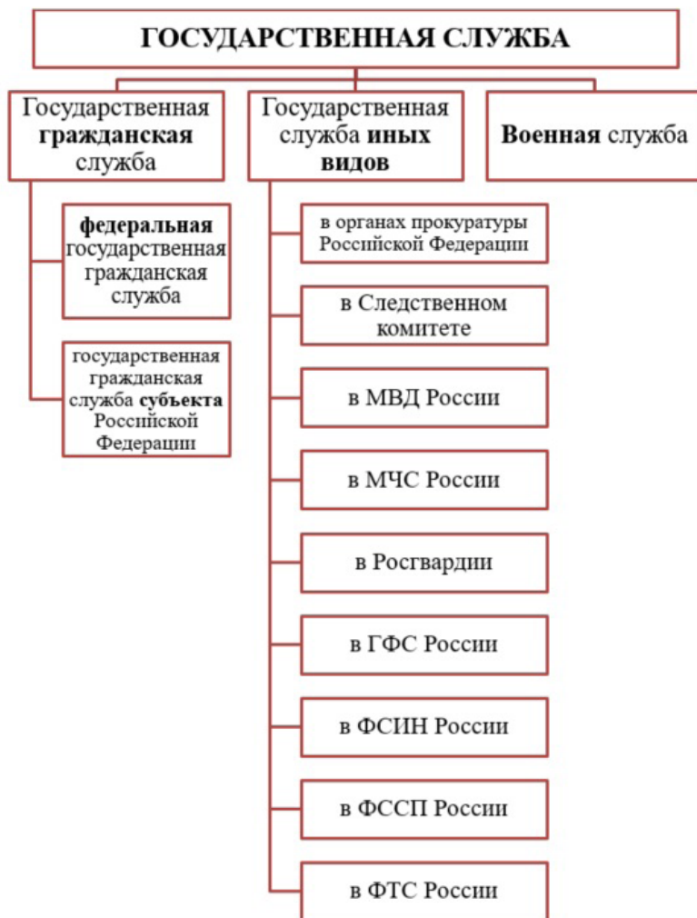
Рис. 2. Виды государственной службы

Государственная служба Российской Федерации состоит из нескольких видов и подвидов государственной службы (рис. 2).