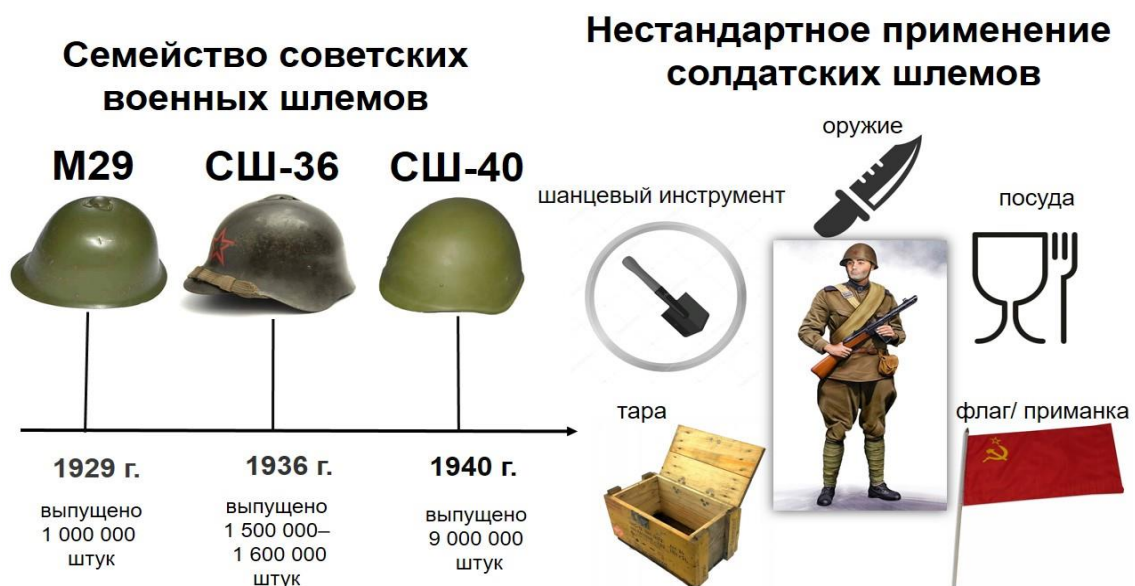
Рис. Советские шлемы и их нестандартное применение

Можно сказать, что каска – это микро-история войны: в ней видно все: и металл, и фабрики, и фронт, и солдата. Она напоминает, что даже самые простые детали экипировки имеют свое место в великой картине истории.