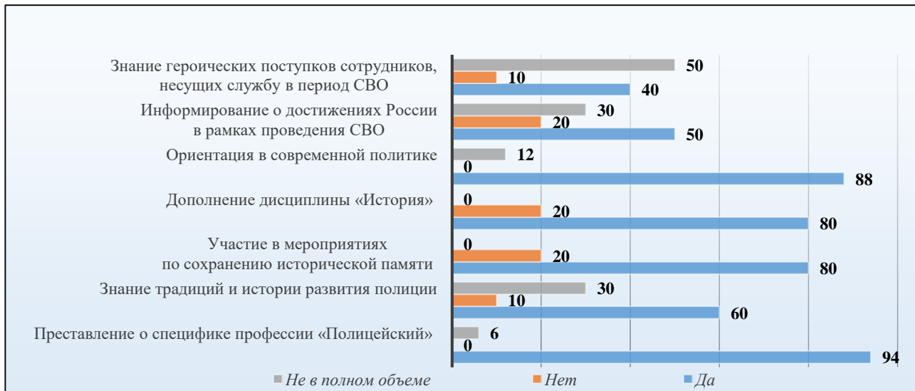
Рис. 2. Данные анкетирования слушателей ЦПП, проходящих обучение по основным программам профессиональной подготовки

положительно, отметив ценность исторических знаний и их роль в формировании профессиональных навыков.